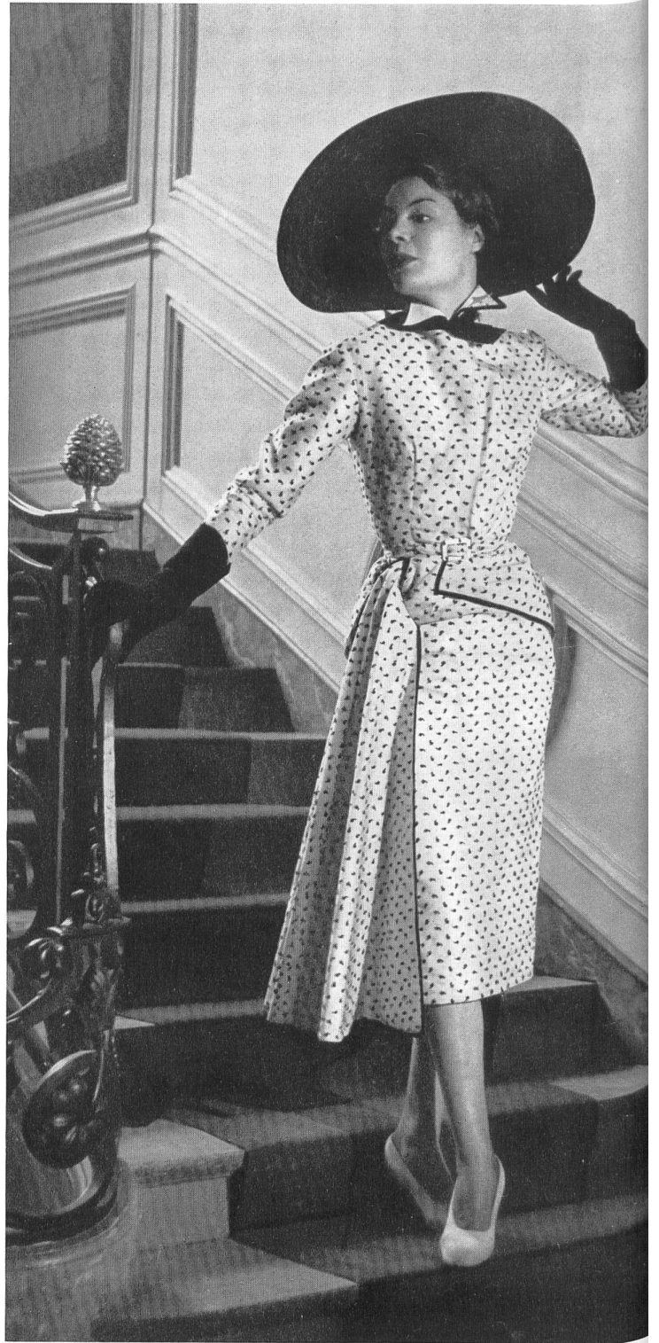
JACQUES FATH L. Abraham & Cie Soeries S. A., Zurich