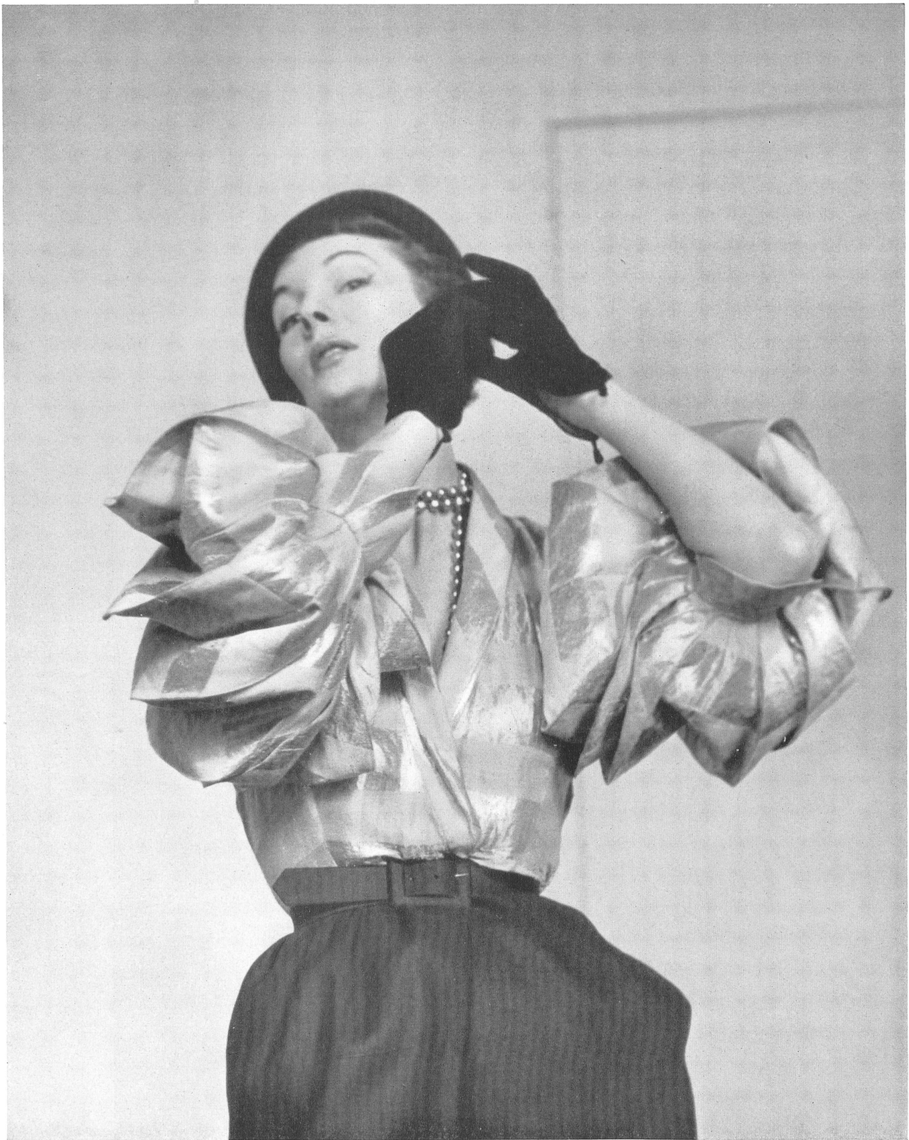
SCHIAPARELLI Heer & Co. S. A., Thalwil INAMO, ZURICH