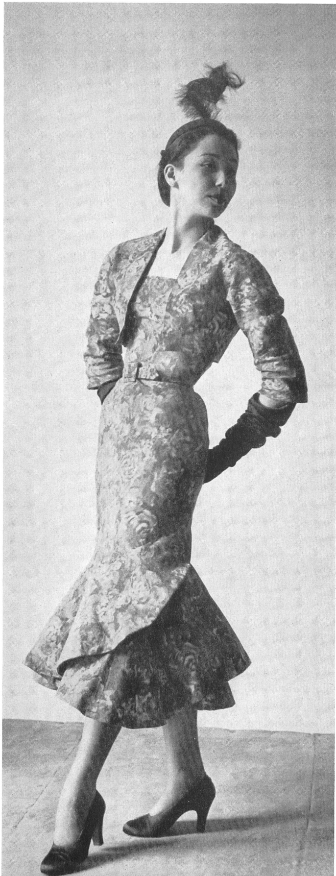
BALENCIAGA L. Abraham & Cie Soeries S. A., Zurich INAMO, ZURICH