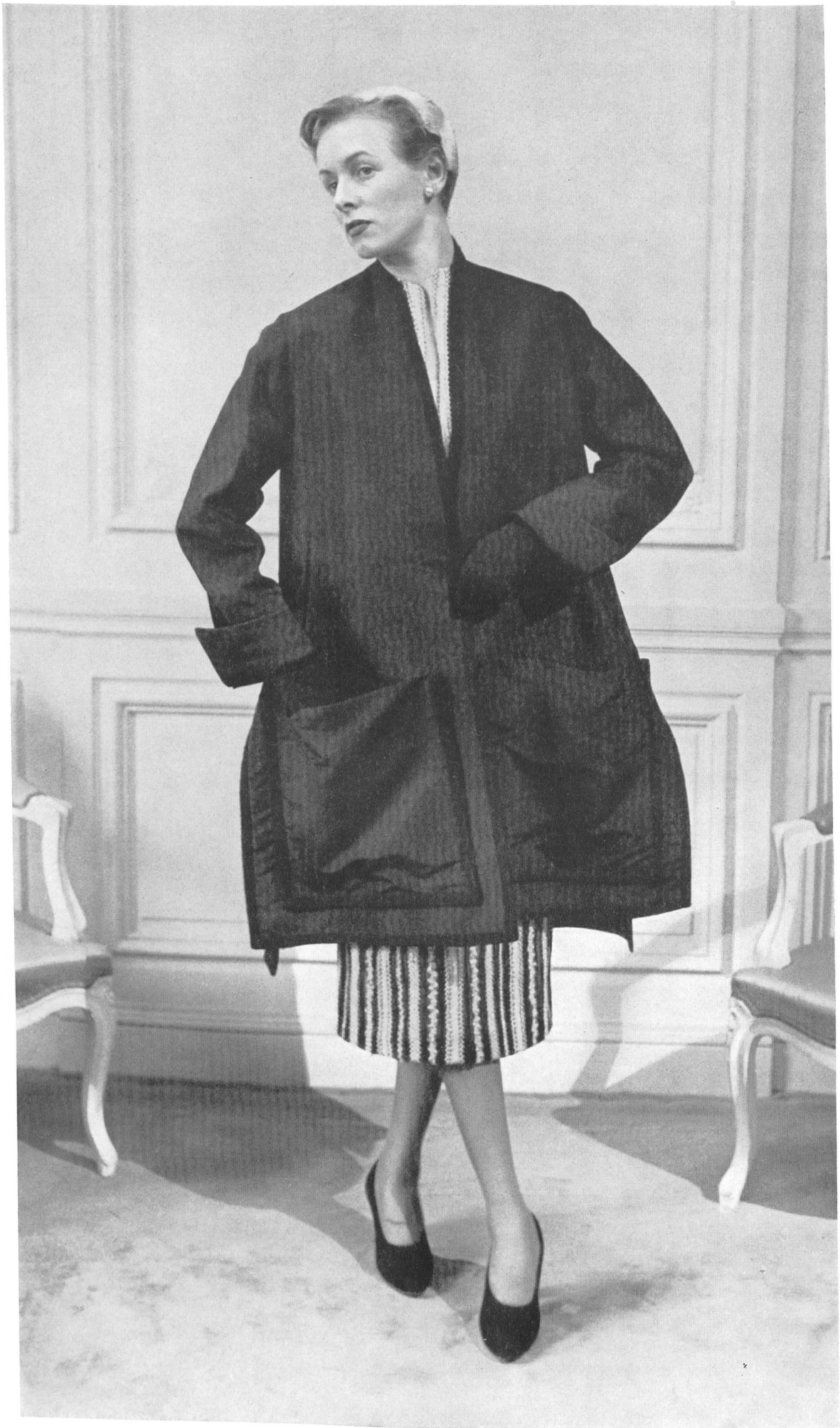
CHRISTIAN DIOR S. A. Stünzi Fils, Horgen