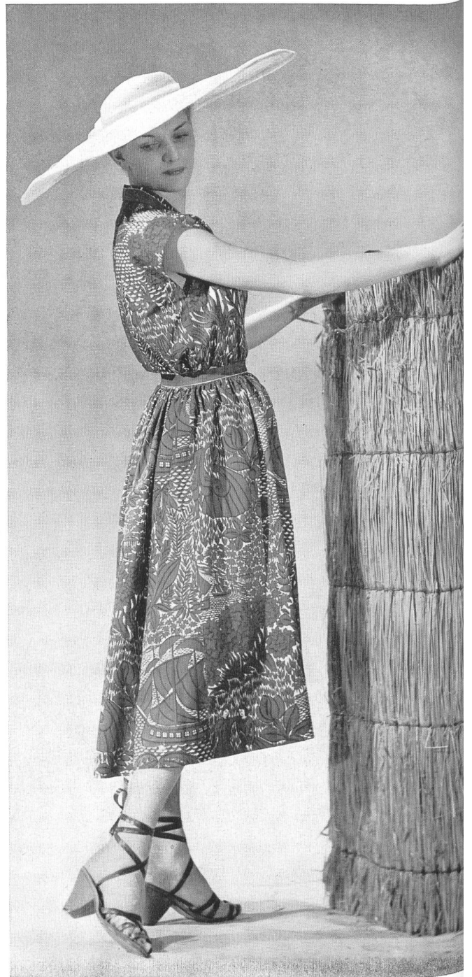
MOLYNEUX Rudolf Brauchbar & Cie, Zurich