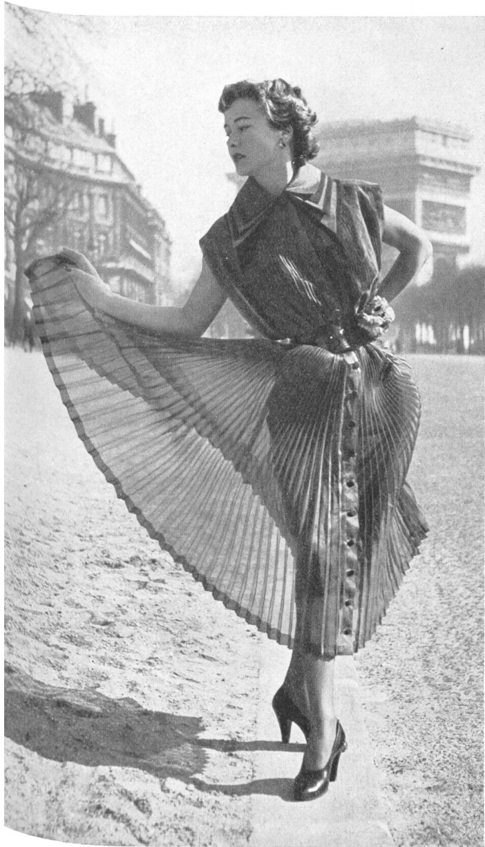
ALWYNN L. Abraham & Cie, Soieries S. A., Zurich