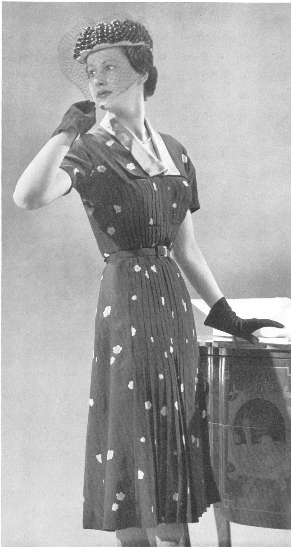
BRUYÈRE Rudolf Brauchbar & Cie, Zurich