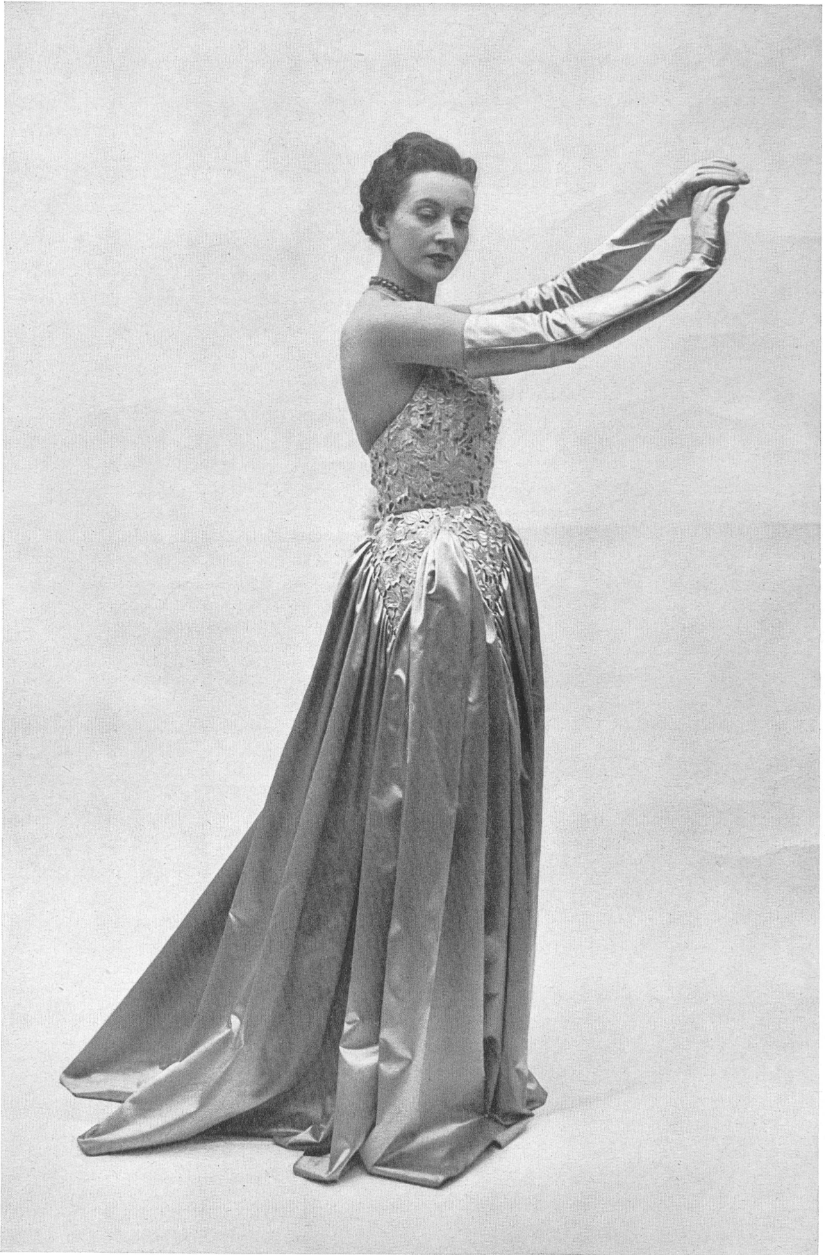
MOLYNEUX A. Naef & Cie, Flawil INAMO, ZURICH