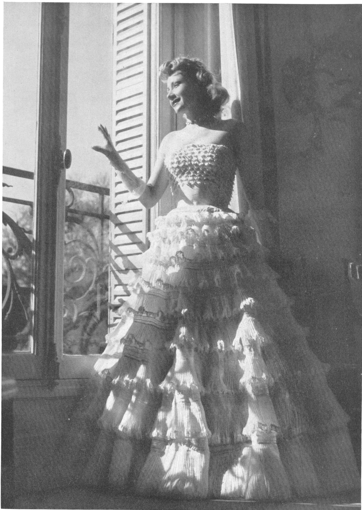
CARVEN Union S. A., St-Gall PIERRE BRIVET FILS, PARIS