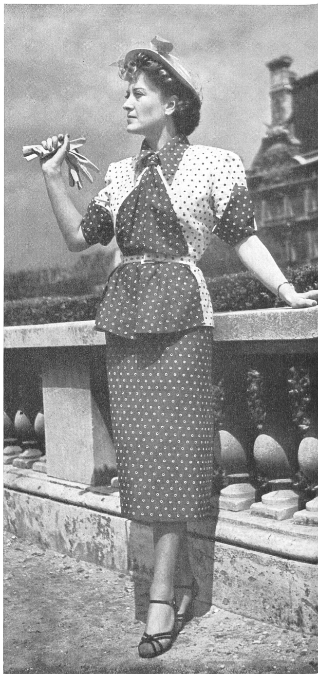
MARTIAL ET ARMAND Reichenbach & Co., St-Gall THIÉBAUT-ADAM, PARIS