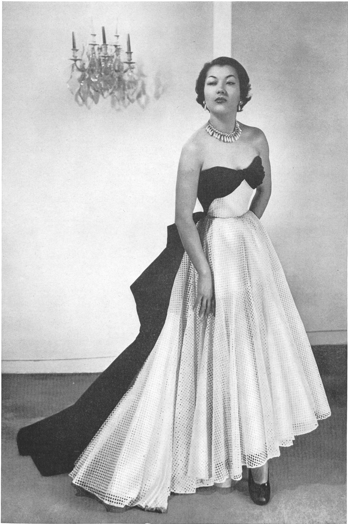
NINA RICCI J. G. Nef & Cie, Hérissau M. GUITRY, PARIS