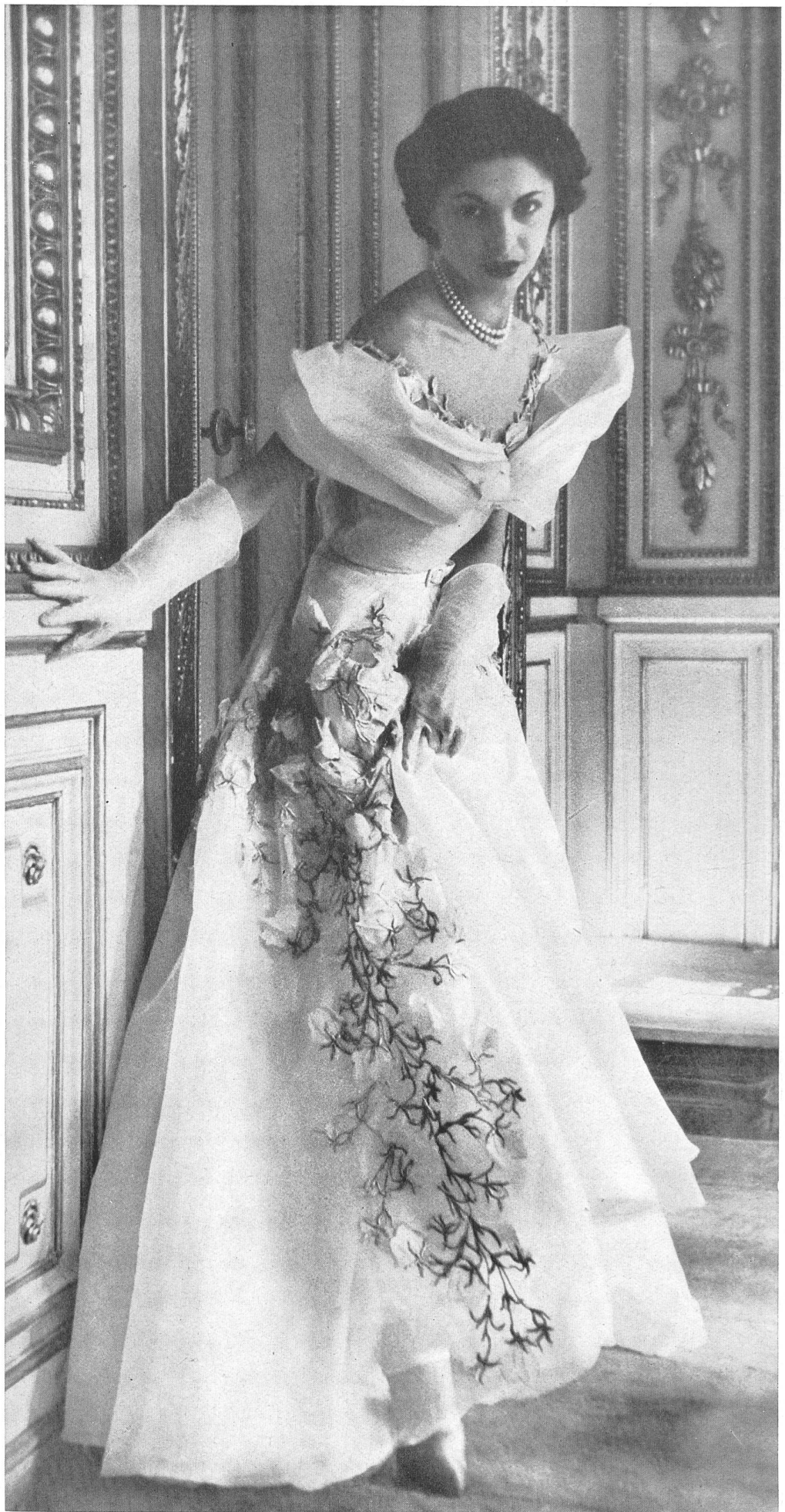
JEAN DESSÈS Forster Willi & Cie, St-Gall INAMO, ZURICH