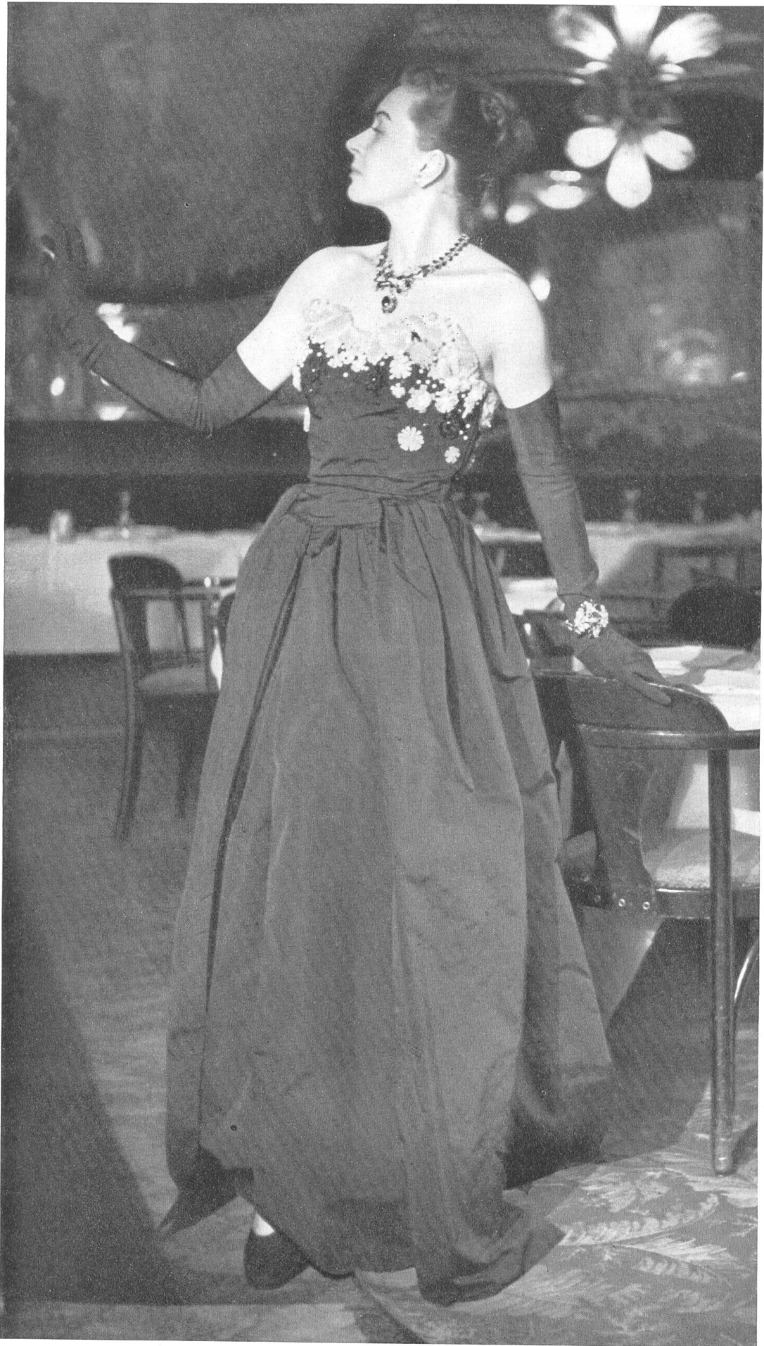
MOLYNEUX L. Abraham & Cie, Soieries S. A., Zurich