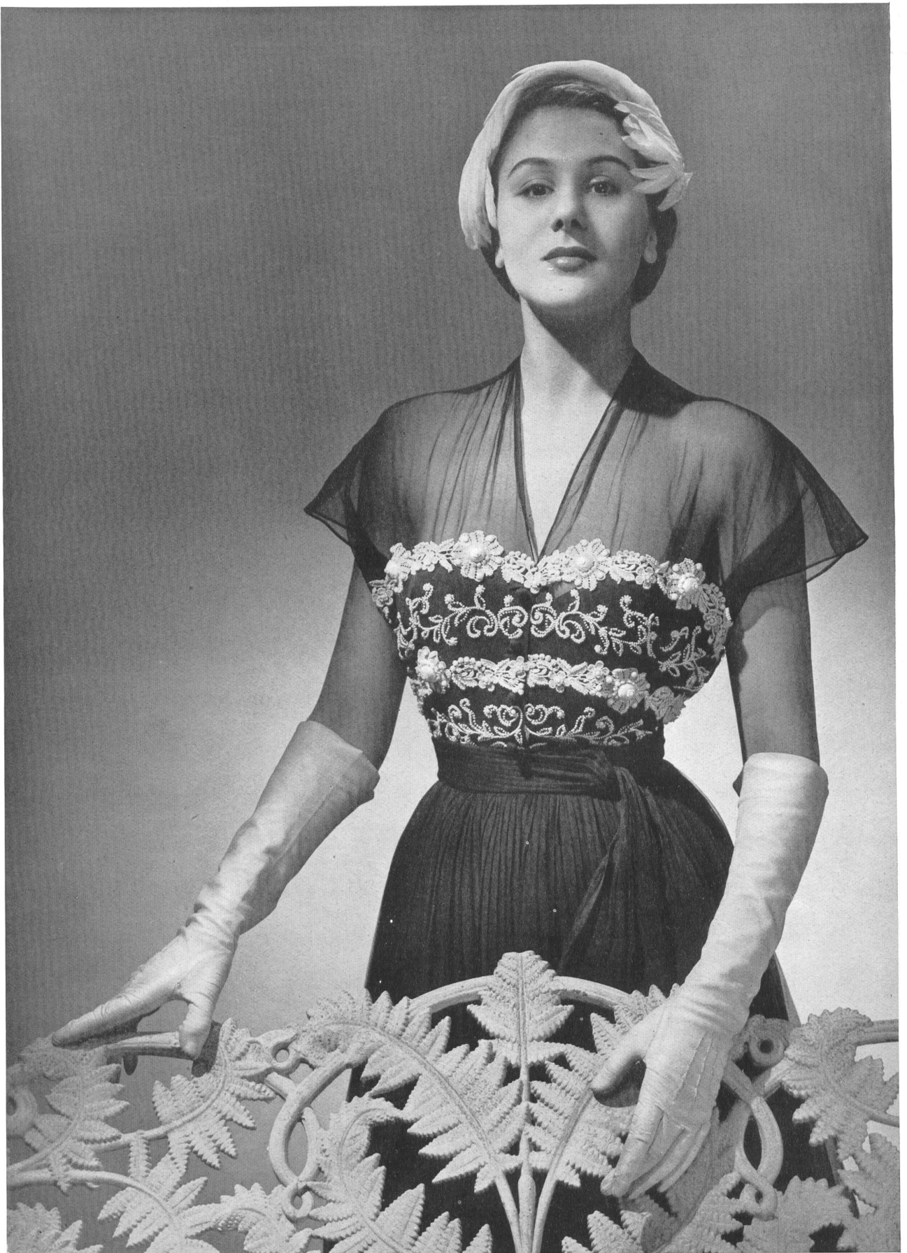
MARCEL ROCHAS Union S.A., St-Gall THIÉBAUT-ADAM, PARIS