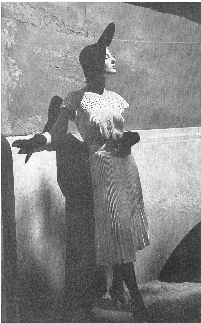
TRISTAN MAURICE Walter Schrank & Cie, St-Gall THIÉBAUT-ADAM, PARIS