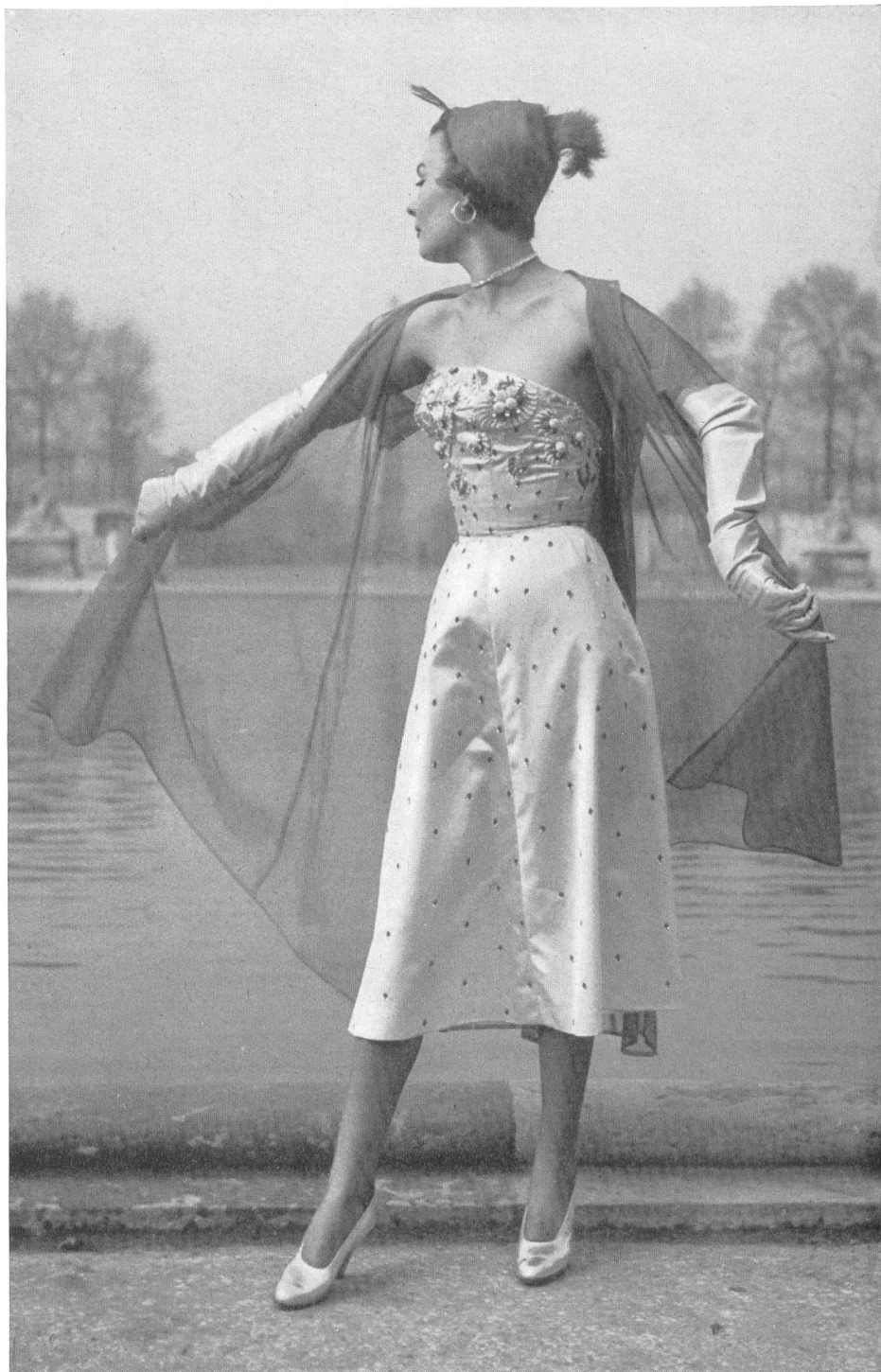
JACQUES FATH Union S.A., St-Gall PIERRE BRIVET FILS, PARIS