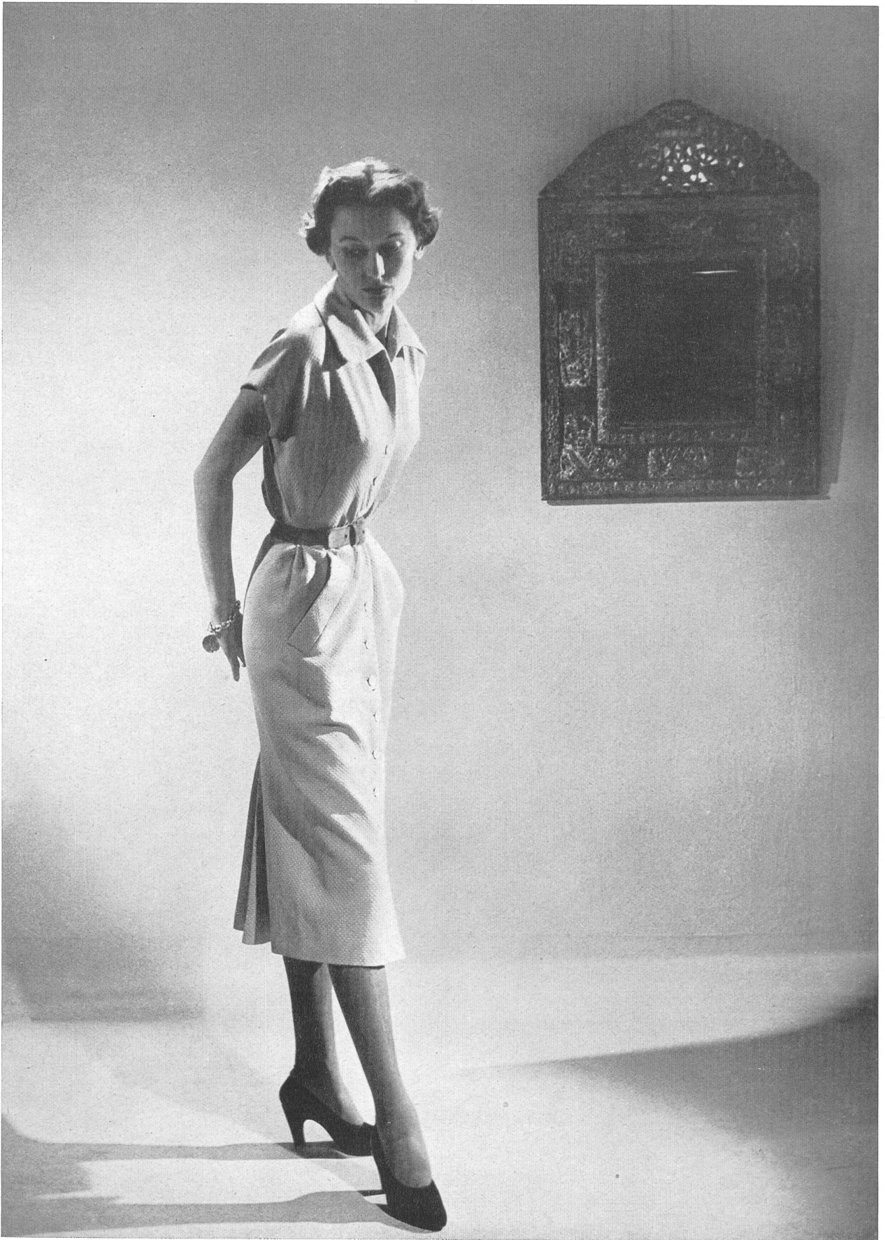
CHRISTIAN DIOR Stoffel & Cie, St-Gall INAMO, ZURICH