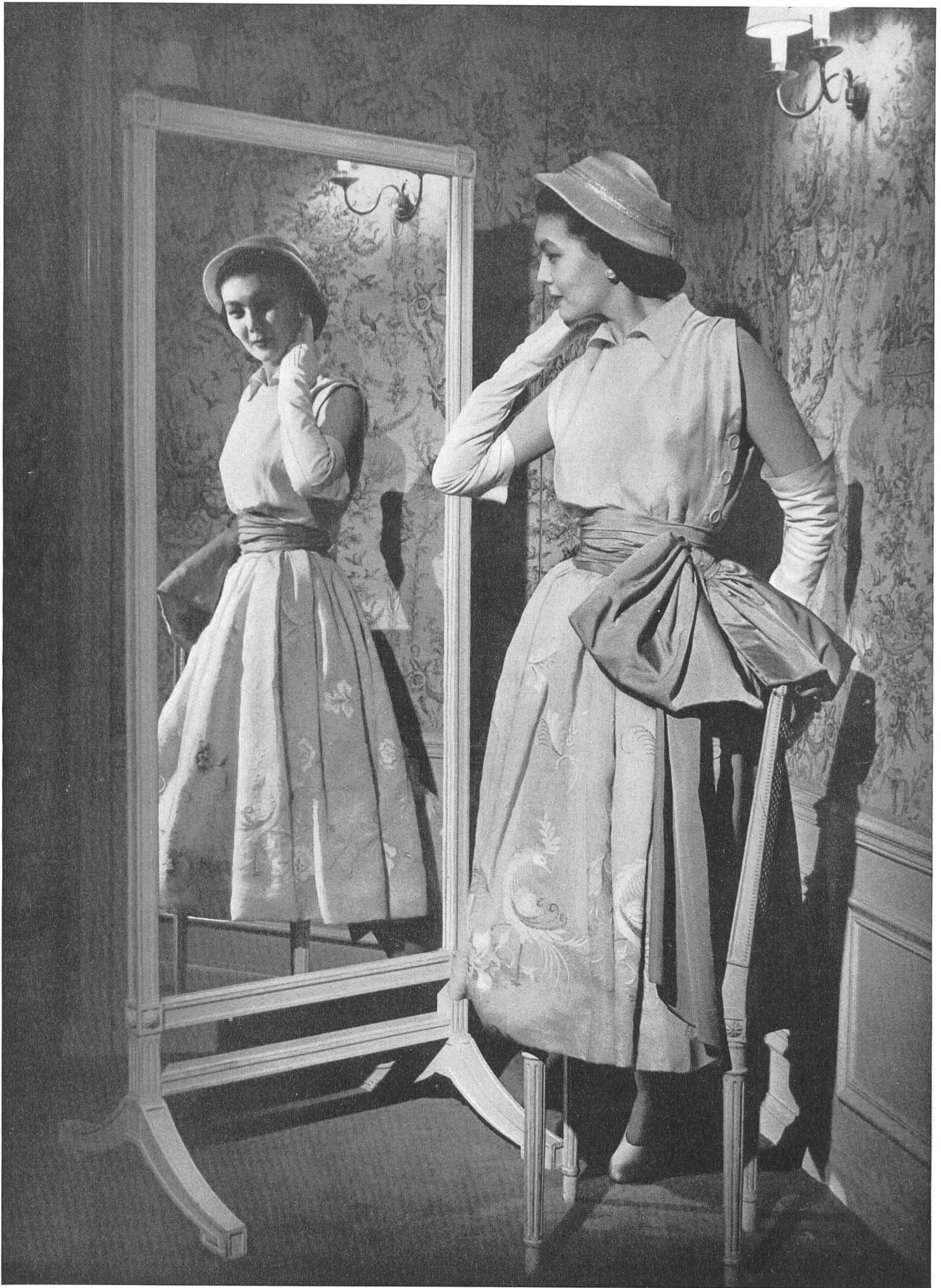
CHRISTIAN DIOR Forster Willi & Cie, St-Gall INAMO, ZURICH