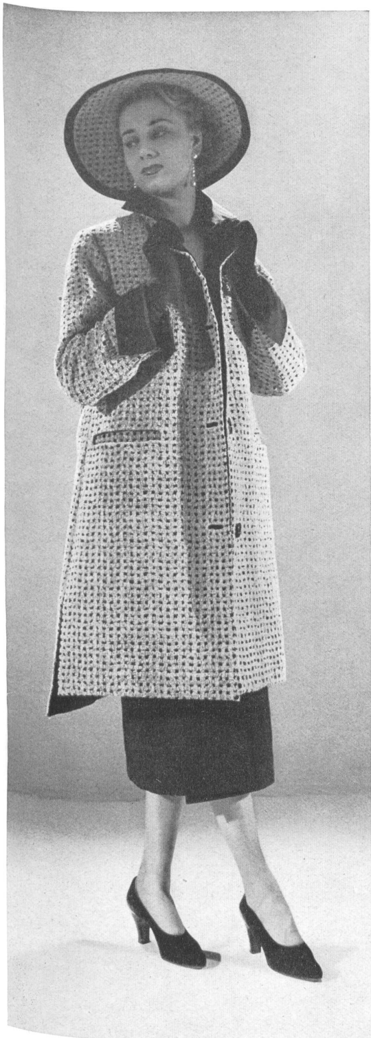
CHRISTIAN DIOR A. Naef & Cie, Flawil INAMO, ZURICH