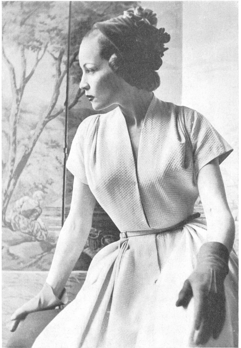
MANGUIN Stoffel & Cie, St-Gall INAMO, ZURICH