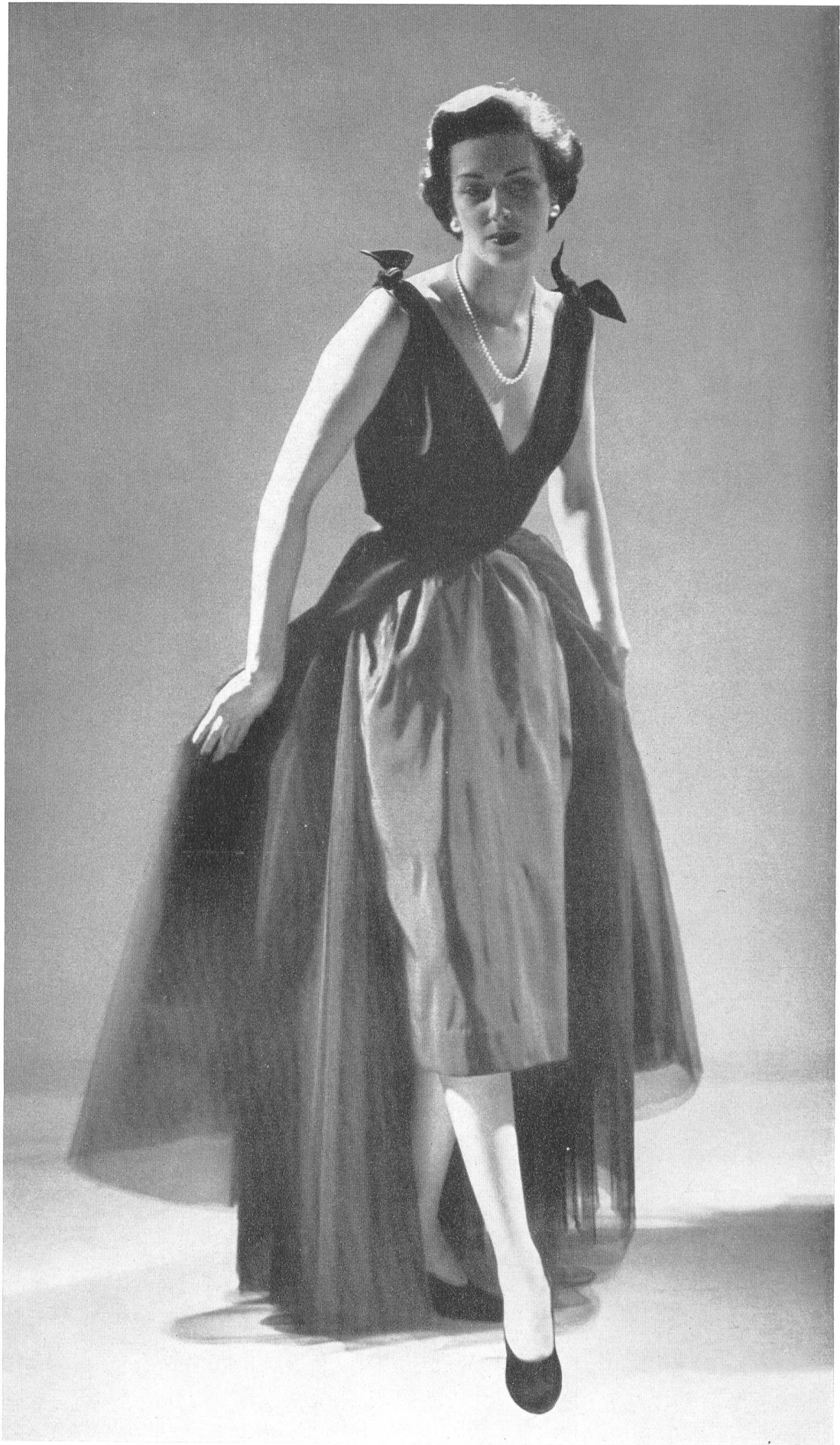
CHRISTIAN DIOR S. A. Stunzi Fils, Horgen