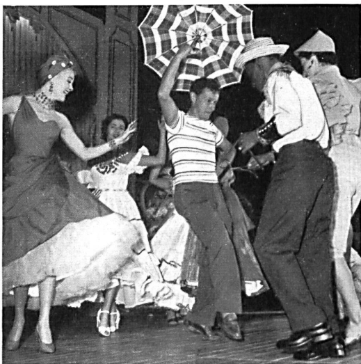
Jean-Louis Barrault présente une danse brésilienne, le « curucu ».

Furthering a tradition established already many years ago by the big couturiers, Jacques Fath organizes receptions as amusing as they are bright, to which his castle of Corbeville, at some 30 miles from Paris, offers an ideal setting. At the beginning of August, this residence saw some eighteen hundred people who came at the invitation of Mr. and Mrs. Jacques Fath to celebrate a « Carnival at Rio » that was rendered more genuine through the presence of a great number of Brazilians, in the first row of whom, we must name Senhora Vargas, wife of the President of Brazil, who came purposely from Rio for the occasion. Mr. Assis de Chateaubriant, a big Brazilian newspaper editor, was also present. In this exotic atmosphere, the cabaret, stage and screen, Paris, Hollywood and the Orient, diplomacy, finance and titled people, Arts, couture, press, brushed shoulders and danced until morning to the tune of an orchestra specially brought by air from Rio. Variety entertainments — among them those of the master of the house himself were much admired — enlivened an atmosphere already very gay. We cannot for lack of space, give a fuller account of this very successful party, which was the most outstanding event of the summer season, besides, all the newspapers have spoken of it, therefore we only content ourselves in reproducing here a few snapshots.