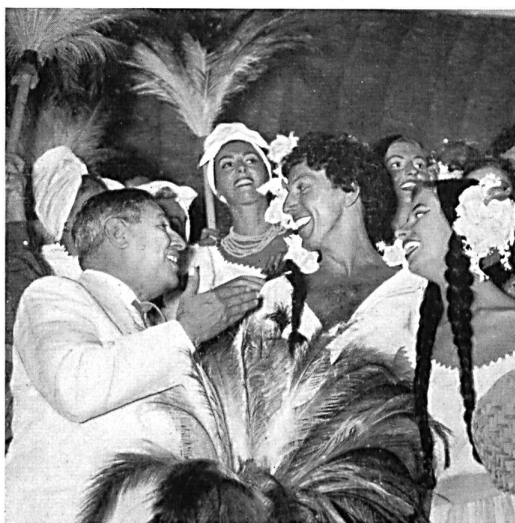
Jacques Fath, en conversation avec M. Assis de Chateaubriant, le grand éditeur de journaux brésilien.