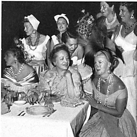
Madame Vargas, femme du président des Etats-Unis du Brésil (au centre) s'entretient avec la vedette Ginger Rogers.

Furthering a tradition established already many years ago by the big couturiers, Jacques Fath organizes receptions as amusing as they are bright, to which his castle of Corbeville, at some 30 miles from Paris, offers an ideal setting. At the beginning of August, this residence saw some eighteen hundred people who came at the invitation of Mr. and Mrs. Jacques Fath to celebrate a « Carnival at Rio » that was rendered more genuine through the presence of a great number of Brazilians, in the first row of whom, we must name Senhora Vargas, wife of the President of Brazil, who came purposely from Rio for the occasion. Mr. Assis de Chateaubriant, a big Brazilian newspaper editor, was also present. In this exotic atmosphere, the cabaret, stage and screen, Paris, Hollywood and the Orient, diplomacy, finance and titled people, Arts, couture, press, brushed shoulders and danced until morning to the tune of an orchestra specially brought by air from Rio. Variety entertainments — among them those of the master of the house himself were much admired — enlivened an atmosphere already very gay. We cannot for lack of space, give a fuller account of this very successful party, which was the most outstanding event of the summer season, besides, all the newspapers have spoken of it, therefore we only content ourselves in reproducing here a few snapshots.