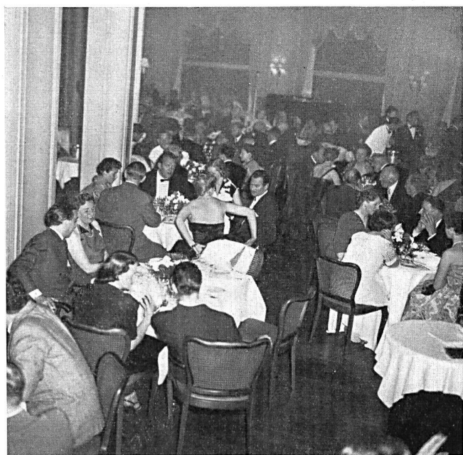
Au dîner de gala de la 20 e Semaine d'Exportation. At the gala dinner of the 20th Export Week.

Nous avons déjà, à plus d'une reprise, parlé ici des « Semaines d'exportation » de l'industrie suisse de la confection. C'est à 1938 que remonte la tradition de ces manifestations, qui furent suspendues pendant la guerre. En 1942, les industriels exportateurs de la confection fondèrent à Zurich le Syndicat d'exportation des industries suisses de l'habillement qui reprit la tradition interrompue.