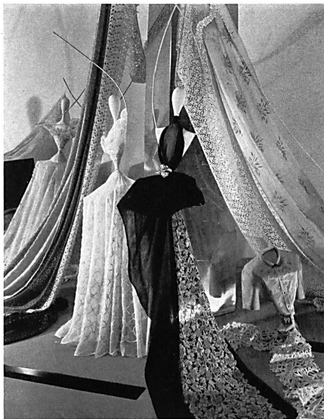
Coup d'œil sur la présentation des broderies et tissus fins de Saint-Gall. A glimpse of the presentation of embroideries and fine fabrics from St. Gall.