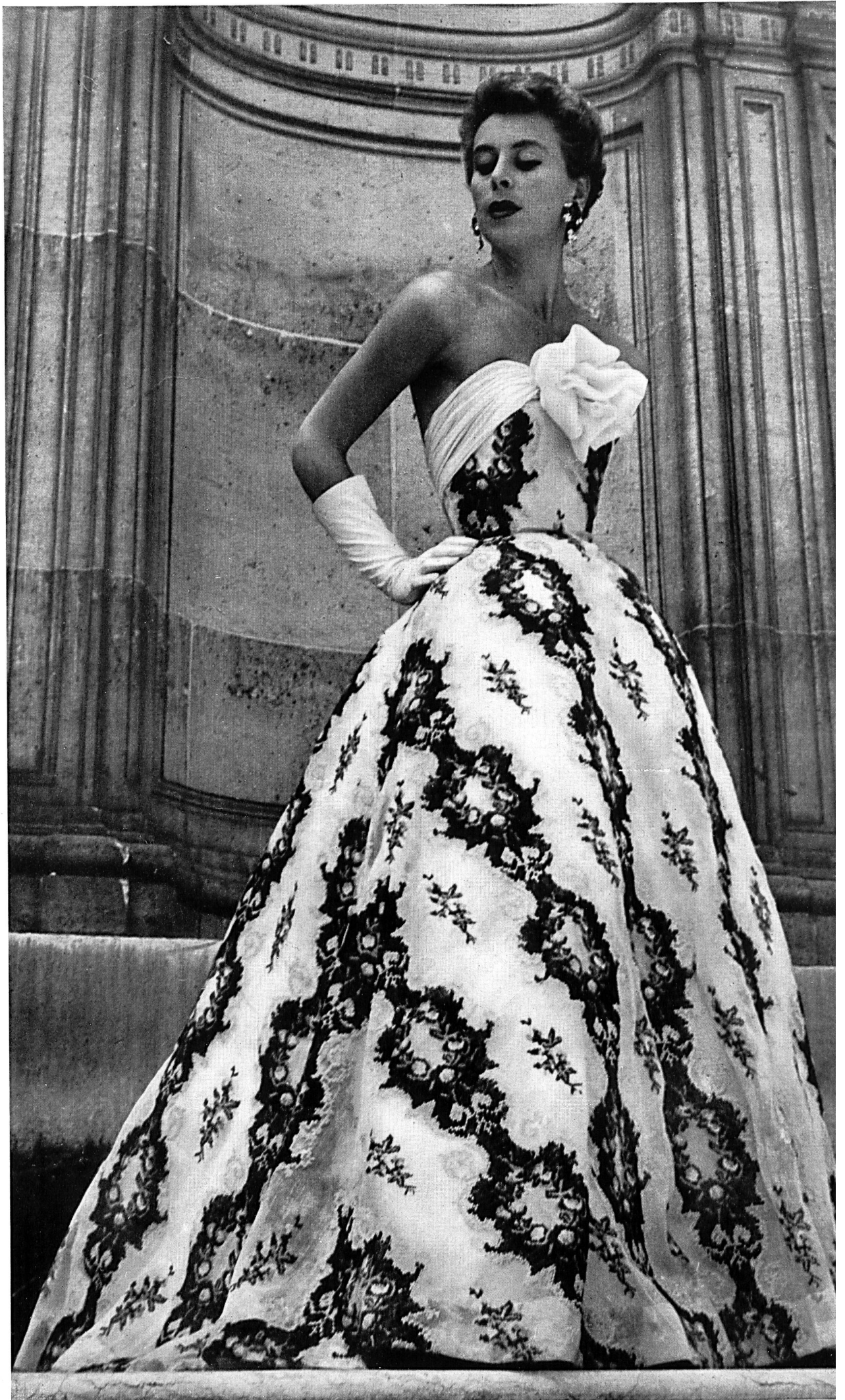
HUBERT DE GIVENCHY Broderie, imitation « tapisserie petit point », sur organdi, de Forster Willi & Co., St-Gall ; placée par Inamo, Zurich.