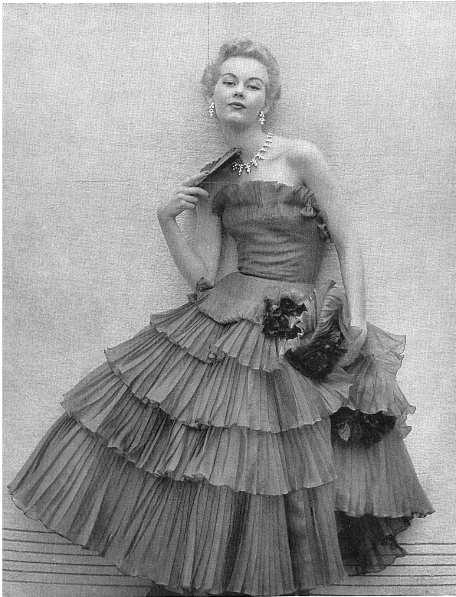
JEAN DESSÈS Basra soie de L. Abraham & Cie, Soieries S. A., Zurich.