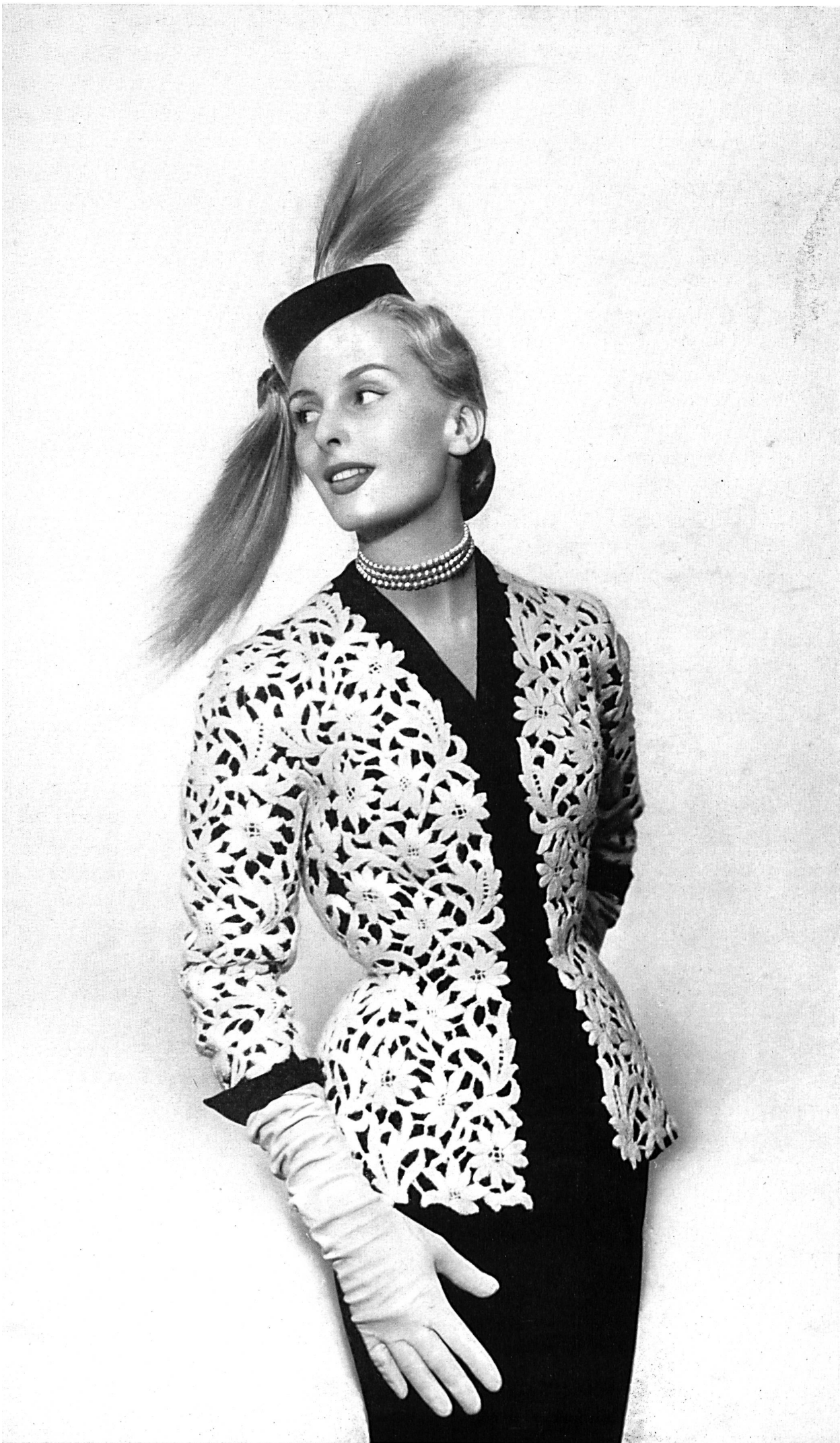
PIERRE BALMAIN Dentelle en guipure mohair de Forster Willi & Co., St-Gall; grossiste à Paris: Châtillon, Mouly, Roussel S. A.