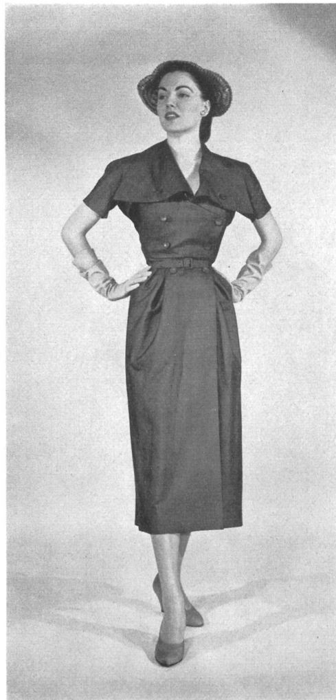
CHRISTIAN DIOR, NEW YORK Plain Amadis.