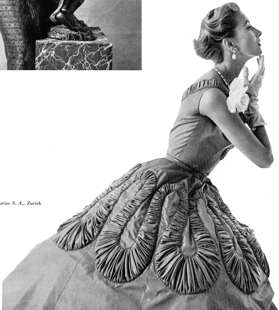
PIERRE BALMAIN Basma soie de L. Abraham & Cie, Soieries S. A., Zurich