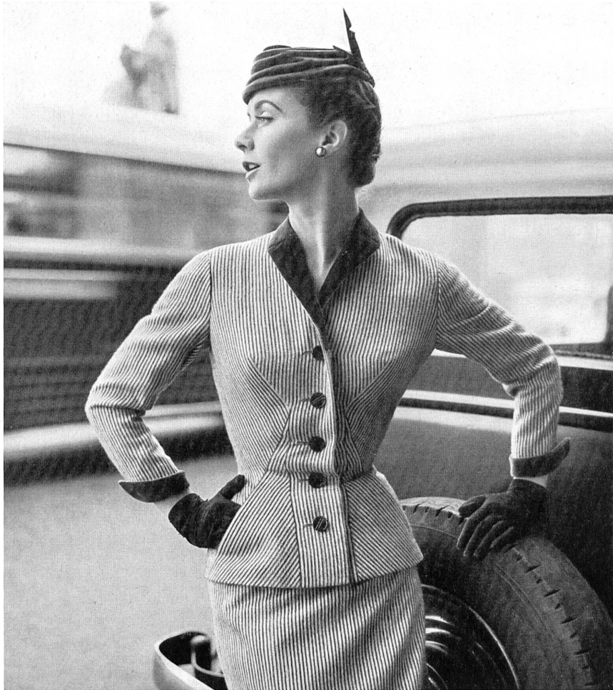
JEAN DESSES Casheen de L. Abraham & Cie, Soieries S. A., Zurich