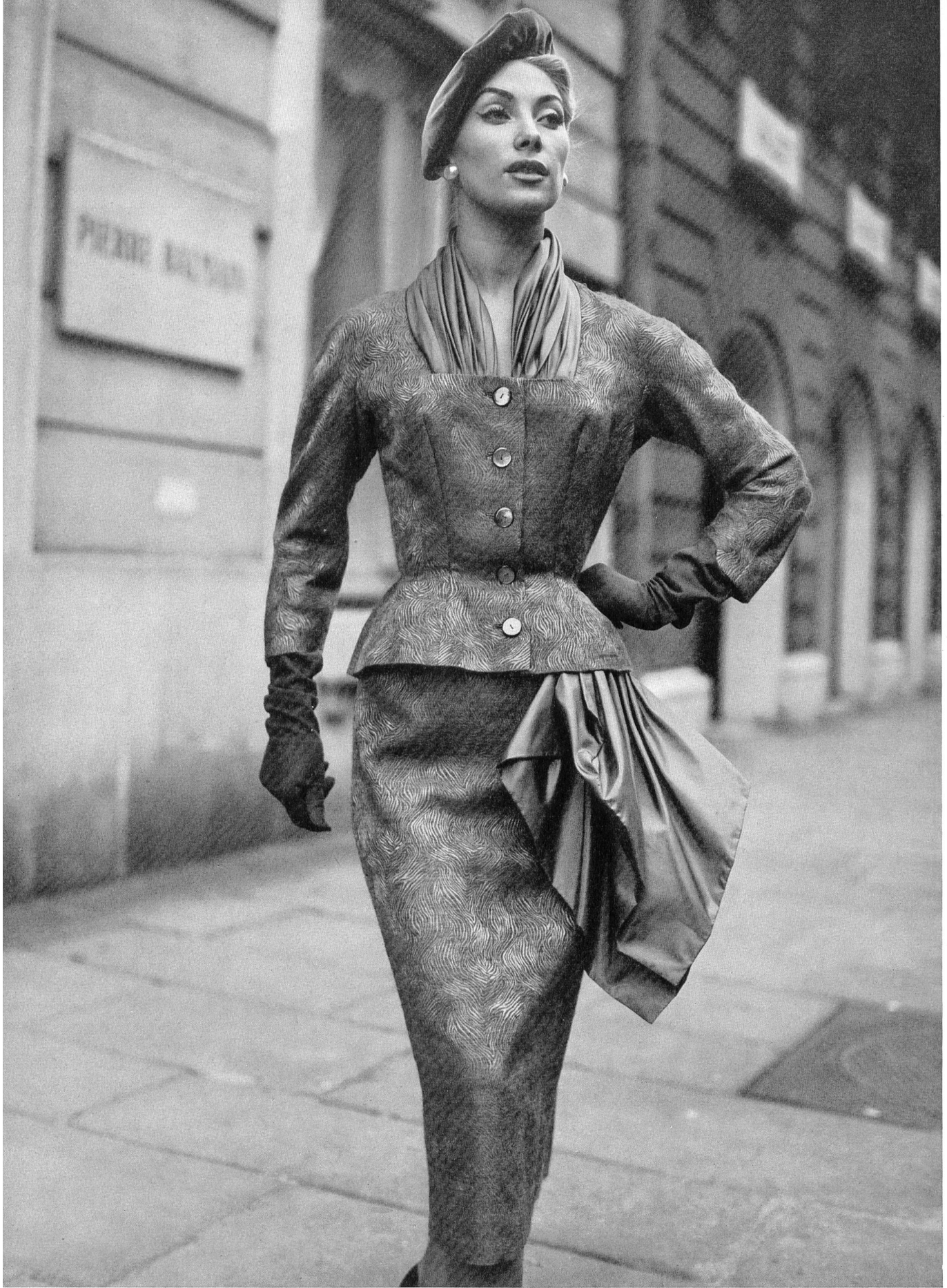
PIERRE BALMAIN Mohair façonné viscose/laine de Rudolf Brauchbar & Cie, Zurich