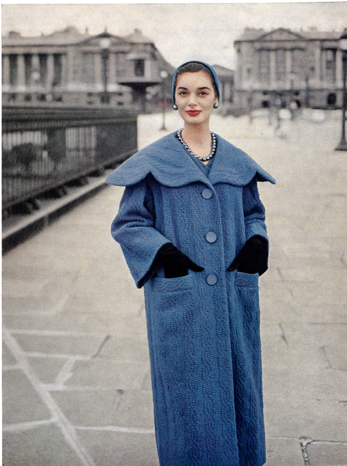
HUBERT DE GIVENCHY Broderie laine bleue de Forster Willi & Co., Saint-Gall; placé par Inamo, Zurich