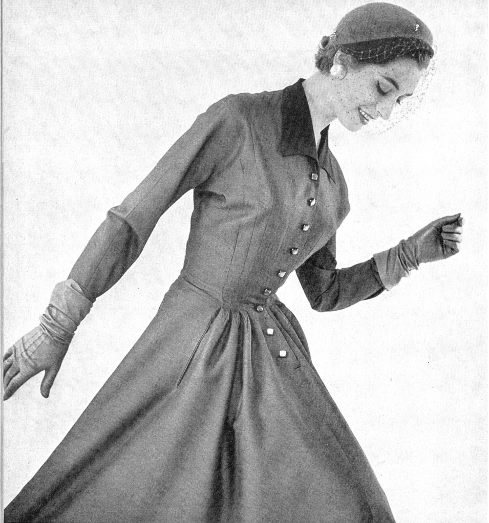
MANGUIN Taraban de L. Abraham & Cie, Soieries S. A., Zurich