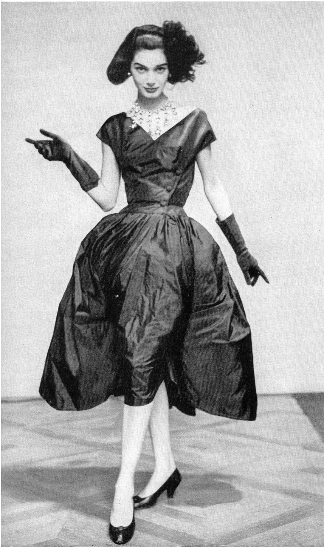
HUBERT DE GIVENCHY Taffetas noir soie naturelle de la Société Anonyme Stünzi fils, Horgen