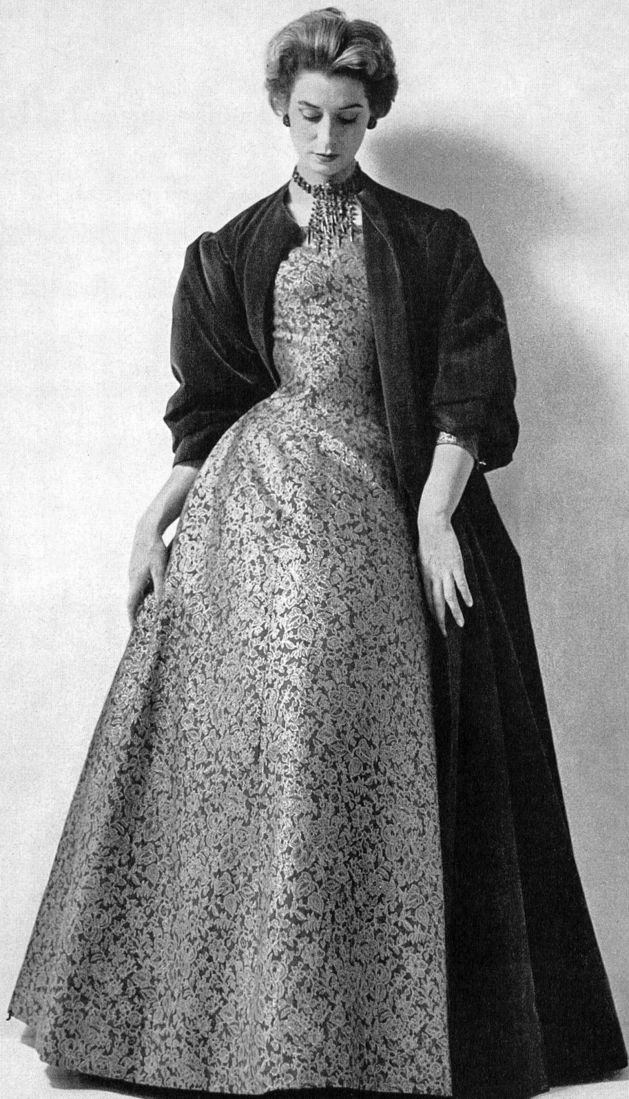
CHRISTIAN DIOR Tapira or de L. Abraham & Cie, Soieries S. A., Zurich