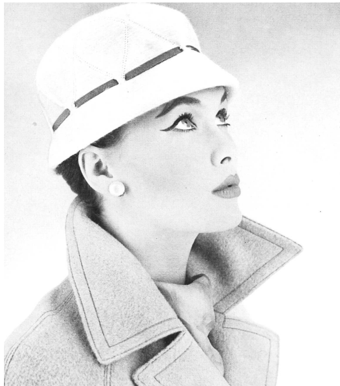
Cloche de mélusine avec ruban gros-grain et piqûres. Modèle suisse. Melusine cloche with grosgrain ribbon and stitching. Swiss model. Sombrero « cloche », de melusina con cinta de grosgrén y puntadas. Modelo suizo. Kleine Melusine-Cloche mit Grosgrainband und Steppgarnitur. Schweizer Hutmodell.

Le chapeau de feutre règne sur la mode d'hiver. Feutre souple et doux au toucher, ou terne dans le genre chiné avec un léger duvet de poils courts, mélusines brillantes comme de la soie. Toques drapées, casques arrondis couvrant les tempes ou volumineux et étirés en largeur. Vogue de ce qu'on appelle les « fausses nuances » en noir et en blanc : noir avec des reflets verdâtres ou bleuâtres, gris vert, blanc argenté, ou vert jaunâtre. Autres couleurs à la mode : bronze et vert chasseur, violet et prune, beige sable et brun, rouge vif et jaune très vif. Matières, formes et couleurs qui donnent aux chapeaux une allure très vivante.