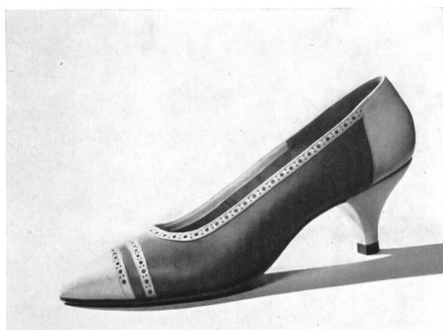
Modèles Bally déposés

Le chaussant et les mouvements de la mode exercent leur influence sur la chaussure masculine. Au carrefour de l'Europe, la grande fabrique suisse est dans l'obligation de créer des formes différentes pour l'Angleterre, la France, l'Italie, l'Allemagne, même pour l'Amérique où ses modèles sont de plus en plus appréciés. Leur chaussant parfait, leur style international, leur souplesse remarquable et la qualité des peausseries expliquent ce succès. D'autre part, un programme classique pour hommes continue à se distinguer par sa tenue. Nombre de messieurs retrouvent, d'année en année, leur chaussure préférée.»