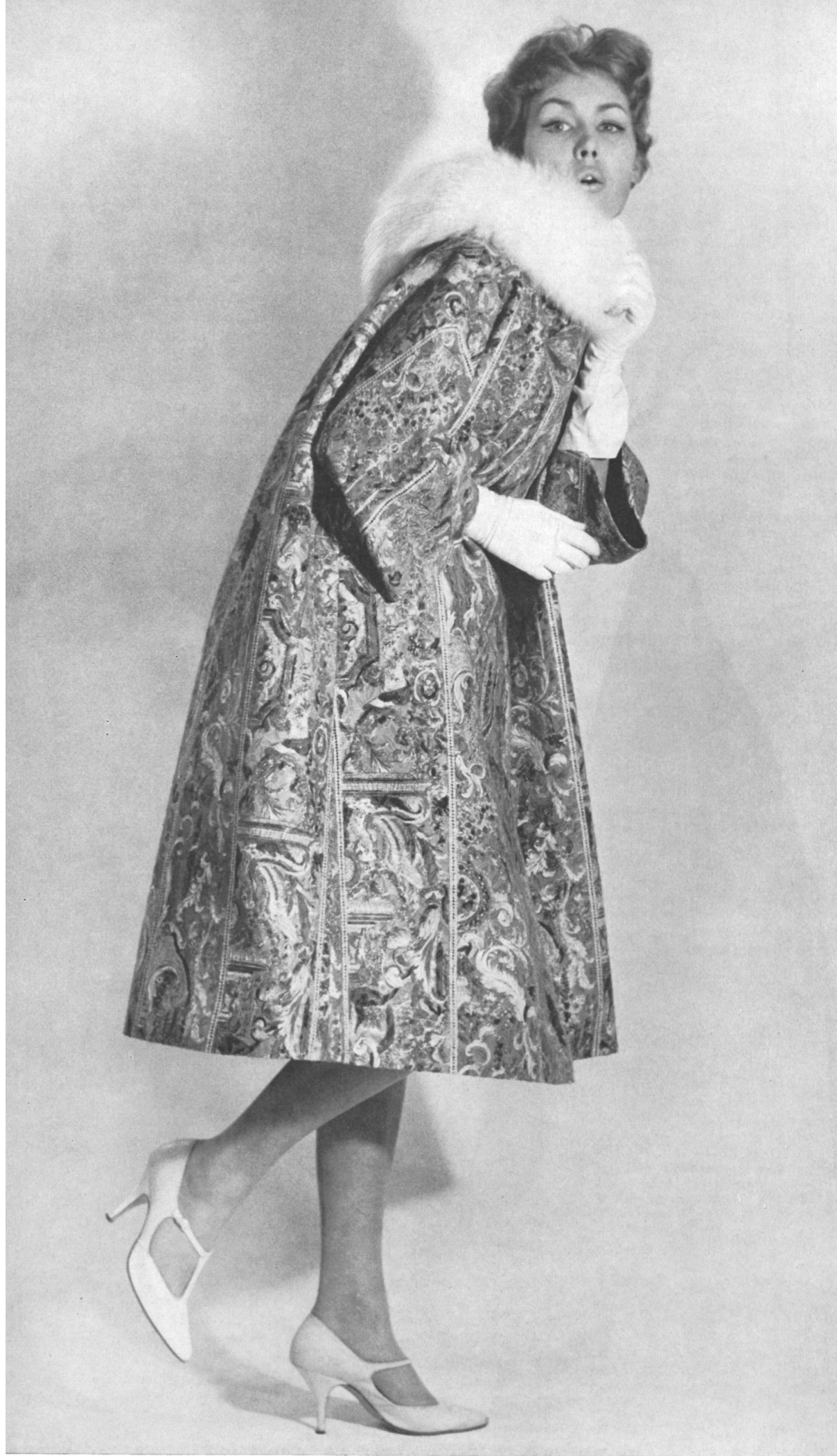
METTLER & CIE S.A., SAINT-GALL Brocart jacquard et or avec motifs Renaissance imprimés Gold-Brocade-Jacquard mit bedruckten Renaissance- Mustern Modèle : Heinz Oestergaard, Berlin