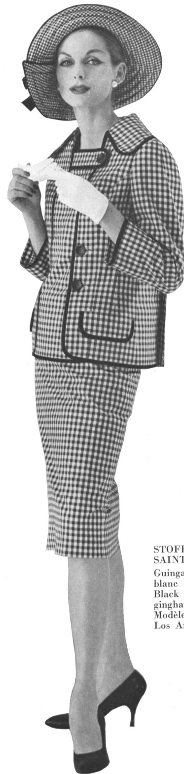
STOFFEL & CO., SAINT-GALL Guingan damier noir et blanc Black and white checked gingham Modèle : Galanos, Los Angeles