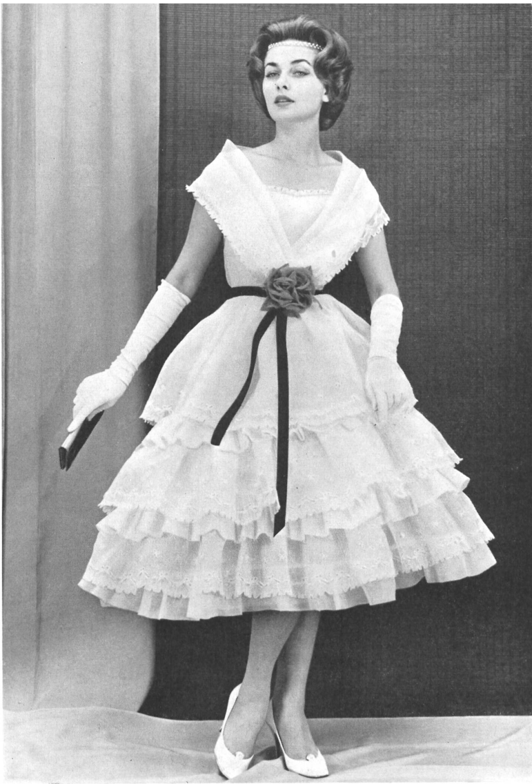
1 «RECO», REICHENBACH & CO., SAINT-GALL Organdi blanc brodé Modèle : Manuela, Nice Montex, Paris