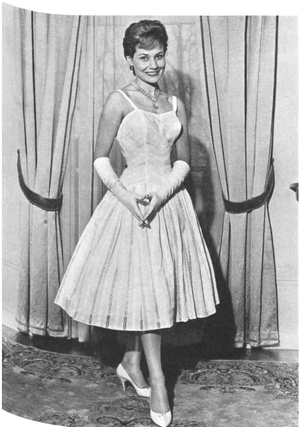
3 «RECO», REICHENBACH & CO., SAINT-GALL Tissu «Recoflora» Modèle : Delapierre, Nice Montex, Paris