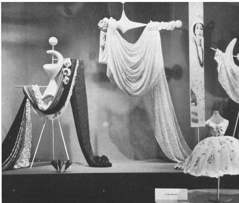
Exposition des broderies de Saint-Gall dans le Carrousel de la Mode. Arrangement : M me Tildy Grob-Wenger