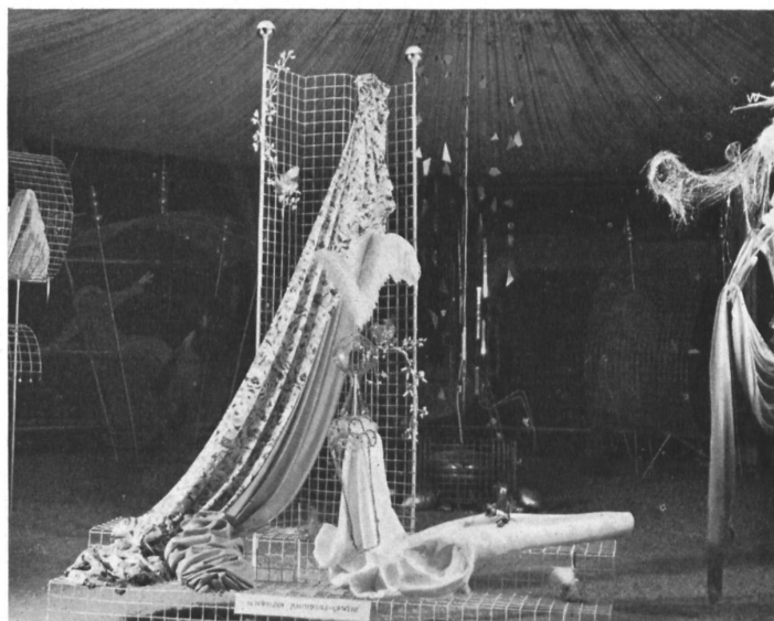
Voici, artistement offerts au public, les tissus fins de coton , spécialité de l'industrie saint-galloise.

manifestation de Zurich, des présentations des diverses branches de la production suisse en ce domaine. Nous reproduisons sur cette page quelques vues donnant un aperçu des expositions des principales branches.