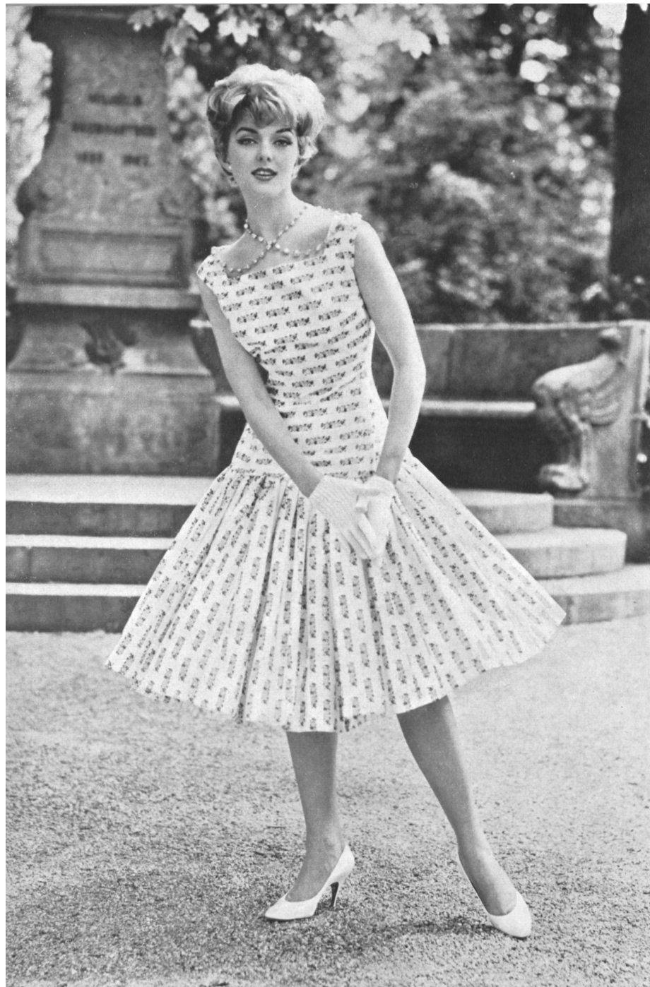
« FISBA », CHRISTIAN FISCHBACHER CO., SAINT-GALL

« Riviera Prints », coton imprimé / printed cotton fabric / tejido de algodón estampado / bedrucktes Baumwollgewebe. Modèle : Marty & Co., Zurich.