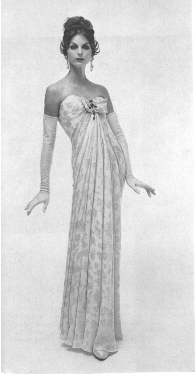
L. ABRAHAM & CO. SILKS LTD., ZURICH