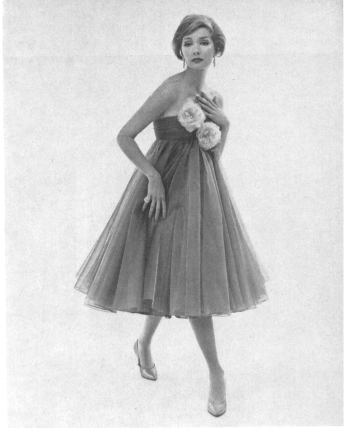
L. ABRAHAM & CO. SILKS LTD., ZURICH

Robe du soir en Basra broché. Brocaded Basra evening gown. Model by Count Sarmi for Elisabeth Arden.