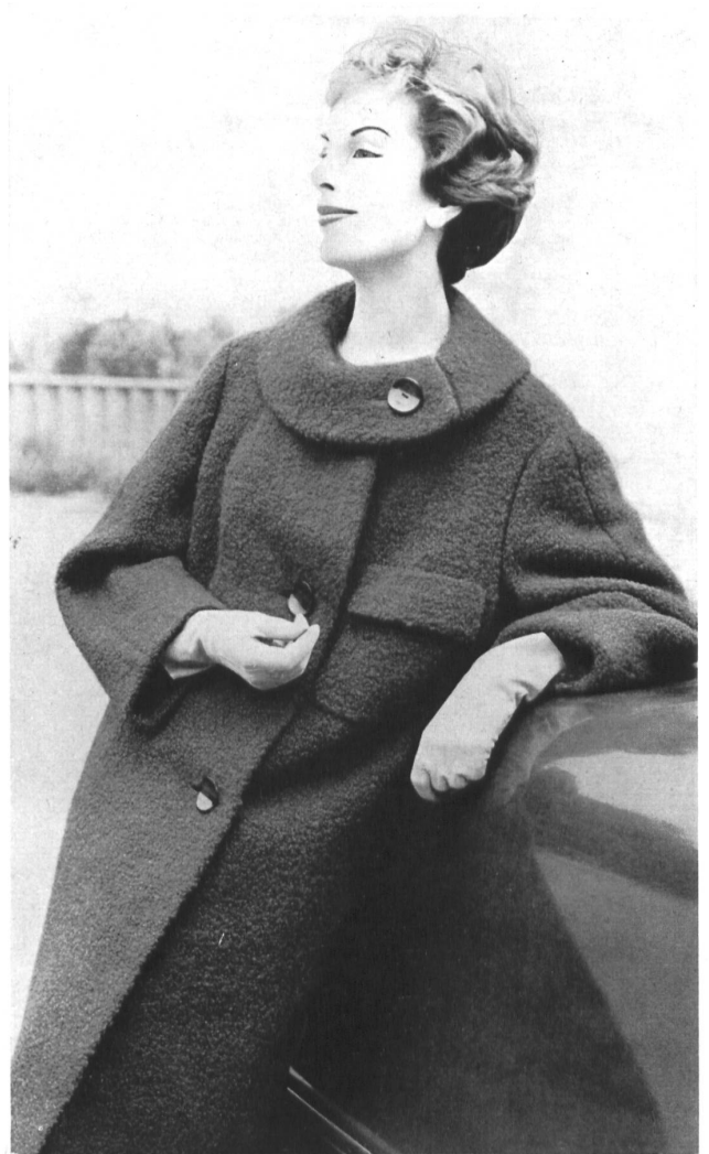
Wintermantel aus Jacquard Bouclé

STRENGELBACH Strick- und Wirkwarenfabrik Tel. (062) 8 10 53