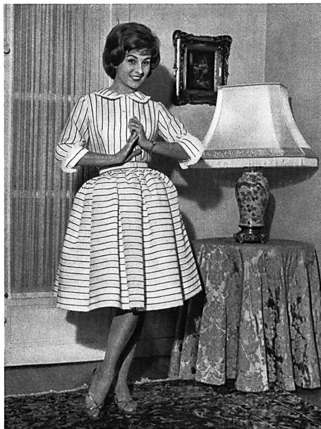
« RECO », REICHENBACH & CO., SAINT-GALL

Batiste « Minicare » brodée. Embroidered « Minicare » cambric. Modèle Jane Lend, Paris.