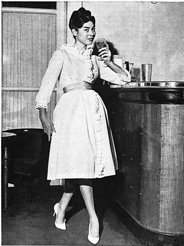
«RECO», REICHENBACH & CO., SAINT-GALL

Batiste brodée «Minicare» blanche. Embroidered white «Minicare» batiste. Modèle Bellerive, Nice.