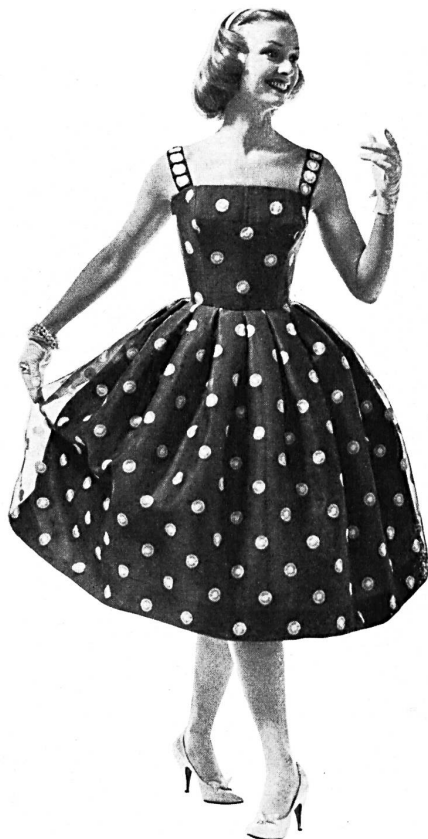
2. FORSTER WILLI & CO., SAINT-GALL

Organdi brodé blanc. White embroidered organdy.