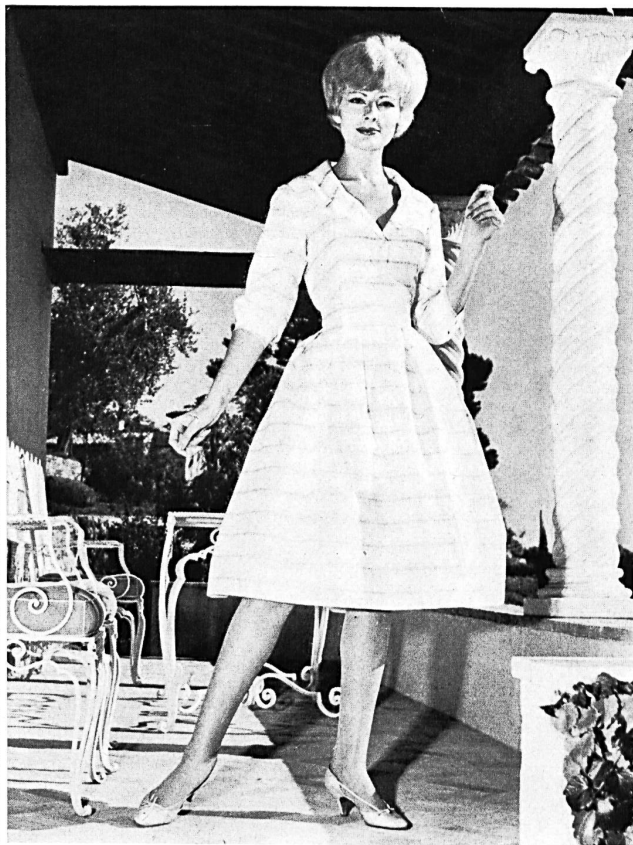
«RECO», REICHENBACH & CO., SAINT-GALL

Batiste brodée «Minicare» blanche. Embroidered white «Minicare» batiste. Modèle Bellerive, Nice.