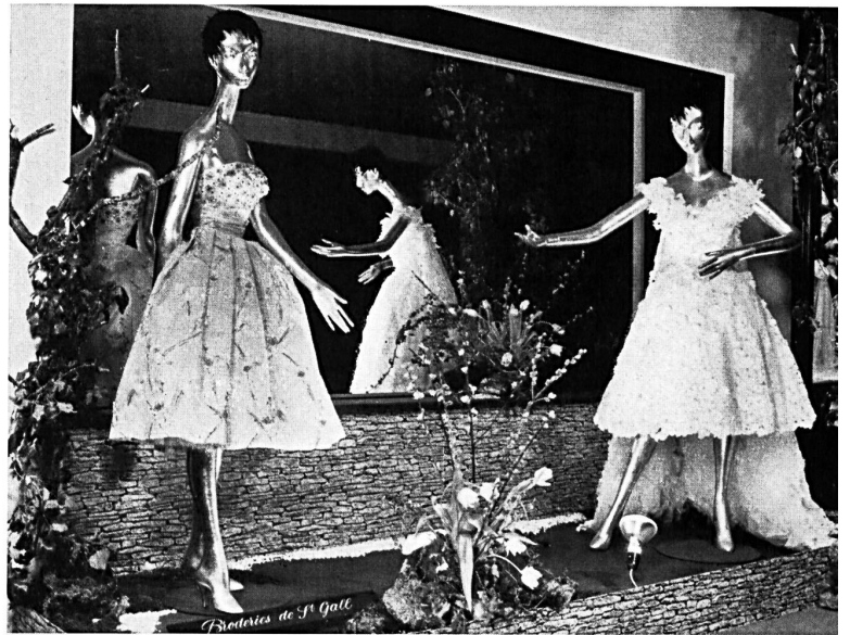
L'exposition de broderies au foyer du théâtre

Chaque printemps, le Théâtre municipal de Lausanne accueille une très abondante revue à grand spectacle, réputée pour la richesse de ses costumes. Ce spectacle attire les foules pendant plusieurs semaines puis s'en va en tournée dans plusieurs villes de Suisse et de France. Cette année, une scène de charme a été consacrée aux broderies de Saint-Gall, au cours de laquelle on peut voir dix-neuf robes présentées soit par les mannequins soit par les ballets. En même temps, le public peut voir les broderies de plus près, au foyer, où une exposition a été installée.