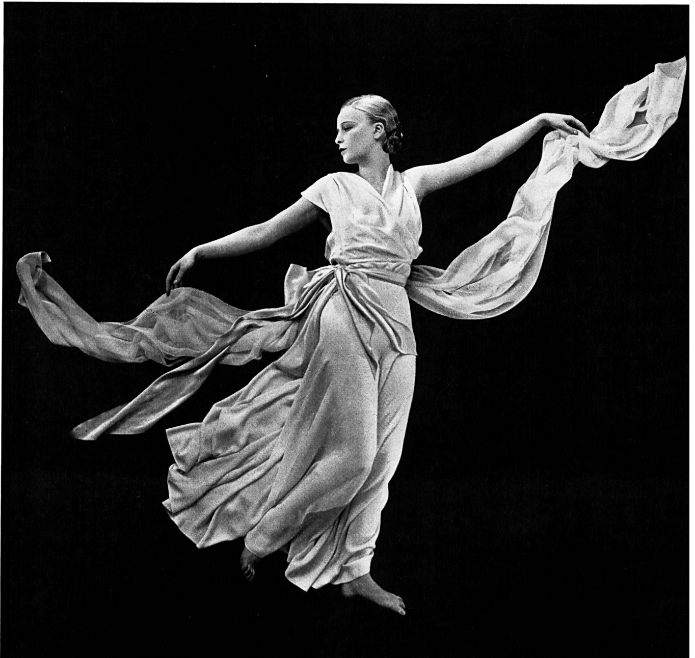
Drapage de Madeleine Vionnet Photo Hoyningen-Huene, 1931

sous le titre de « Die Mode in der menschlichen Gesellschaft » (« La Mode dans la société »). Les directeurs de la publication sont M. Peter W. Schupisser, spécialiste zuricois bien connu de la mode et de la couture et M. René König, professeur ordinaire à l'Université de Cologne. L'ouvrage, de plus de cinq cents pages du format de la présente revue, est abondamment illustré. On y trouve en particulier 22 planches en couleurs et près de 200 illustrations en héliogravure dans le texte et en pleines