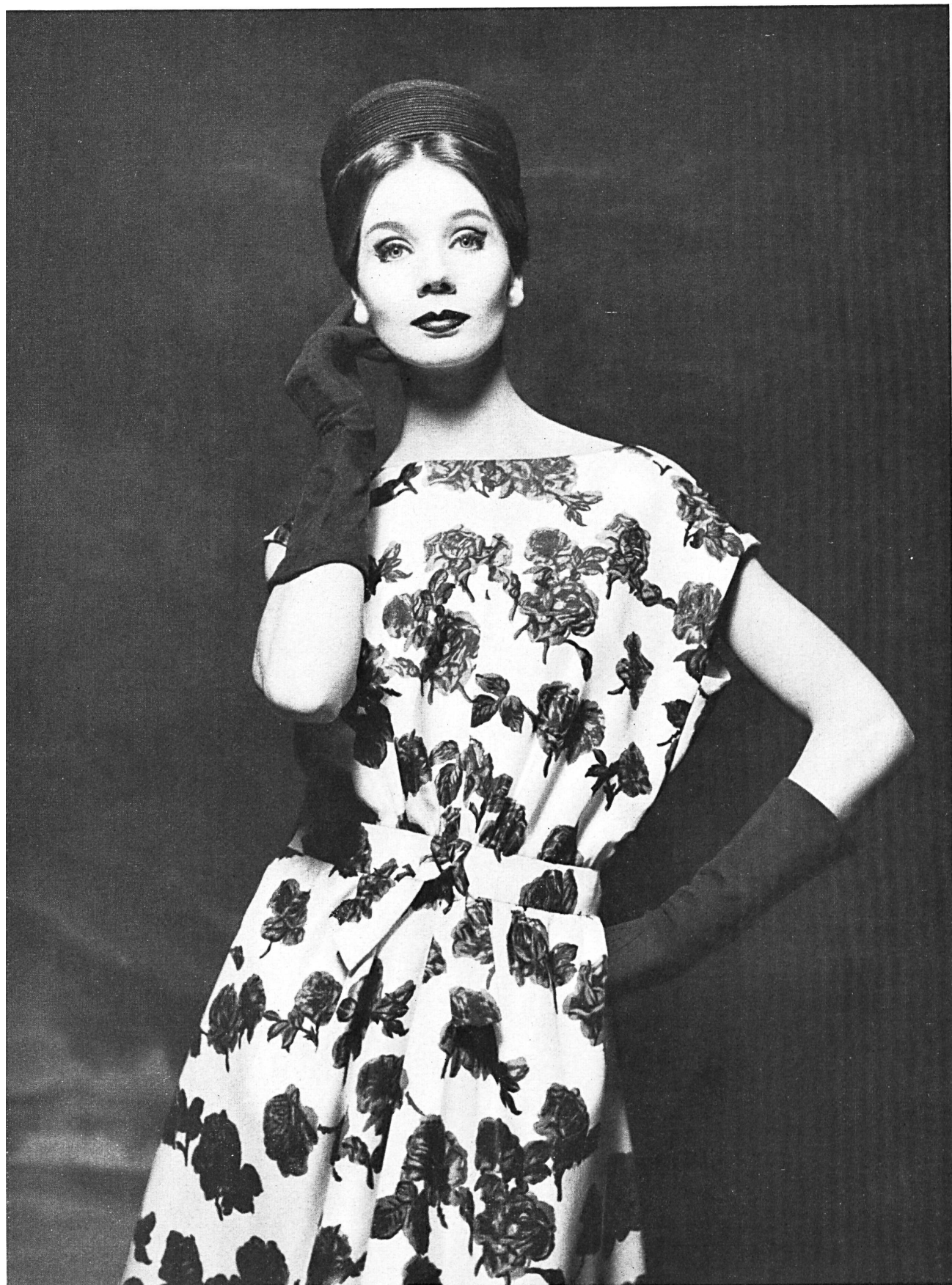
HUBERT DE GIVENCHY