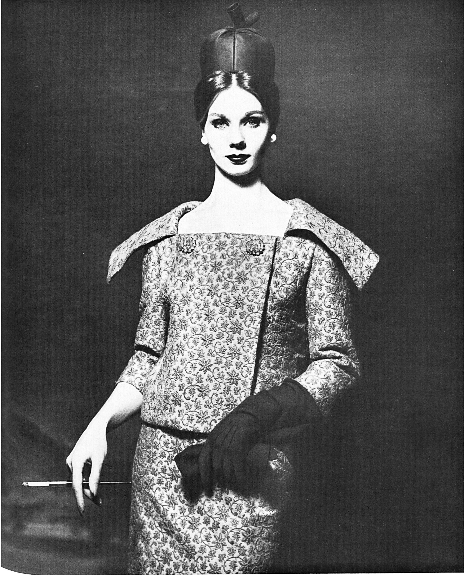
HUBERT DE GIVENCHY