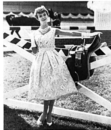
FORSTER WILLI & CO., SAINT-GALL

Organdi avec broderie chenille Modèle Gack, Zurich