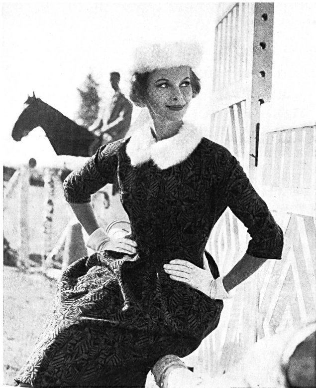
STOFFEL & CO., SAINT-GALL