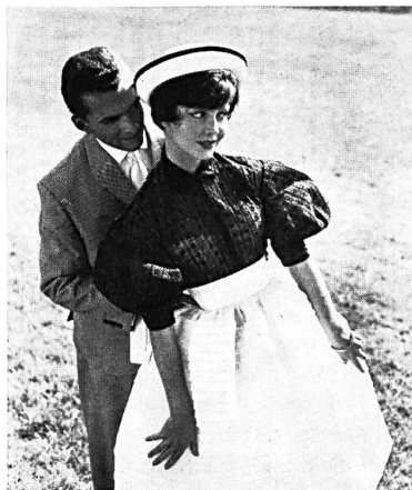
UNION S. A., SAINT-GALL

Car Saint-Gall combine toujours son grand événement sportif avec la présentation des plus belles réalisations de son industrie. Il y eut donc, comme chaque année, un