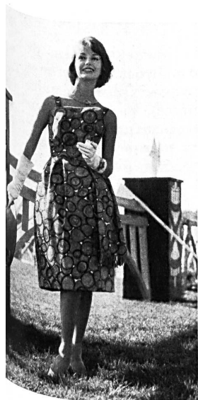
METTLER & CIE S. A., SAINT-GALL

Organdi avec broderie chenille Modèle Gack, Zurich