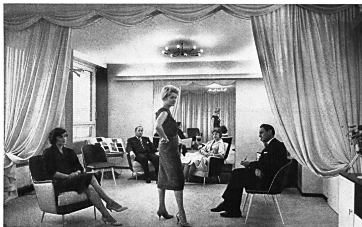
Une présentation dans un salon particulier

Depuis quelques mois, une idée qui était dans l'air depuis longtemps a trouvé sa réalisation, c'est la « Maison suisse de la mode », à Zurich. L'idée, c'était celle d'une collaboration libre dans le domaine de la « promotion » et de la vente, qui avait déjà provoqué la création du groupe « Pro Tricot Suisse » il y a deux ans environ (formule permettant à un certain nombre de fabricants suisses d'unir leurs efforts dans le domaine de la propagande tout en conservant leur liberté en matière de création et de vente). Partie des mêmes milieux, l'idée de la Maison de la Mode allait plus loin : il s'agissait d'offrir à des fabricants de bonneterie et de prêt à porter ne résidant pas à Zurich la possibilité de présenter leurs collections dans cette ville, dans des conditions favorables, sans abdiquer leur personnalité. Avec l'aide du Syndicat des exportateurs suisses de l'industrie de l'habillement, vingt-six producteurs suisses ont uni leurs efforts pour créer le centre permanent de présentation et de vente qu'est la « Maison suisse de la mode ». Dans un immeuble moderne, muni de tous les avantages désirables (parking, garage, restaurant), les acheteurs professionnels de Suisse et de l'étranger pourront voir les collections et faire leur choix en toute tranquillité et en toute discrétion, dans des salons individuels, sans perte de temps, chose avant tout précieuse à notre époque.