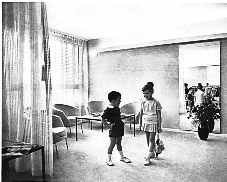
Coup d'œil dans un salon

La Maison suisse de la mode représente un pas en avant du prêt à porter suisse, qui mérite d'autant plus d'être salué avec joie, que les fabricants intéressés offrent tous la garantie d'une qualité certaine et parfois même hors classe.