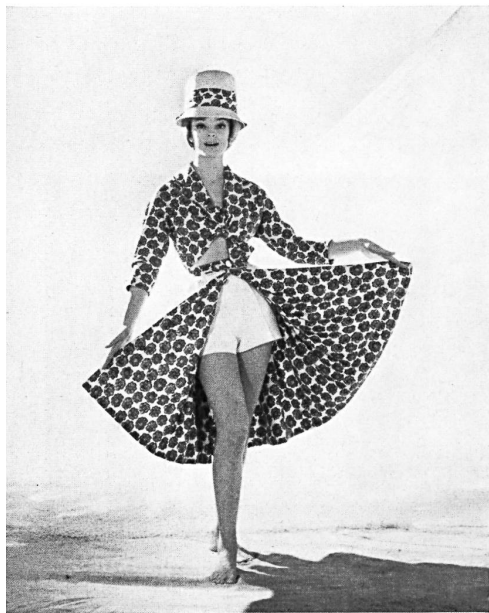
A. BLUM & CO, ZURICH

Trois-pièces en « Tri-co-tiss » d'orlon