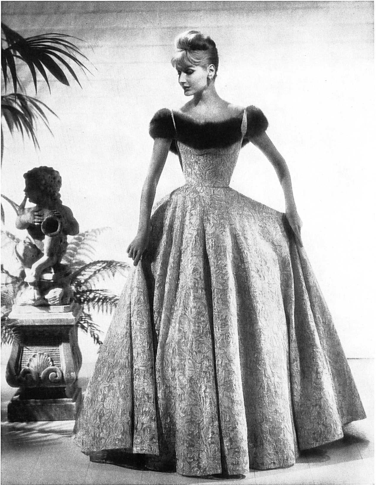
FORSTER WILLI & CO., SAINT-GALL Gold and white lace / broderie or et blanc Model by Don Loper, Beverly Hills