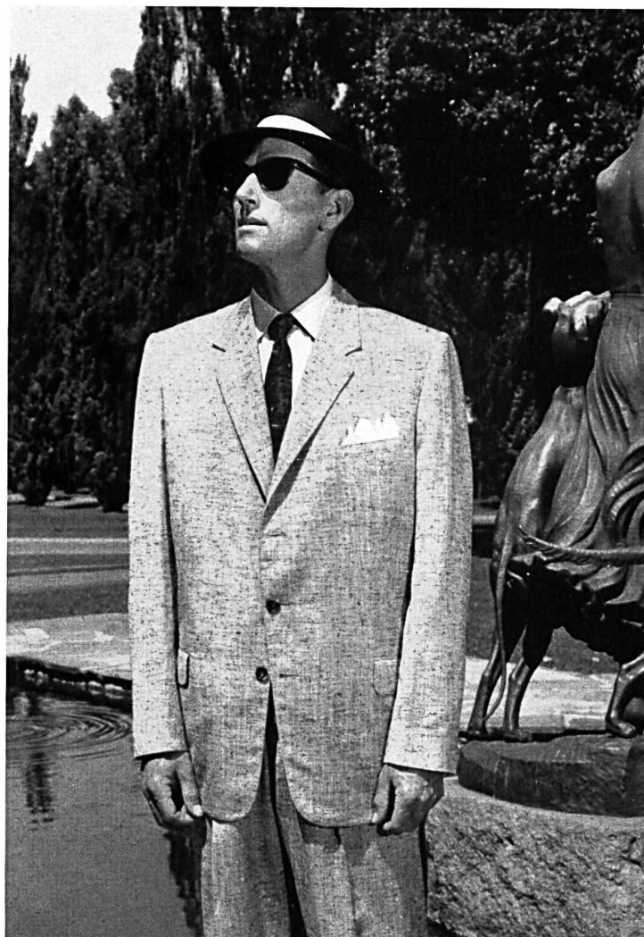
« ZURRER » WEISBROD-ZURRER SÖHNE, HAUSEN a.A. Shantung pure soie / pure silk shantung Modèle Ernest Hiller Pty. Ltd., Sydney