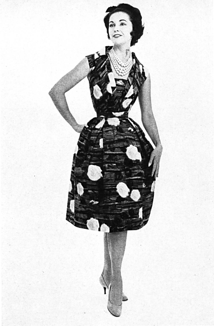
HEER & CIE S. A., THALWIL « Sarabande », coton imprimé Grossiste à Paris: Robert Burg & Cie Modèle Josette, Nice