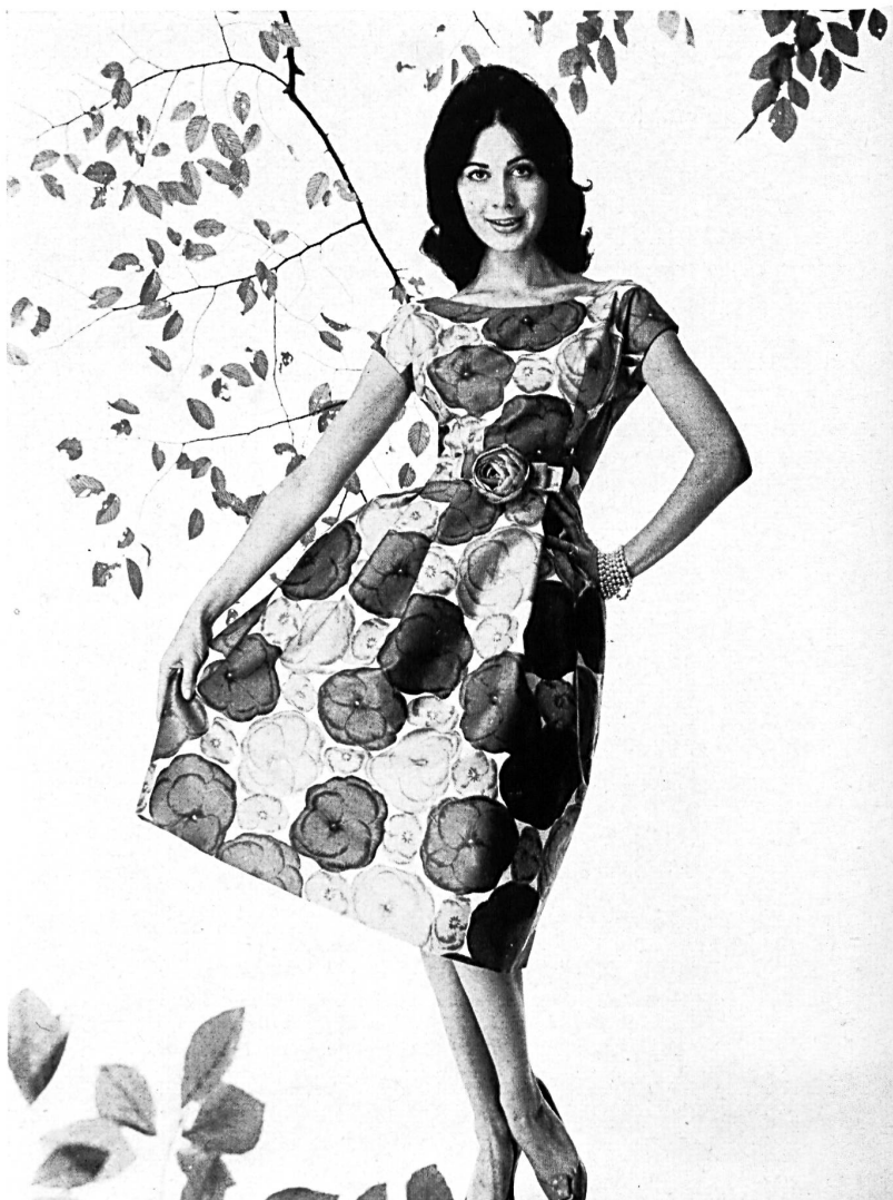
HEER & CIE S. A., THALWIL «Satin Sauvage», coton imprimé Grossiste à Paris: Robert Burg & Cie Modèle Géo Boutet, Paris