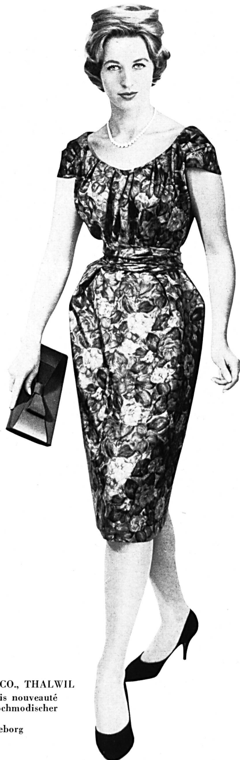
ROBT. SCHWARZENBACH & CO., THALWIL Pure soie, imprimée main, coloris nouveauté Handbedruckte reine Seide in hochmodischer Colorierung Modèle A/B Lena-Modeller, Göteborg