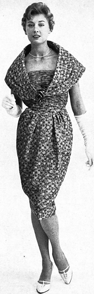
ROBT. SCHWARZENBACH & CO., THALWIL Imprimé pure soie / pure silk printed fabric Modèle Continental Modes, Sydney