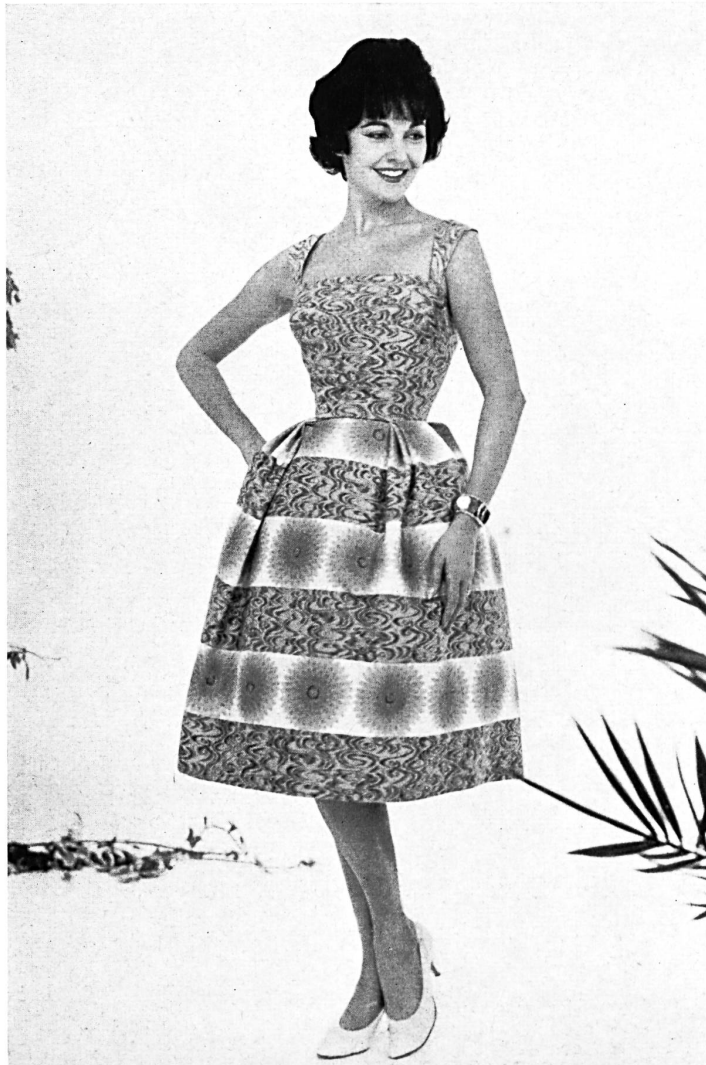
HEER & CIE S. A., THALWIL « Funny Face », coton imprimé Grossiste à Paris: Robert Burg & Cie Modèle Josette, Nice