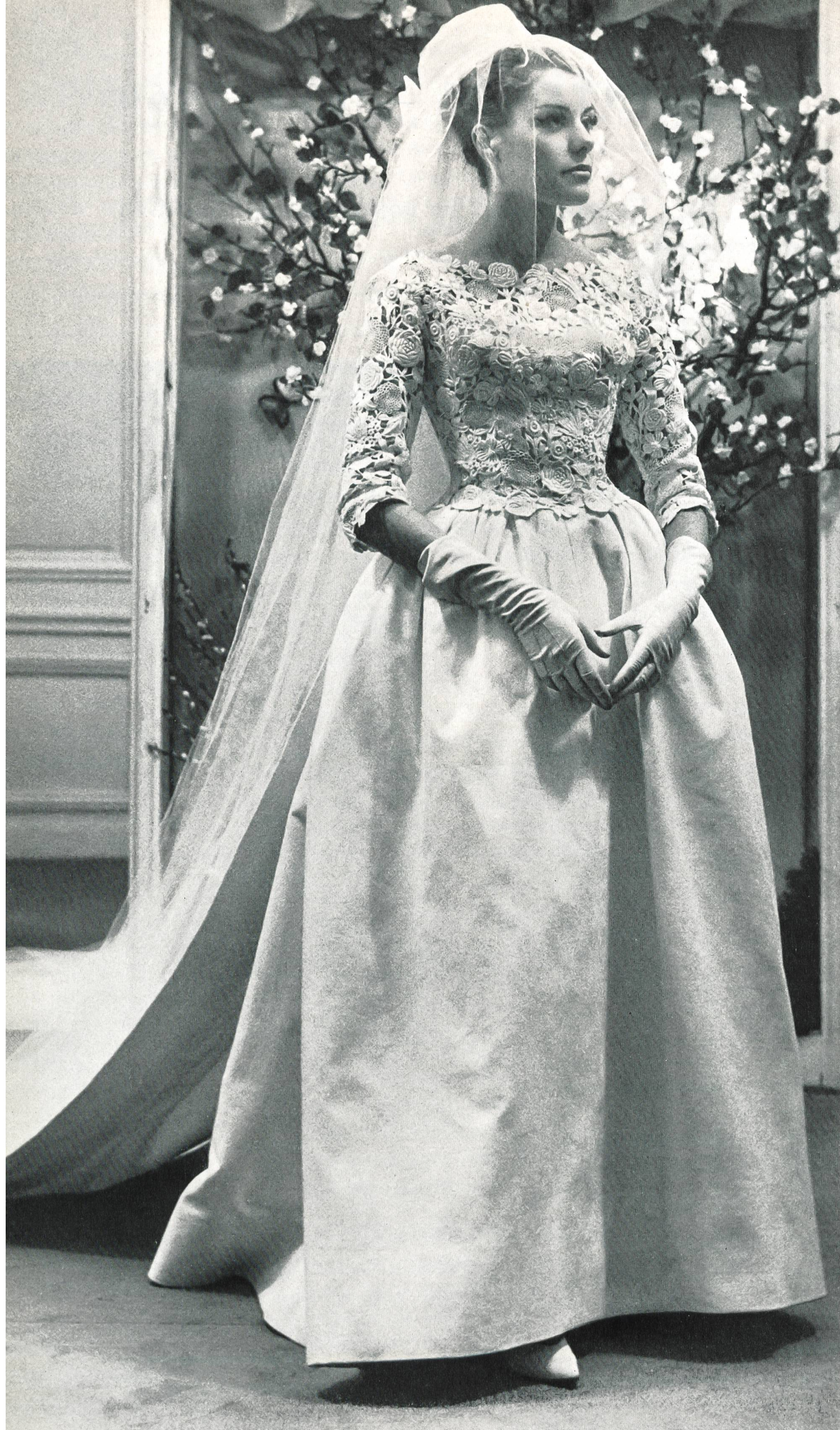
JEAN PATOU Guipure riche de Forster Willi & Co., Saint-Gall Grossiste à Paris : Les Tisseurs B de M