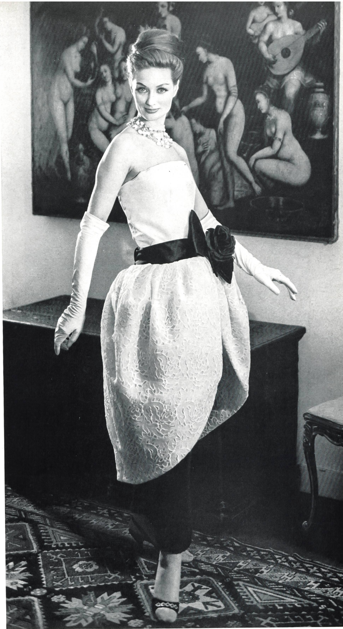
PIERRE CARDIN Organdi blanc brodé et découpé de Théodor Locher & Co., Saint-Gall Grossiste à Paris : Pierre Brivet S.à r.l.