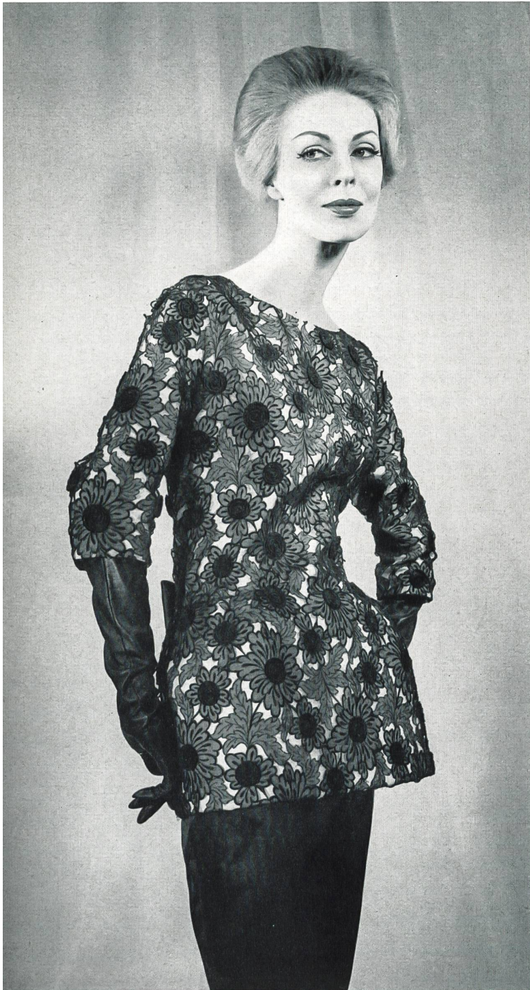
PIERRE CARDIN Organdi brodé nouveauté avec applications de Union S. A., Saint-Gall Grossiste à Paris : Robert Burg & Cie