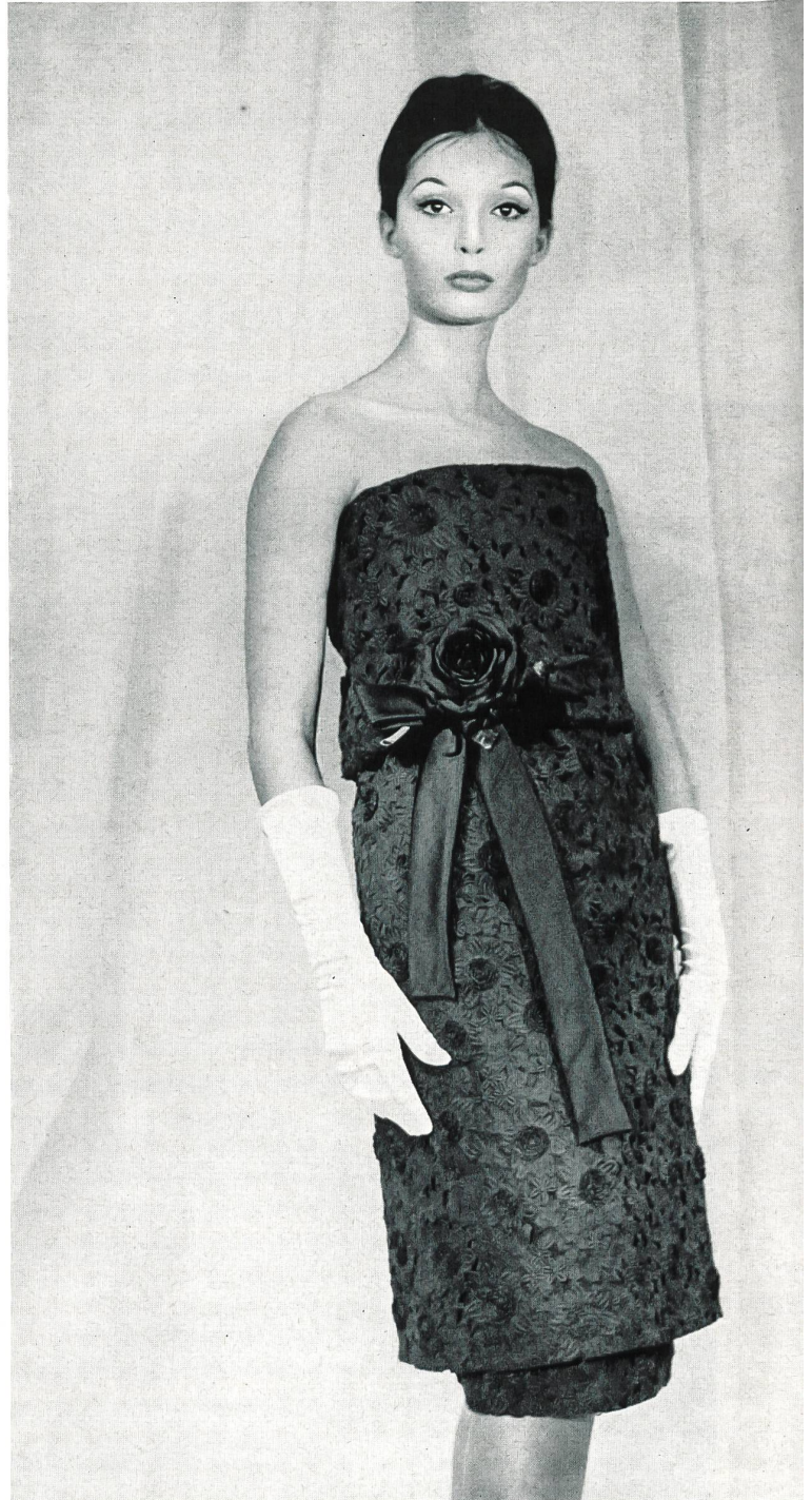
PIERRE CARDIN Organdi brodé nouveauté avec applications de Union S. A., Saint-Gall Grossiste à Paris : Robert Burg & Cie