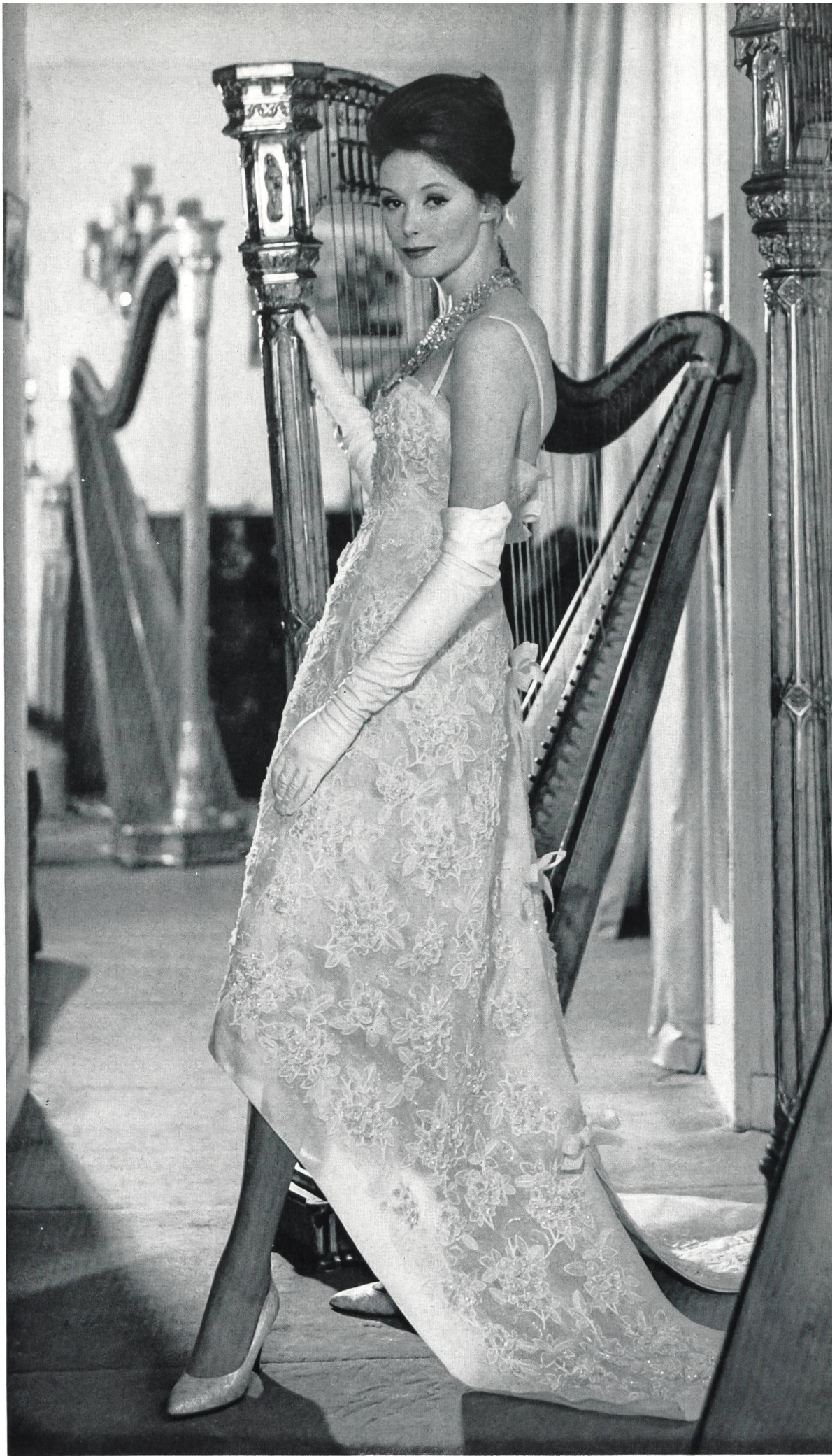
CHRISTIAN DIOR Organdi brodé découpé de Forster Willi & Co., Saint-Gall