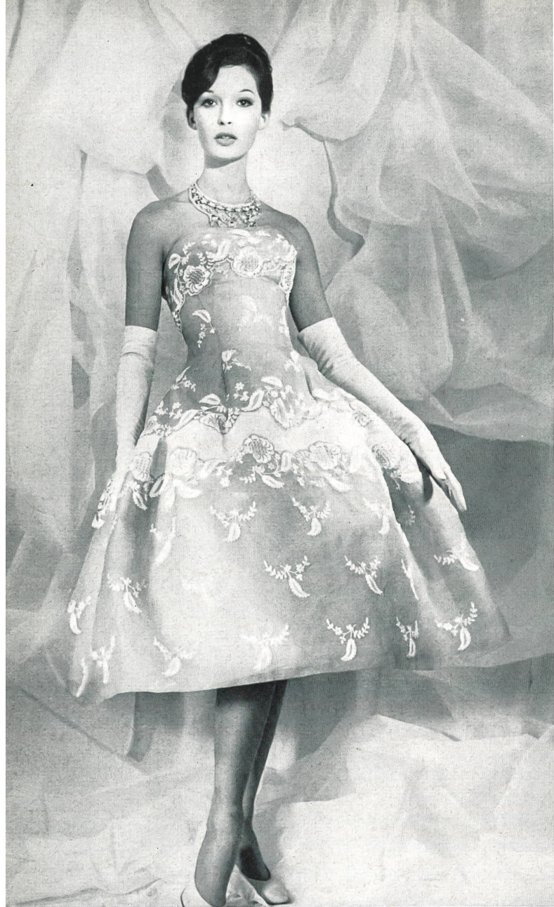
CARVEN Bordure d'organdi brodé de Forster Willi & Co., Saint-Gall Grossiste à Paris : Robert Burg & Cie