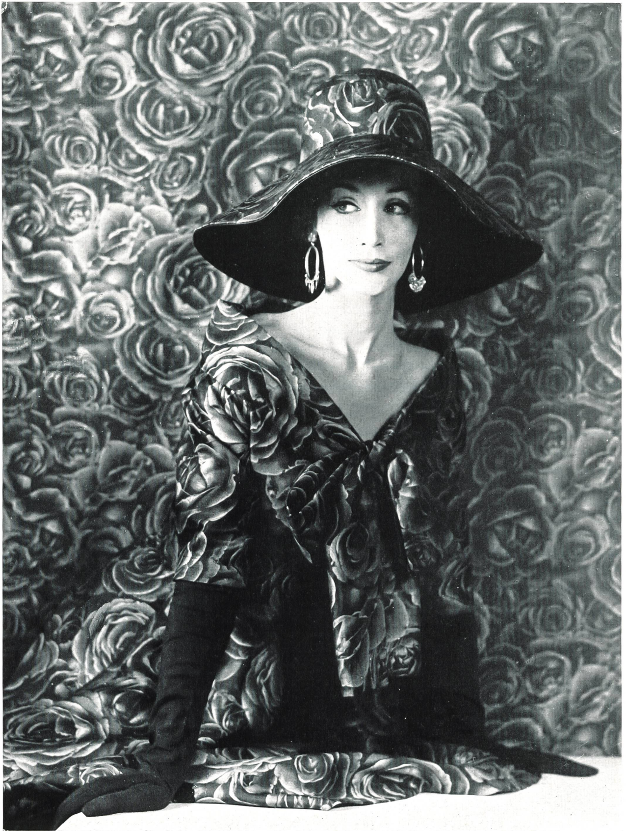
NINA RICCI Ensemble en « Atout » imprimé de L. Abraham & Cie, Soieries S. A., Zurich