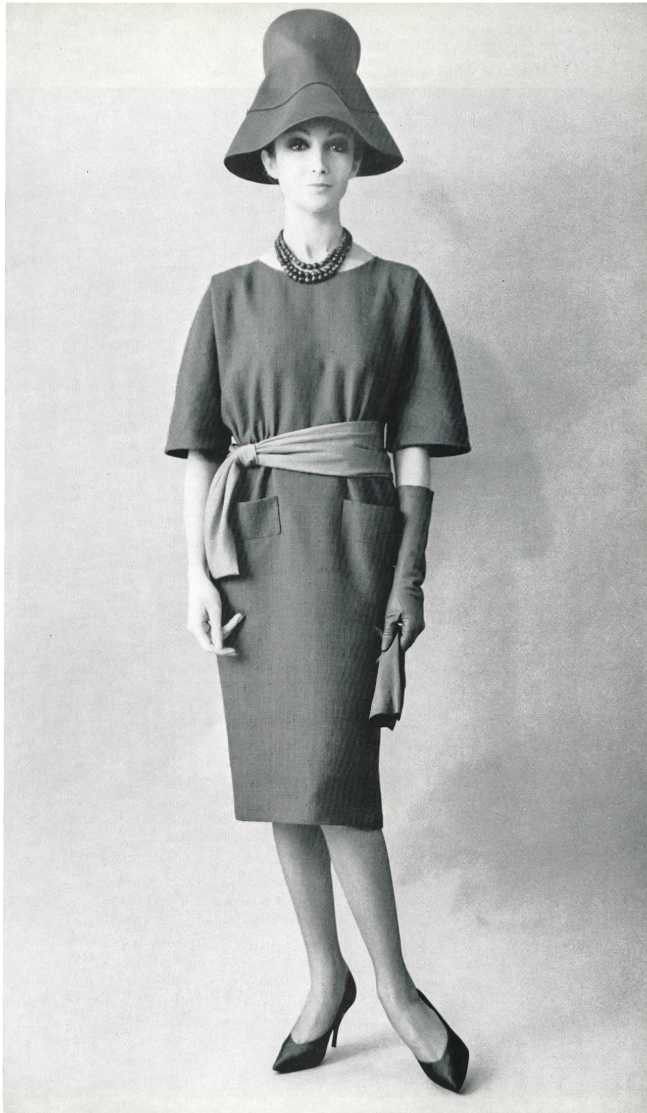
PIERRE CARDIN « Cresta », pure soie, de Heer & Cie S.A., Thalwil Grossiste à Paris : Robert Burg & Cie