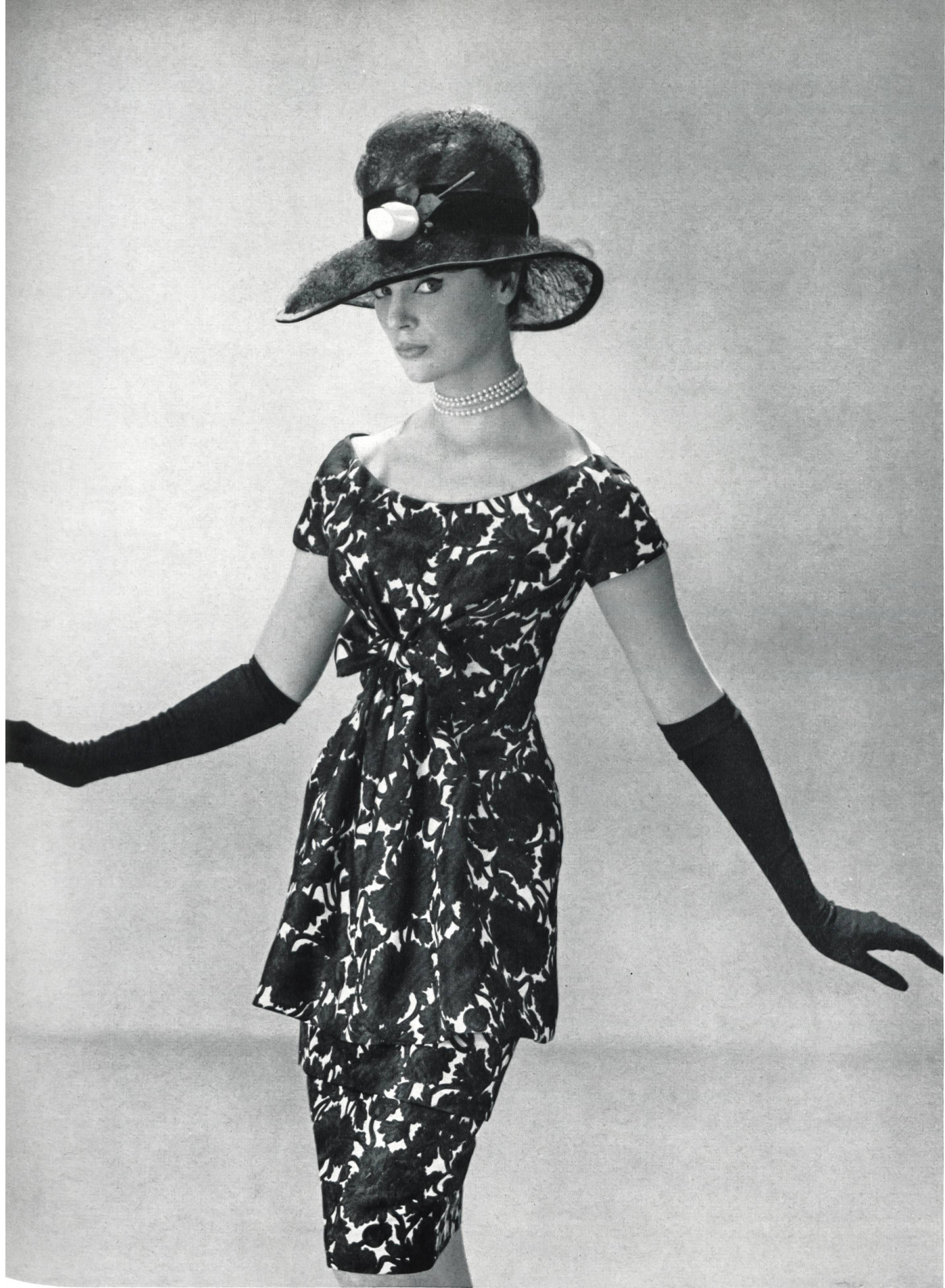
JACQUES HEIM Robe en « Taftalia » imprimé de L. Abraham & Cie, Soieries S. A., Zurich