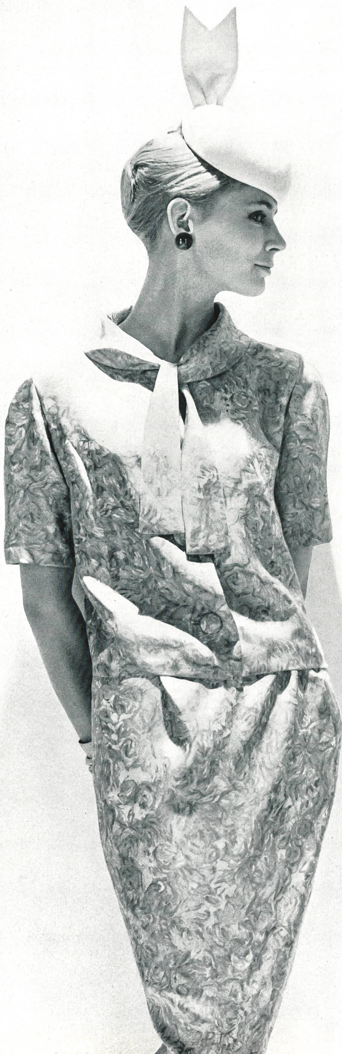
PIERRE CARDIN Tissu « bégé » Twill Aquarelle pure soie Fabricant : Berthold Guggenheim Fils & Cie, Zurich Paris : J. Léonard & Cie