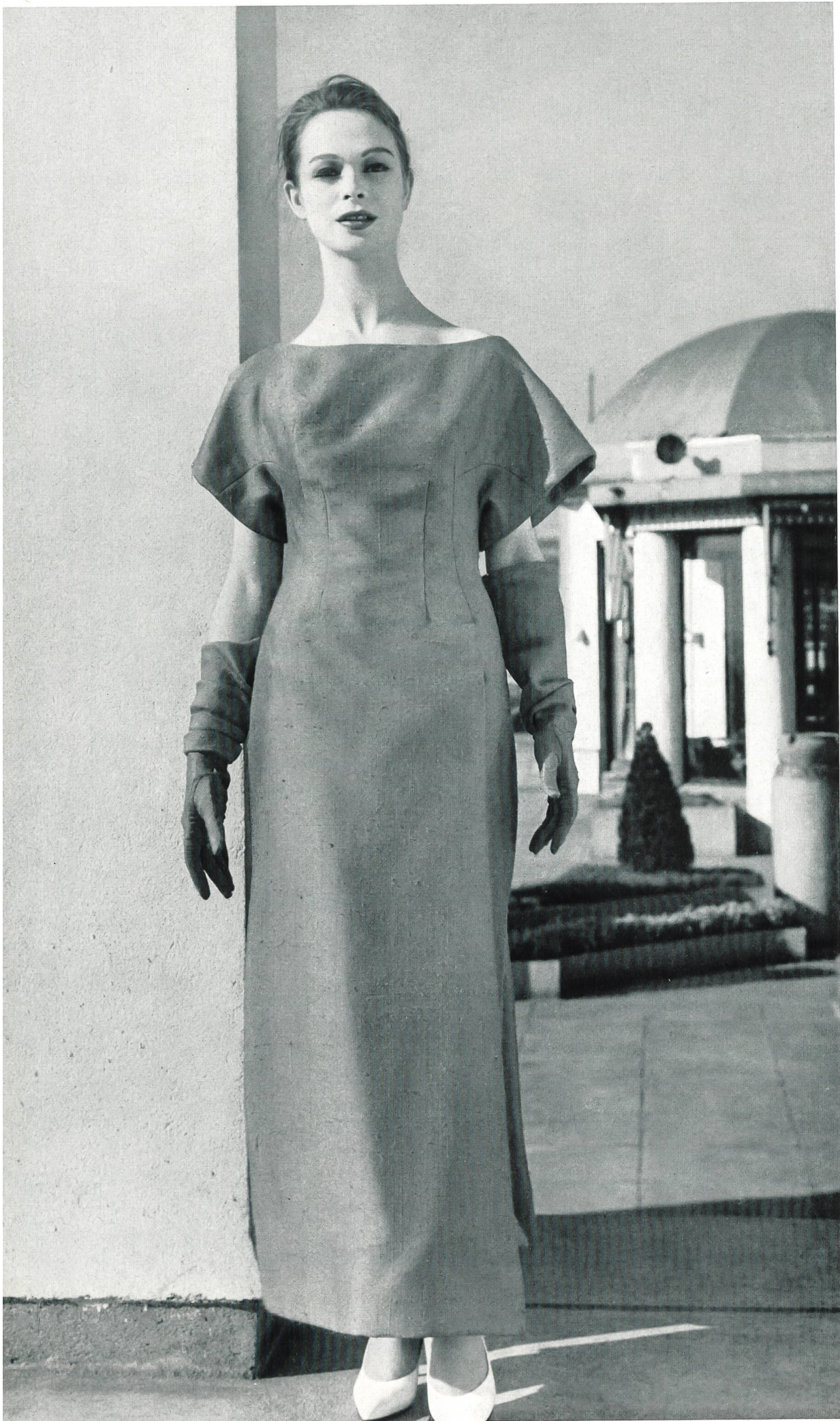
JACQUES HEIM « Esquito », soie naturelle, de Heer & Cie S.A., Thalwil Grossiste à Paris : Robert Burg & Cie