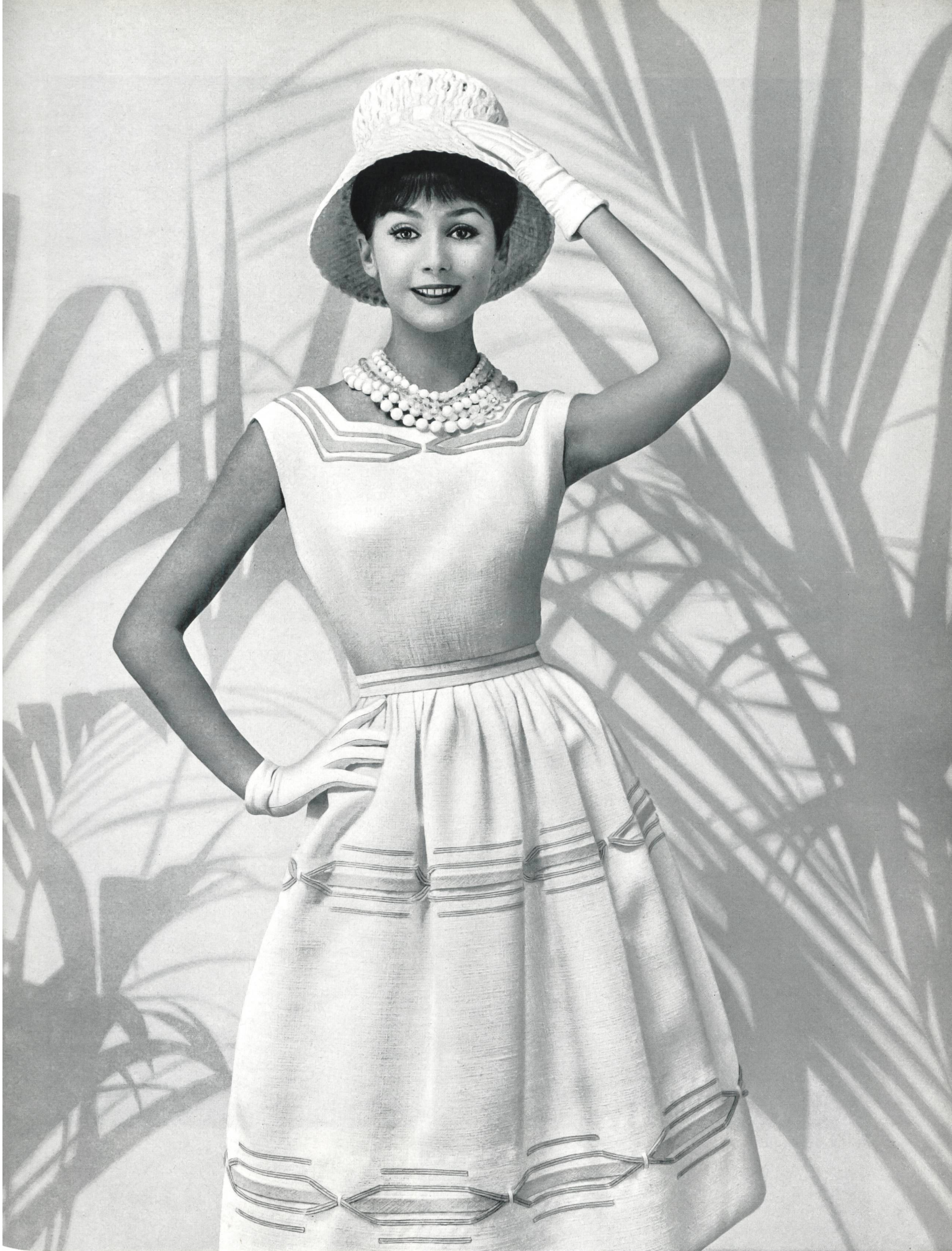
CARVEN (Boutique) « Oki-Ama », imitation lin, de Heer & Cie S.A., Thalwil