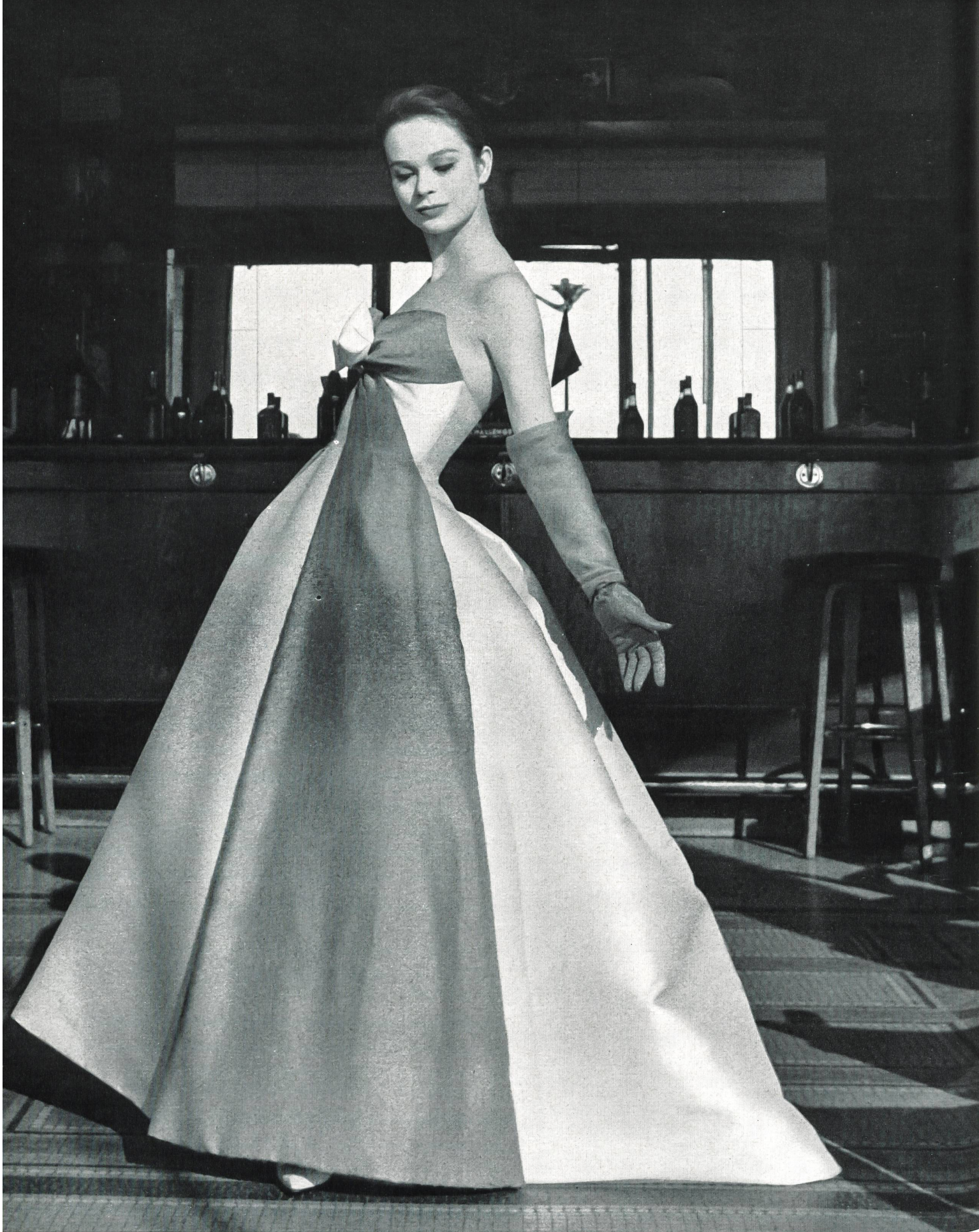
JACQUES HEIM « Esquito », soie naturelle, de Heer & Cie S. A., Thalwil Grossiste à Paris : Robert Burg & Cie