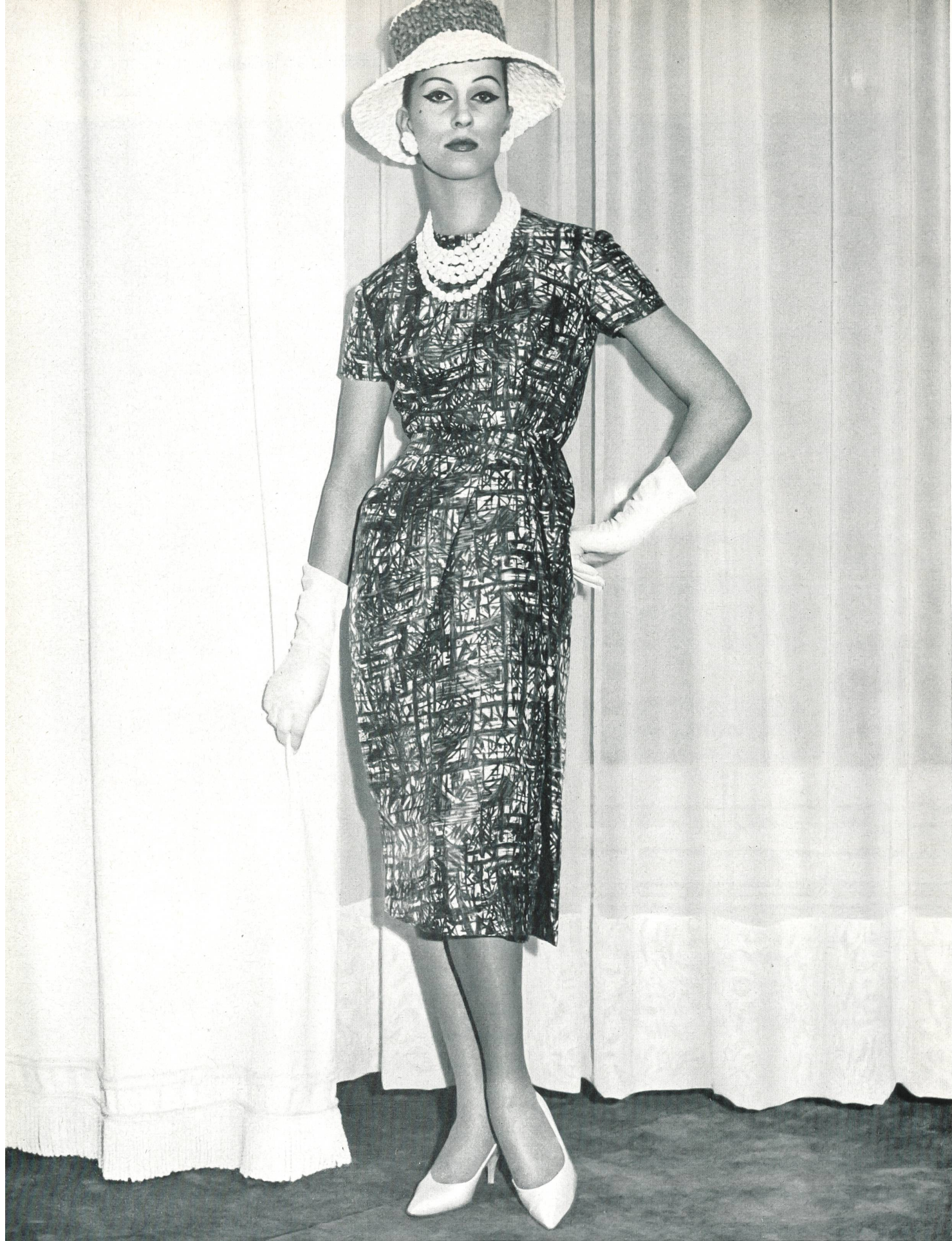
PIERRE BALMAIN « Luanda », pure soie imprimée, de Rudolf Brauchbar & Cie, S.A., Zurich Distribué par Montex, Paris