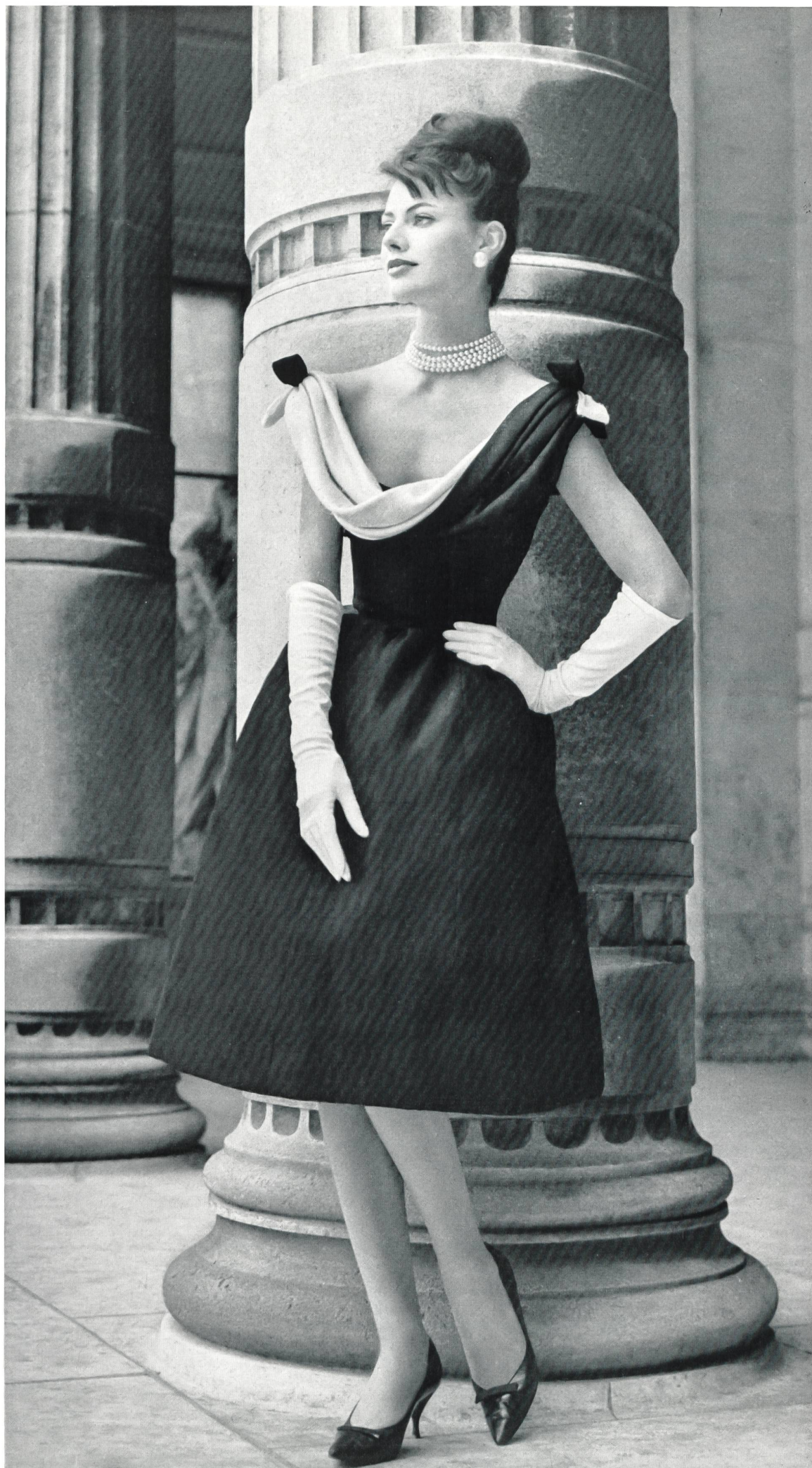
MADELEINE DE RAUCH « Esquito », soie naturelle, de Heer & Cie S.A., Thalwil Grossiste à Paris : Robert Burg & Cie Photo Tenca