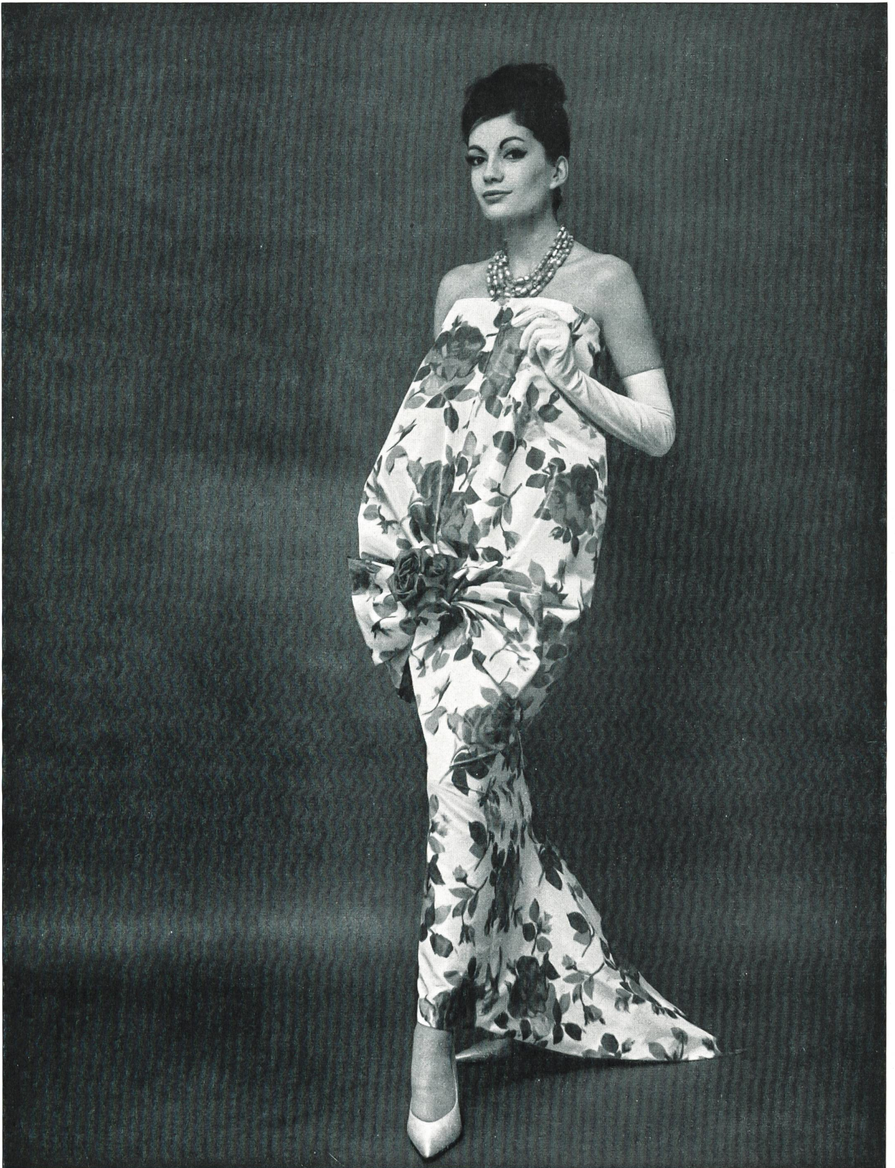
PIERRE CARDIN Taffetas chiné, pure soie, de Rudolf Brauchbar & Cie S.A., Zurich Distribué par Montex, Paris