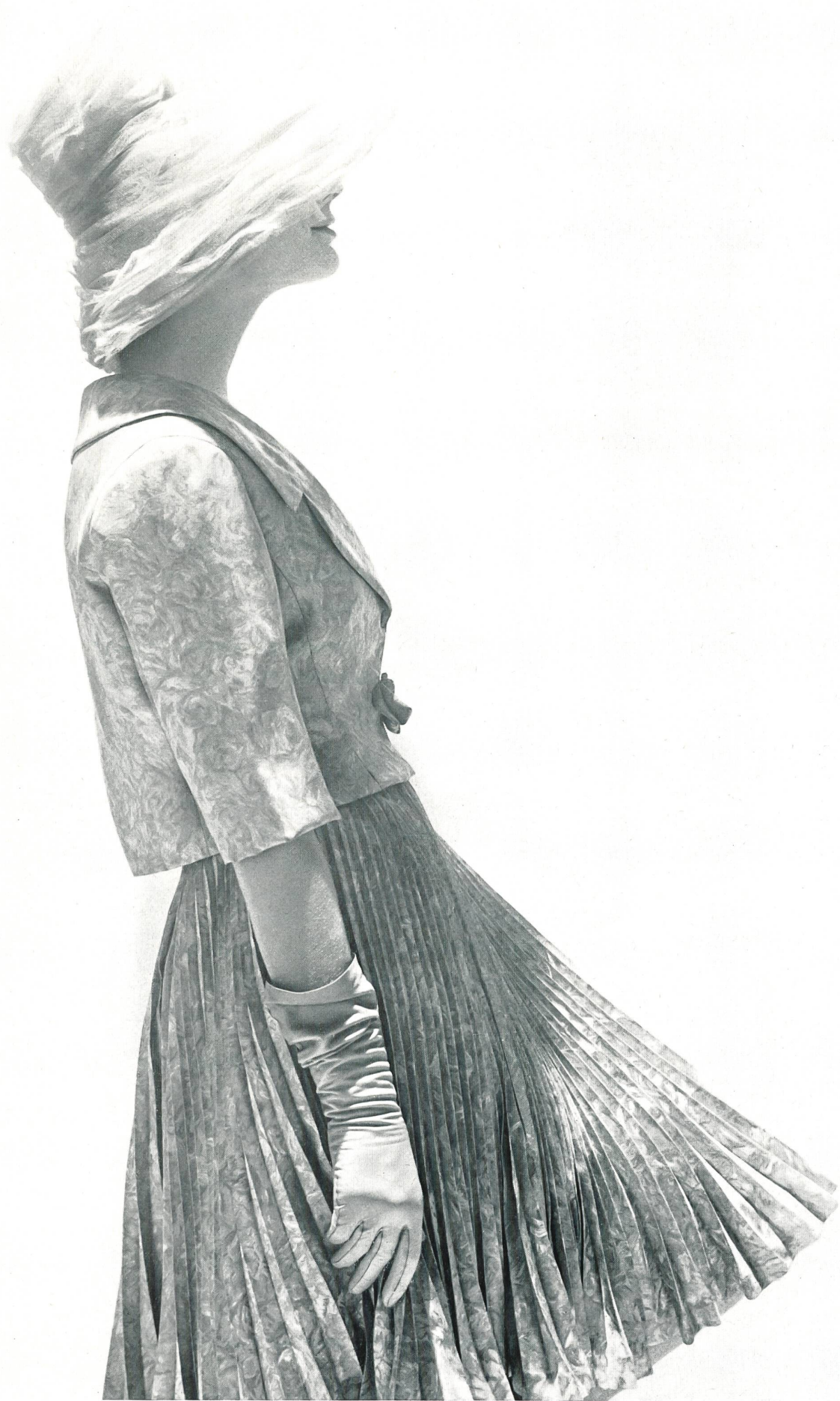
LANVIN CASTILLO Tissu « bégé » Twill Aquarelle pure soie Fabricant : Berthold Guggenheim Fils & Cie, Zurich Paris : J. Léonard & Cie