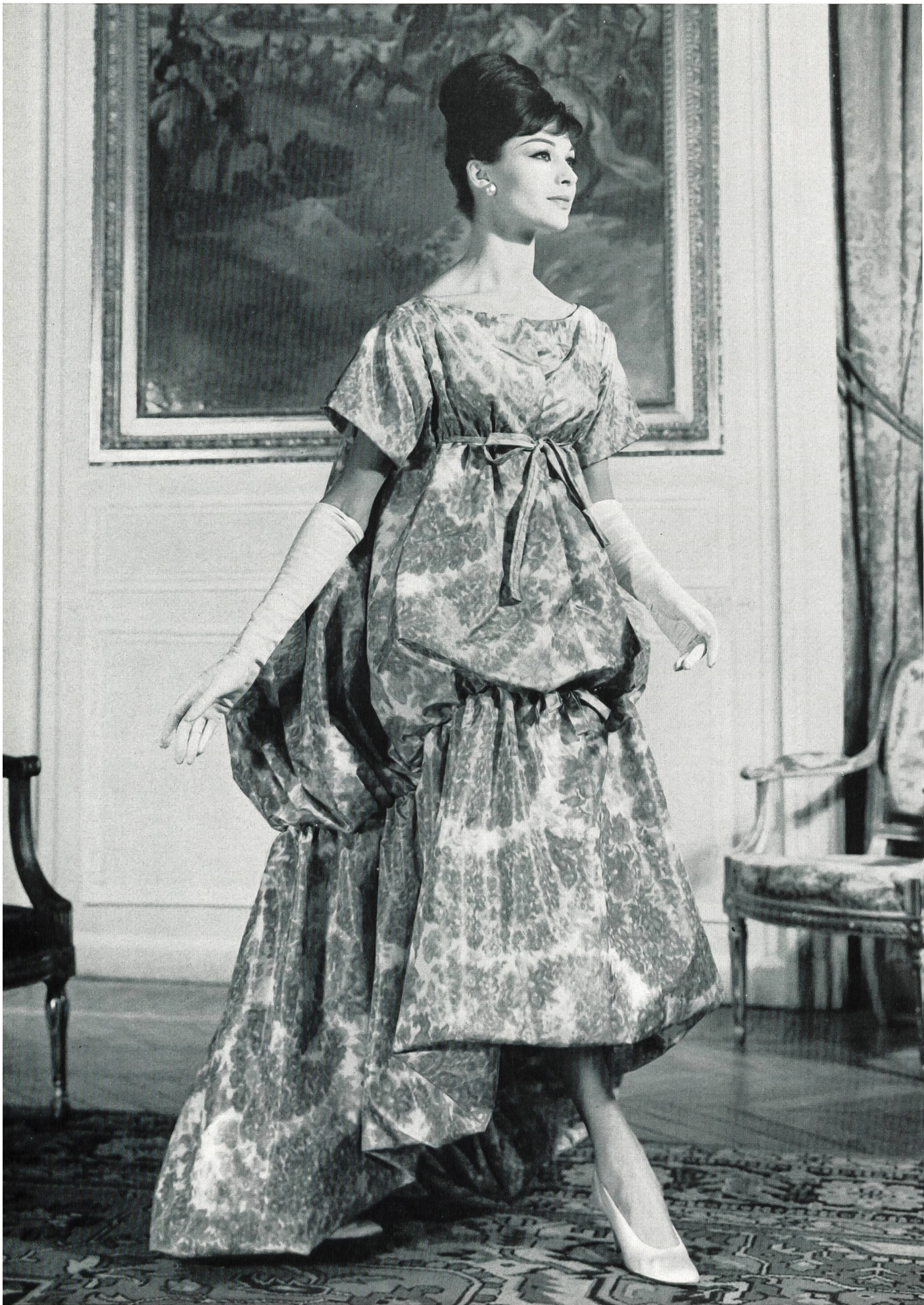
CHRISTIAN DIOR Taffetas chiné pure soie de Rudolf Brauchbar & Cie S.A., Zurich