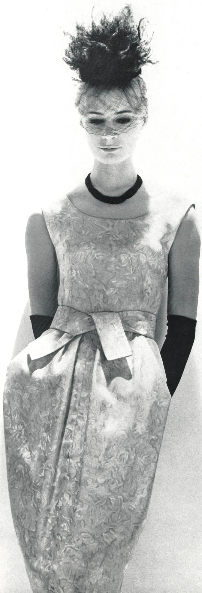
JACQUES HEIM Tissu « bégé » Twill Aquarelle pure soie Fabricant : Berthold Guggenheim Fils & Cie, Zurich Paris : J. Léonard & Cie