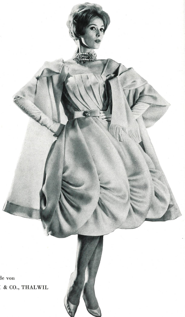
Modèle GACK, ZURICH

Satin organdi pure soie de Pure silk organdy satin by Raso organdí pura seda de Organdy Satin aus reiner Seide von