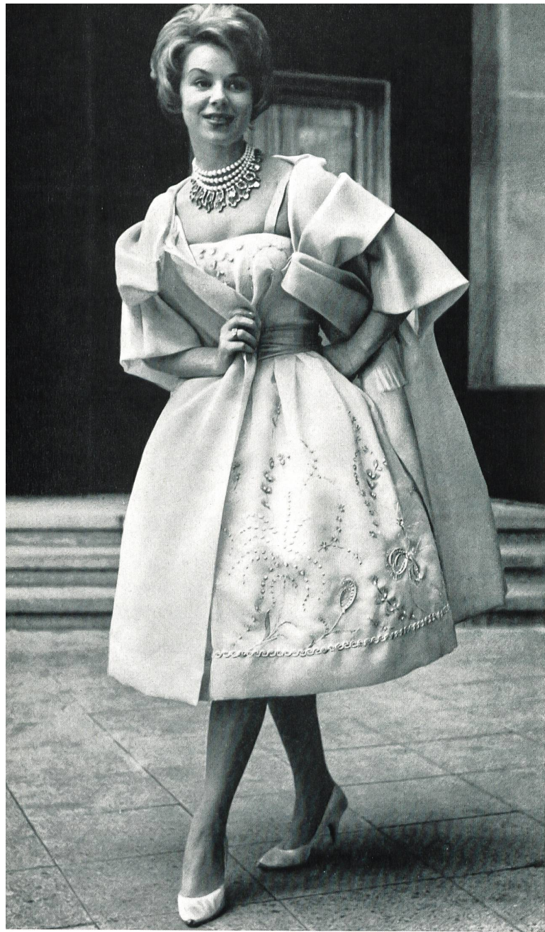
Modèle GACK, ZURICH

Satin organdi pure soie de Pure silk organdy satin by Raso organdí pura seda de Organdy Satin aus reiner Seide von