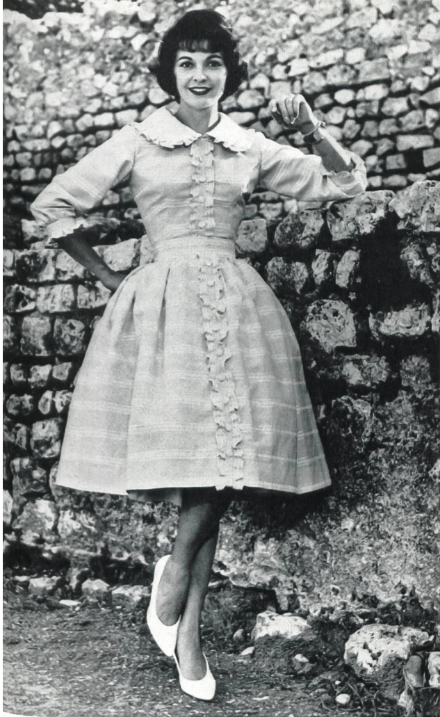
« RECO », REICHENBACH & CO., SAINT-GALL

« Recosablé » Minicare Modèle Brigitte, Cannes