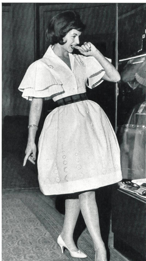
« RECO », REICHENBACH & CO., SAINT-GALL

Batiste brodée Minicare Minicare embroidered batist Modèle Marinelli, Nice