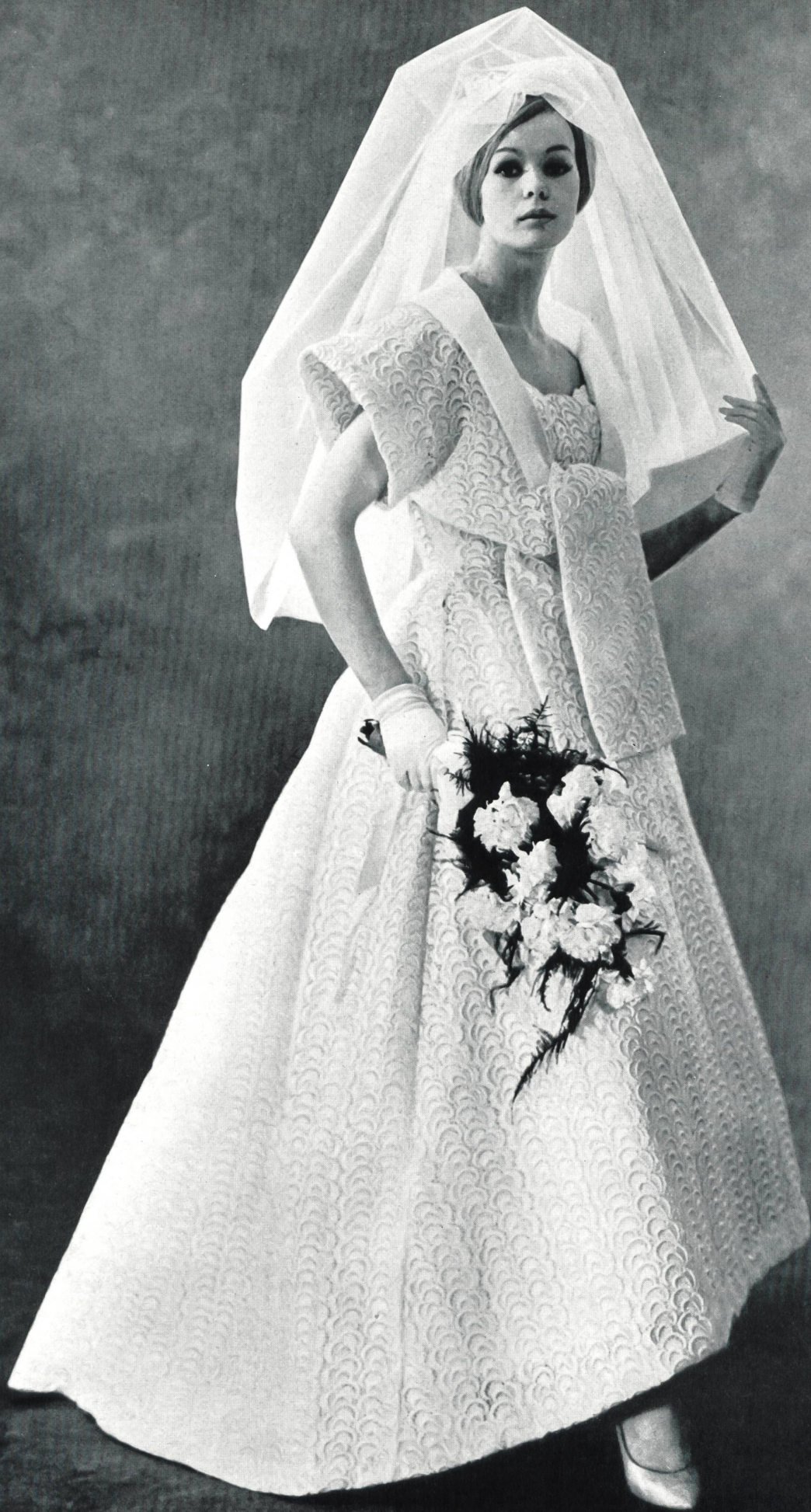
Modèle GACK, ZURICH

Guipure lourde de Heavy guipure by Encaje de guipur pesado de Schwere Guipure-Spitze von FORSTER WILLI & CO., SAINT-GALL