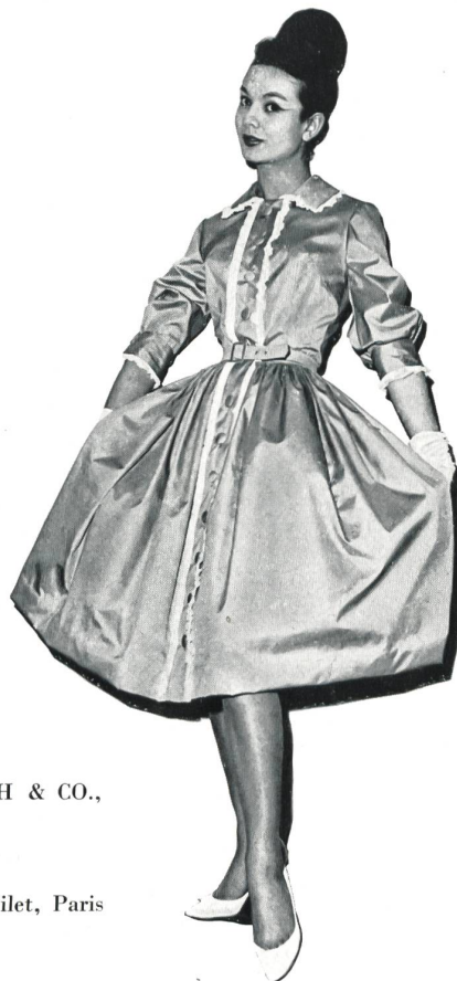
« RECO », REICHENBACH & CO., SAINT-GALL

Popeline unie Plain poplin Modèle Henri Pilet, Paris