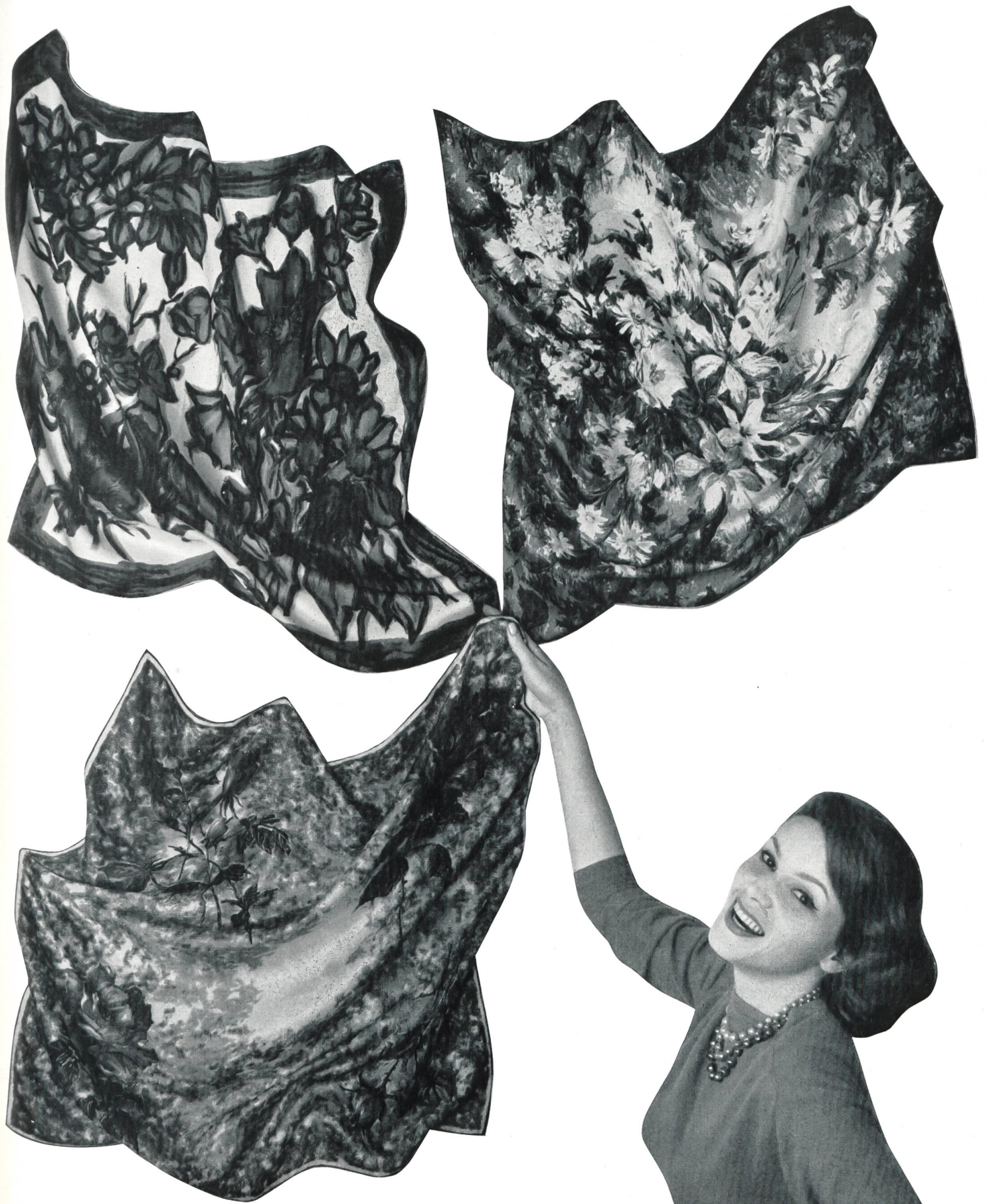
F. BLUMER & CIE, SCHWANDEN Carrés de twill pure soie, imprimés et roulés à la main Pure silk twill squares, hand printed and hand rolled Pañoletas de twill de pura seda, estam- padas y repulgadas a mano Reinseiden-Twill Carrés, handbedruckt und handrolliert