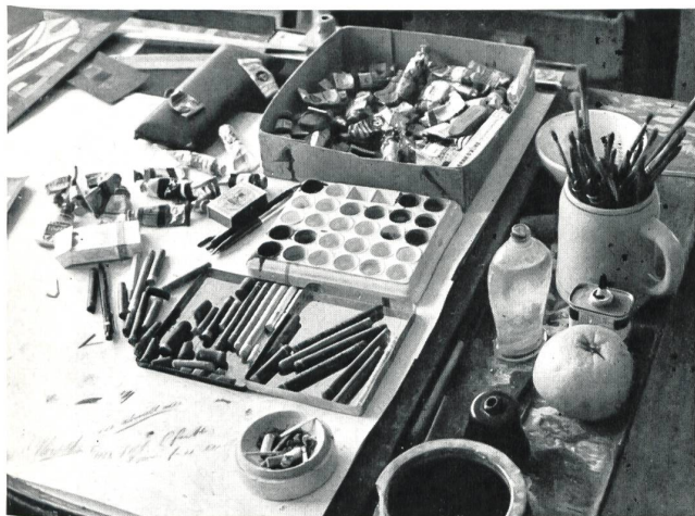
Les outils de l'artiste.

Les créateurs des petits mouchoirs Stoffels, ce sont tout simplement ceux que l'on appelle du terme anodin de « dessinateurs en textiles ». Ils reçoivent leur formation dans des écoles professionnelles de textiles et de mode et, en gros, leur programme hebdomadaire d'études est le suivant :