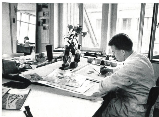
Dessin d'après nature d'un délicat motif floral pour mouchoirs.

Comme cela paraît prosaïque ! Pourtant, ils ne sont pas prosaïques du tout, ces créateurs et ces créatrices de mouchoirs Stoffels. Si l'on pénètre dans leur atelier, au dernier étage de l'imposant immeuble qui porte le nom de « Washington », à Saint-Gall, on est accueilli aux sons