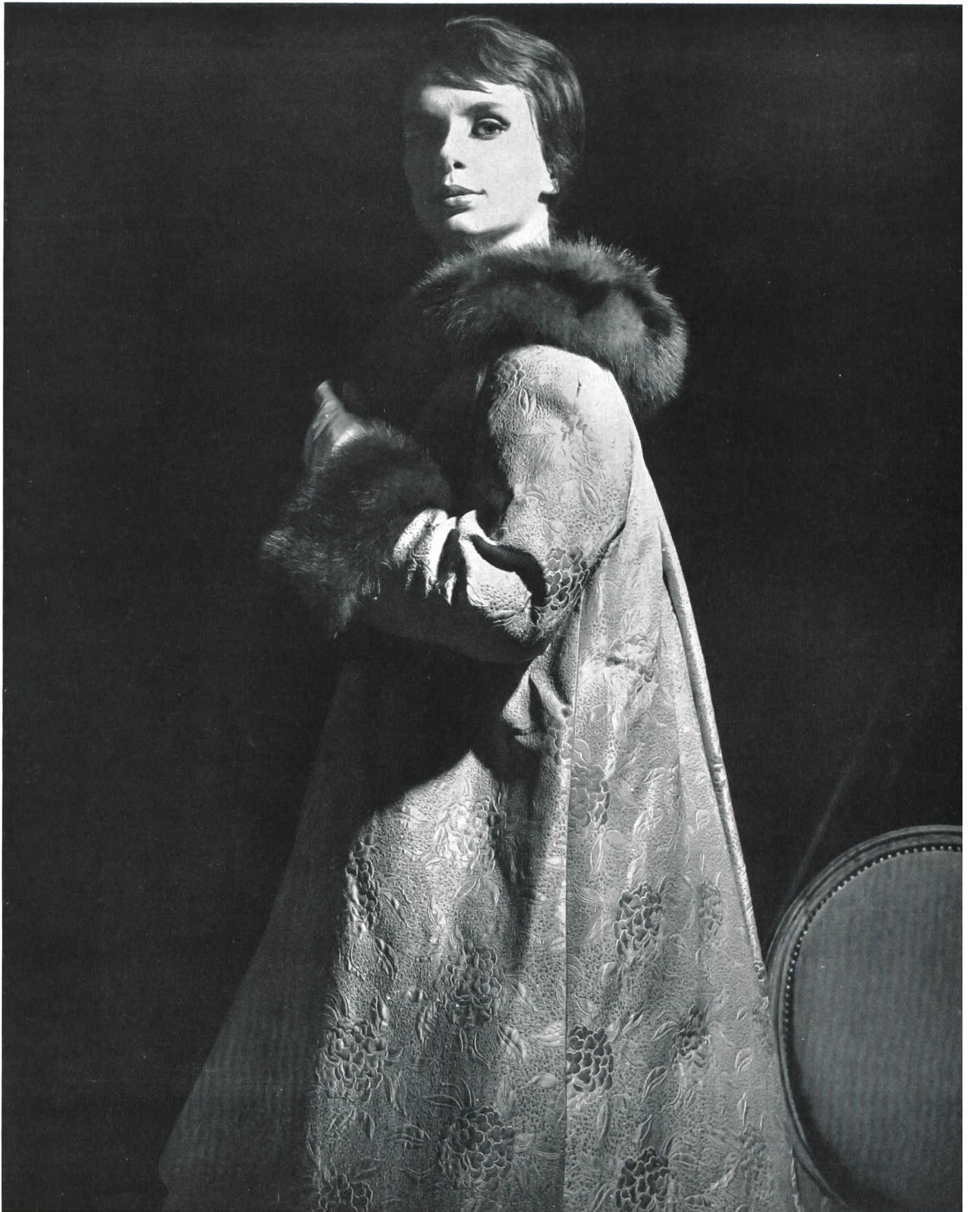
CARVEN Façonné tout soie des Soieries Stehli S. A., Zurich