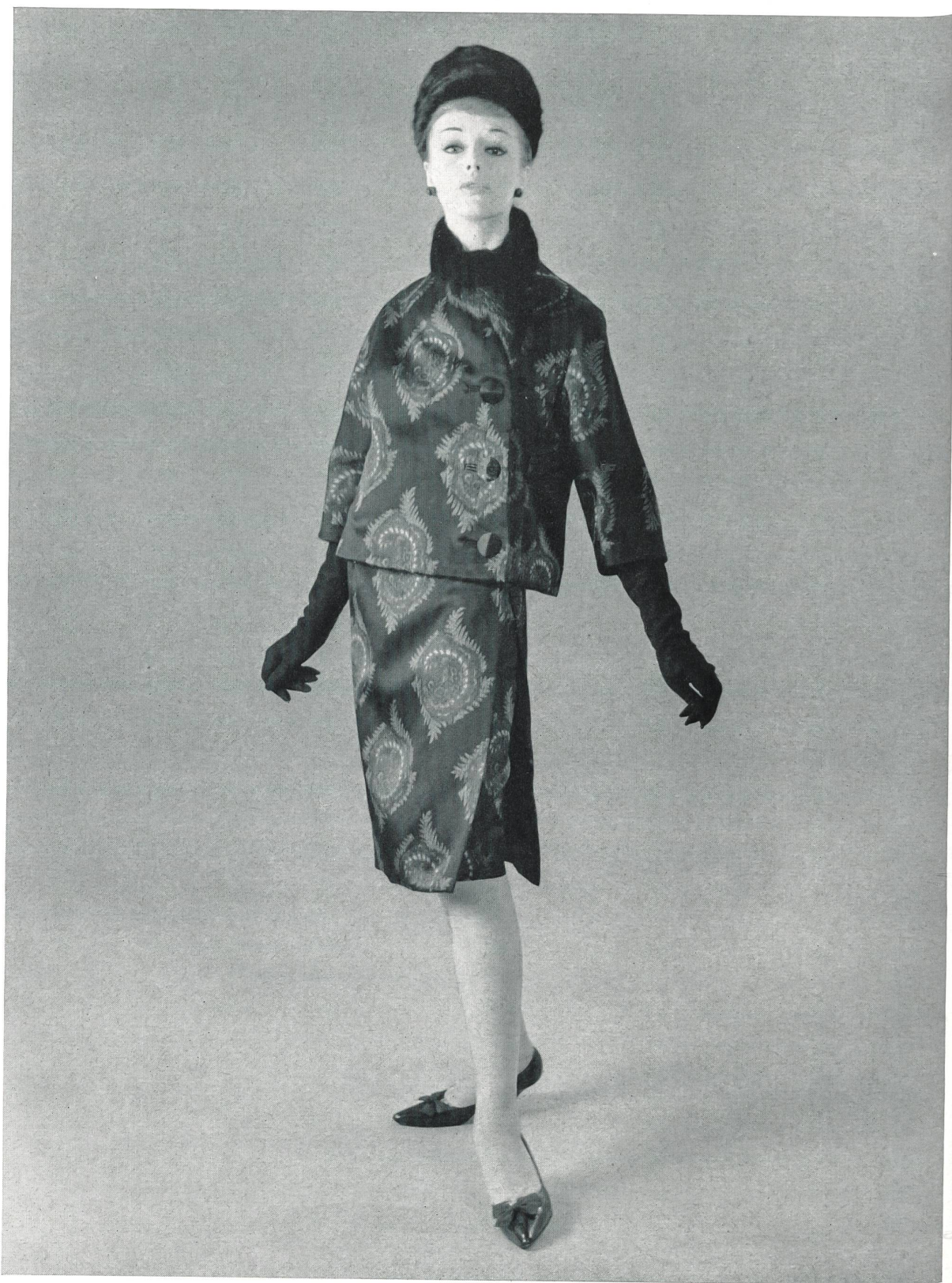
GUY LAROCHE Satin double-face imprimé sur chaîne de L. Abraham & Cie, Soeries S. A., Zurich