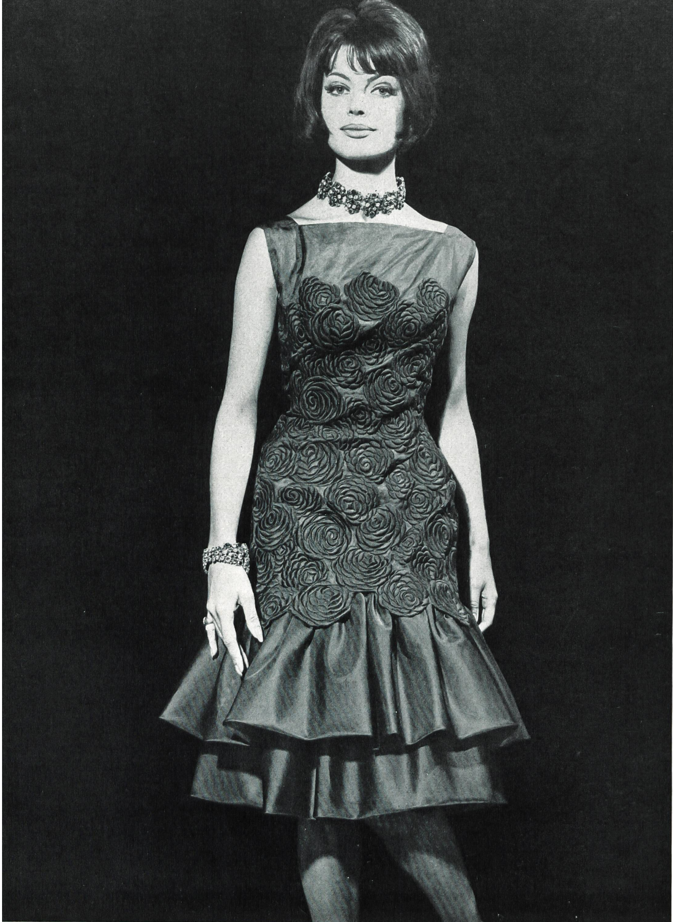
BERNARD SAGARDOY Broderie de coton sur organdi de pure soie de Jacob Rohner S. A., Rebstein