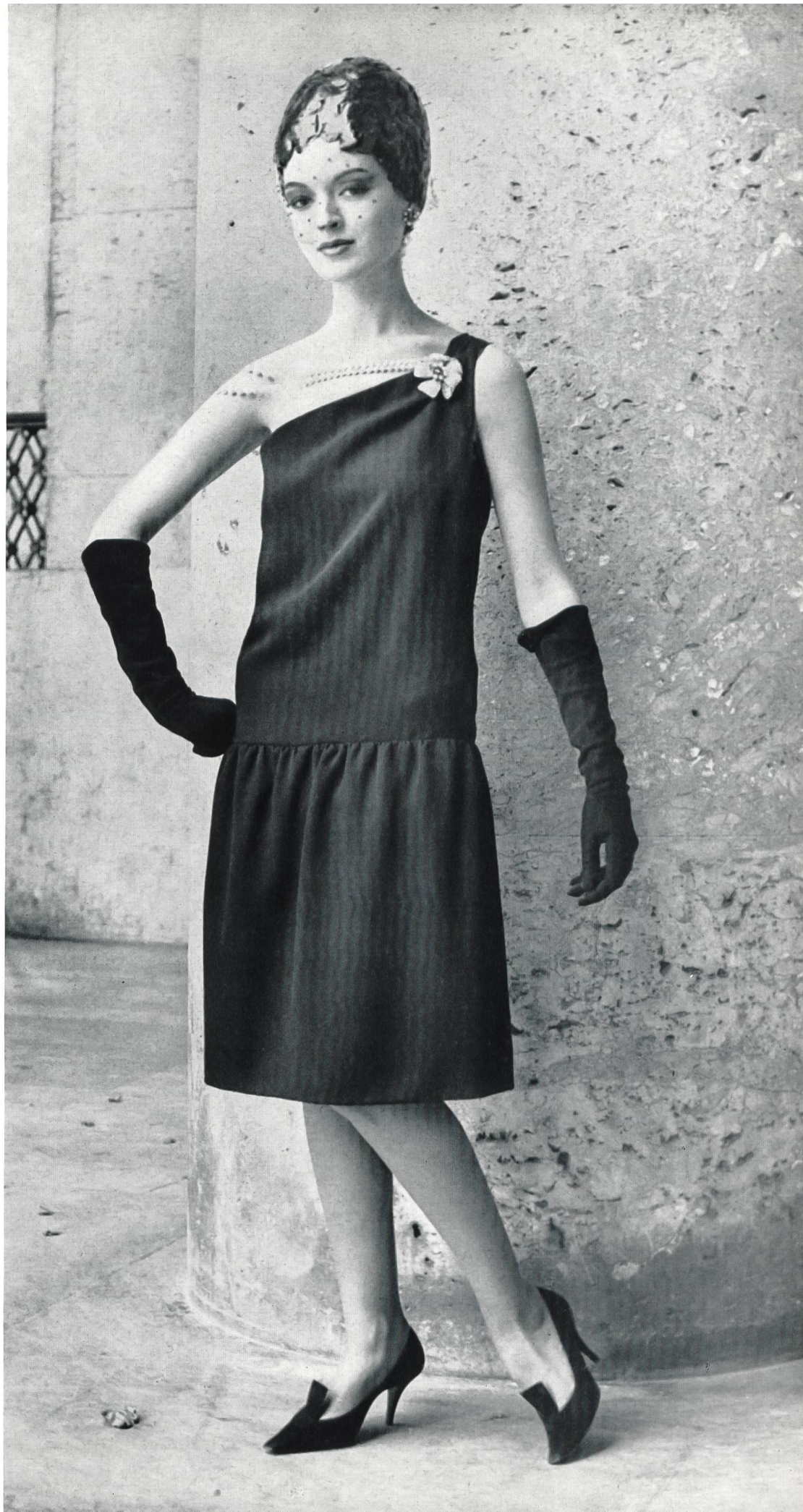
CHRISTIAN DIOR Crêpe noir de la S. A. Stünzi Fils, Horgen