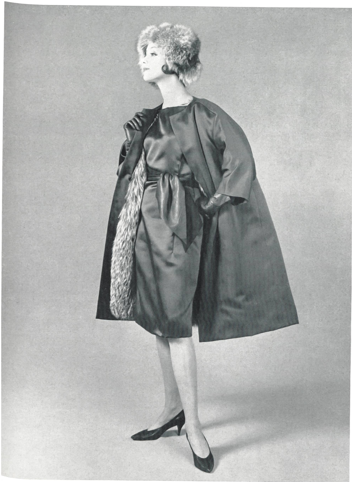
JACQUES HEIM Satin Duchesse de L. Abraham & Cie, Soieries S. A., Zurich