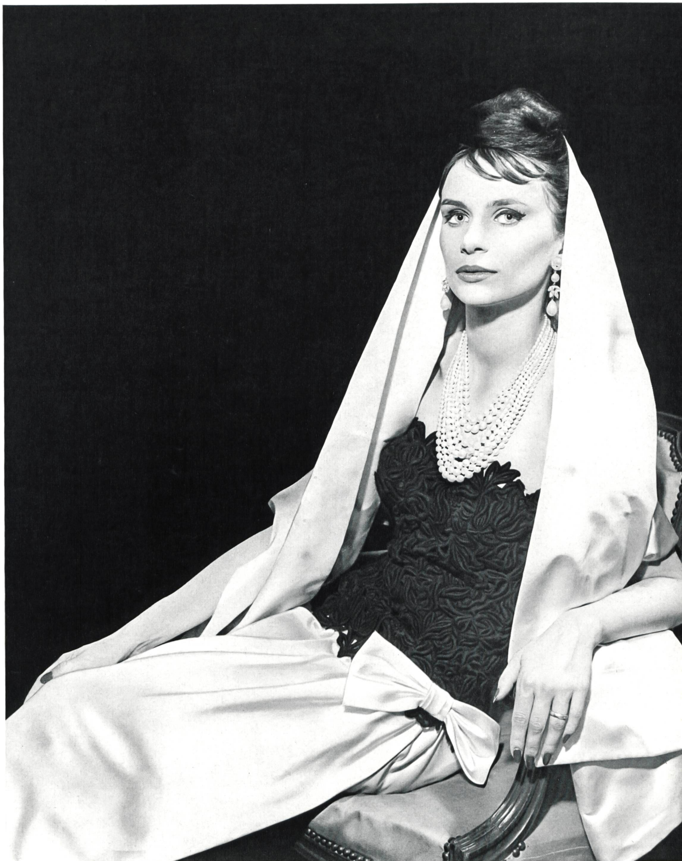
MAGGY ROUFF Broderie de laine sur organdi, genre guipure, de Forster Willi & Co., Saint-Gall Grossiste à Paris : Robert Burg & Cie