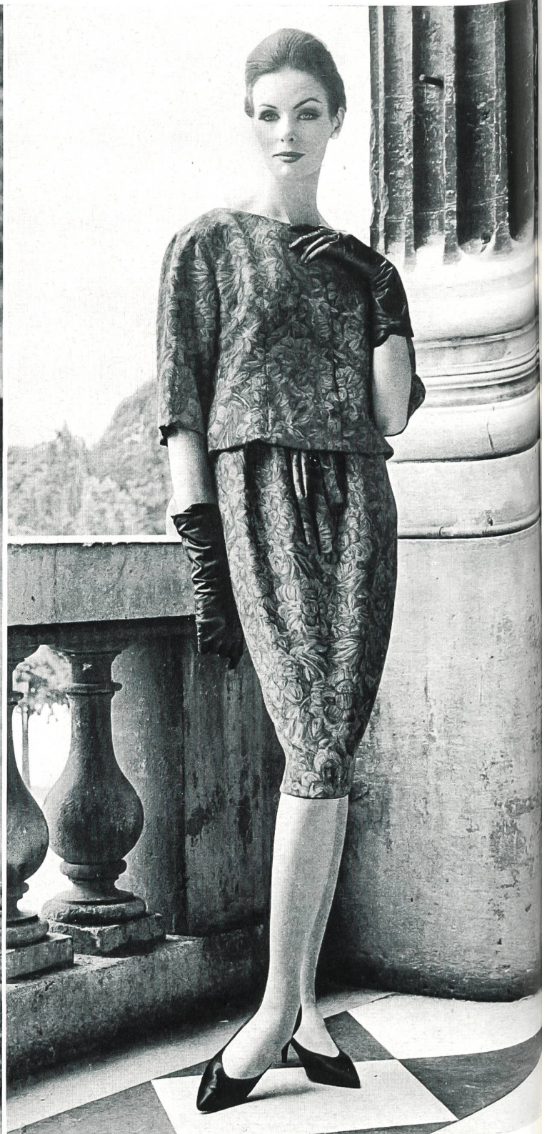
CHRISTIAN DIOR (Boutique) Soielaine « Miranda » de Reichenbach & Co., Saint-Gall