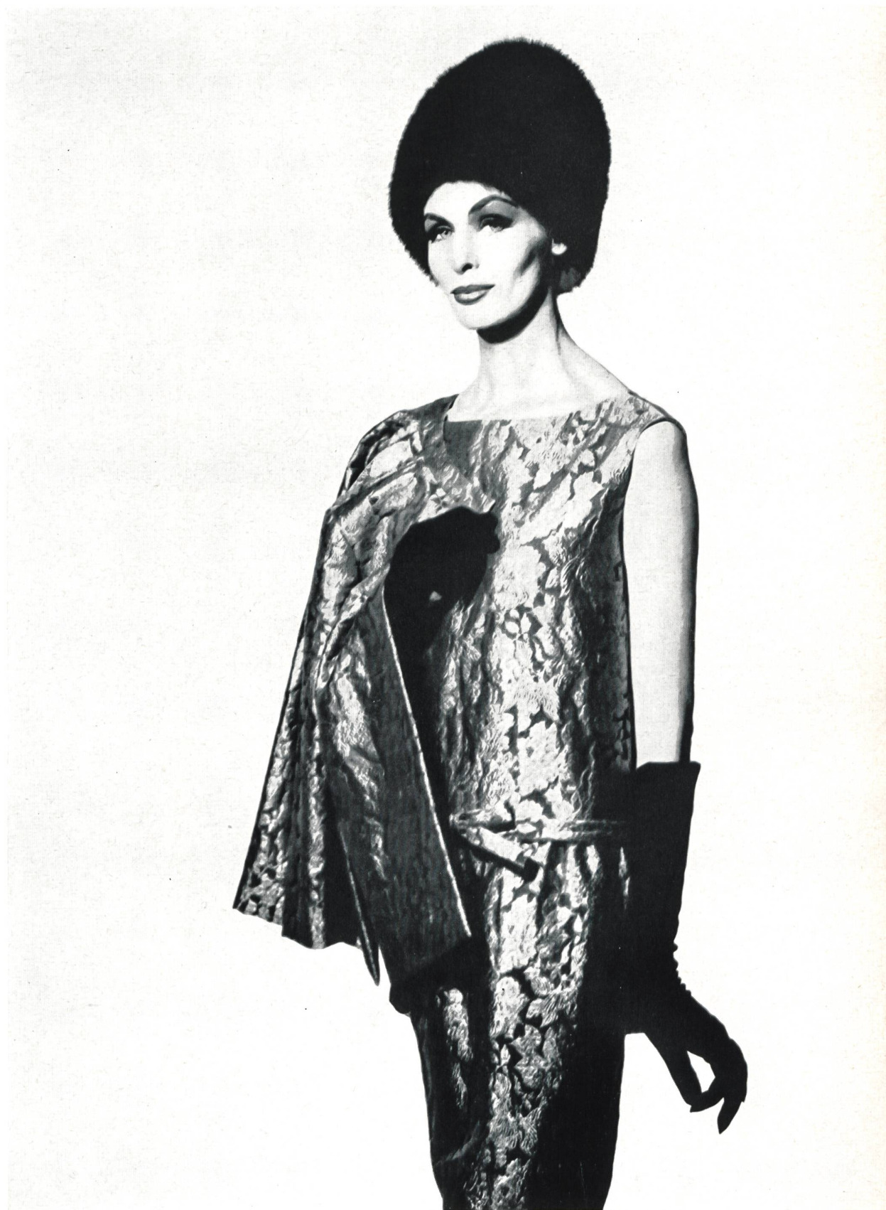
CHRISTIAN DIOR « Aragonne » métal de L. Abraham & Cie, Soieries S. A., Zurich

MODÈLES EXCLUSIFS — REPRODUCTION INTERDITE