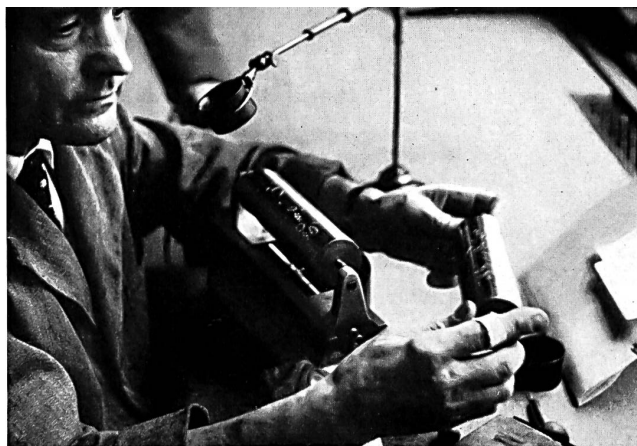
Gravure en vue de l'impression de tissus au rouleau (Cilander A.G., Herisau)

Exposition d'une collection de tissus d'ameublement (J.G. Nef & Co., Herisau)