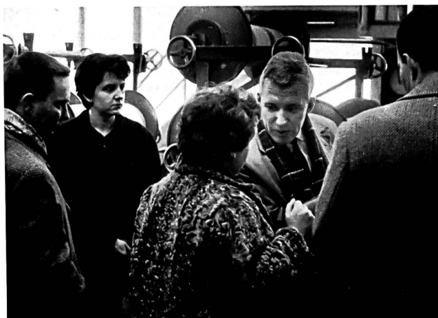
Visite des journalistes dans un tissage de coton (Meyer-Mayor Söhne, Neu St. Johann)