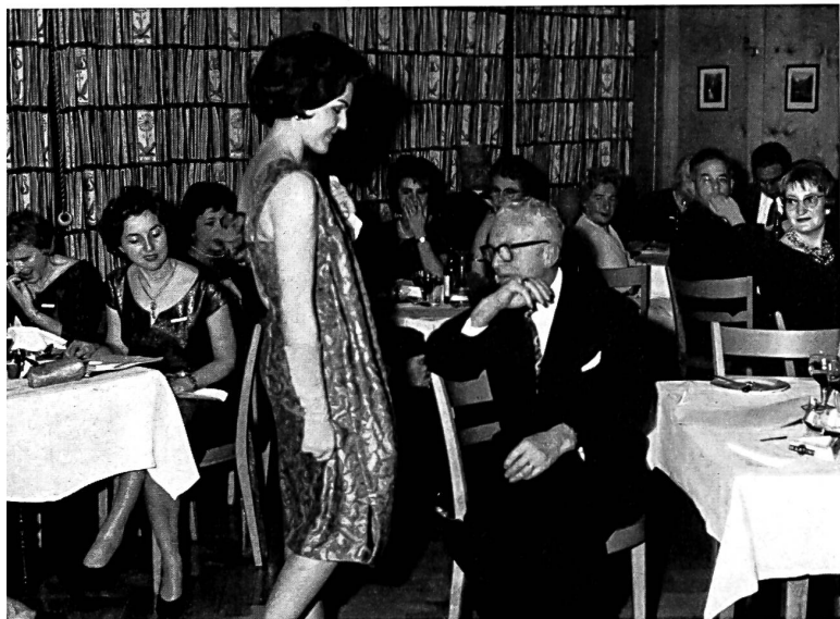
Pendant le défilé

Au mois de février dernier, l'Office de propagande de l'industrie suisse du coton et de la broderie à St-Gall avait organisé, à l'intention de la presse, un voyage de deux jours en Suisse orientale, pour renseigner plus particulièrement les participants sur ce que produit l'industrie textile de Suisse orientale en matière de tissus d'ameublement, de linge de maison, etc. Le programme comportait notamment la visite d'une fabrique de rideaux de tulle, d'une fabrique de meubles rembourrés modernes, d'un établissement de perfectionnement des textiles et tout spécialement de son département «impression» et d'un tissage de tissus en couleurs. En outre, les participants assistèrent à la présentation d'une collection toute récente de tissus pour tentures et pour meubles et virent une exposition de linge de maison tissé en couleurs et une collection de tissus pour rideaux et de linge de lit. Pour terminer, les journalistes présents furent reçus à l'Ecole professionnelle de broderie de la Suisse orientale à St-Gall et eurent l'occasion d'admirer encore une exposition de linge de maison brodé, produit par diverses entreprises de broderie de St-Gall et environs.