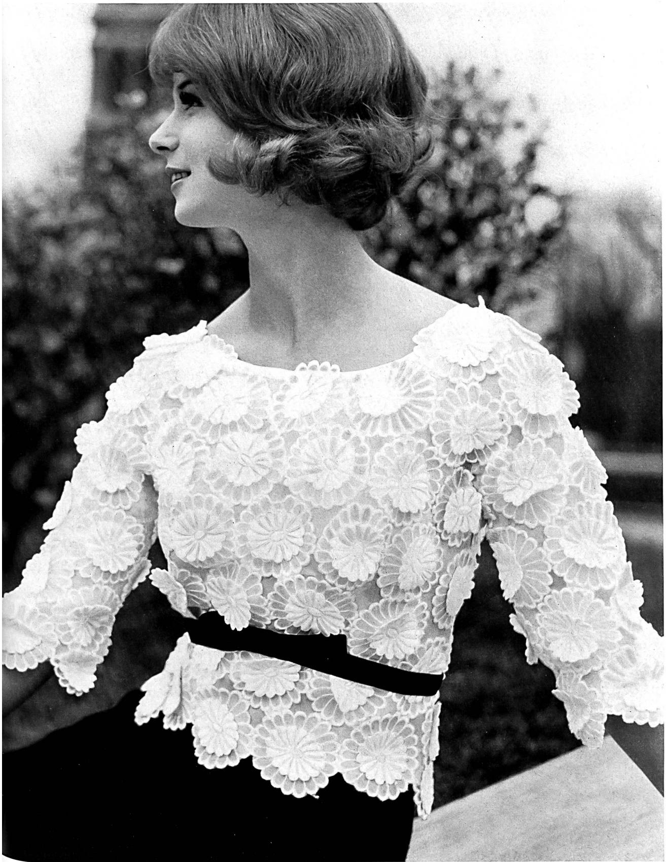
JACQUES HEIM Broderie «Nelo» appliquée sur organdi de J. G. Nef & Co. S. A., Hérissau