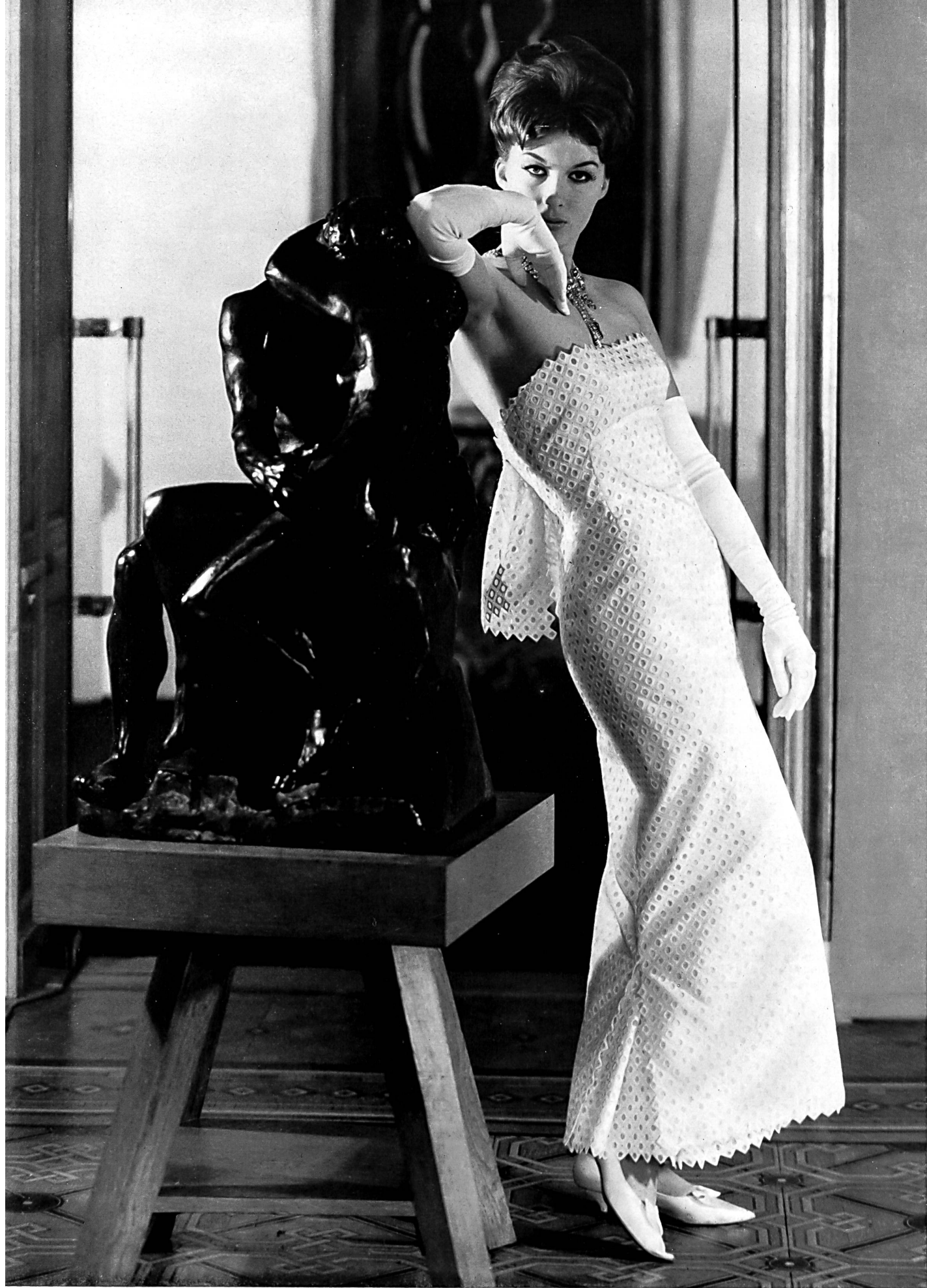
CARVEN Linen brodé de Forster Willi & Co., Saint-Gall Grossiste à Paris: Pierre Brivet S. à r. l.