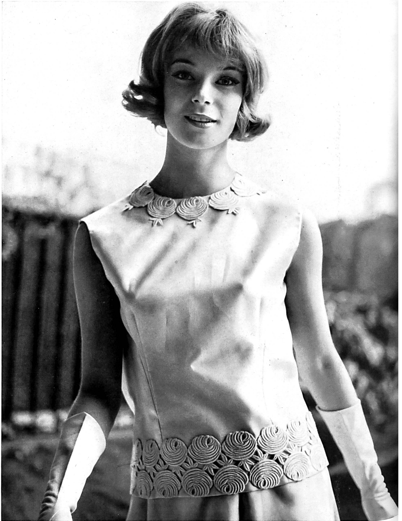
BERNARD SAGARDOY Bande de guipure de Jacob Rohner S. A., Rebstein