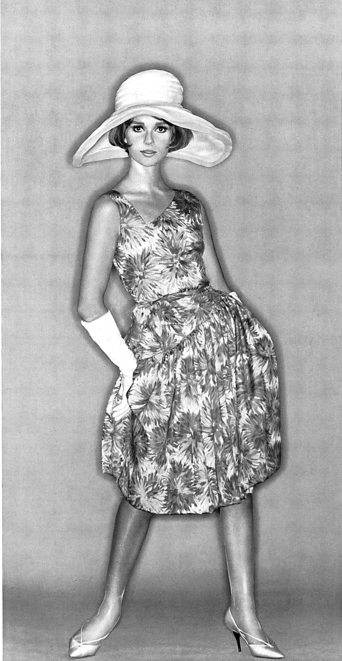
MAGGY ROUFF Tissu pure soie « Manina » de Robt. Schwarzenbach & Co., Thalwil