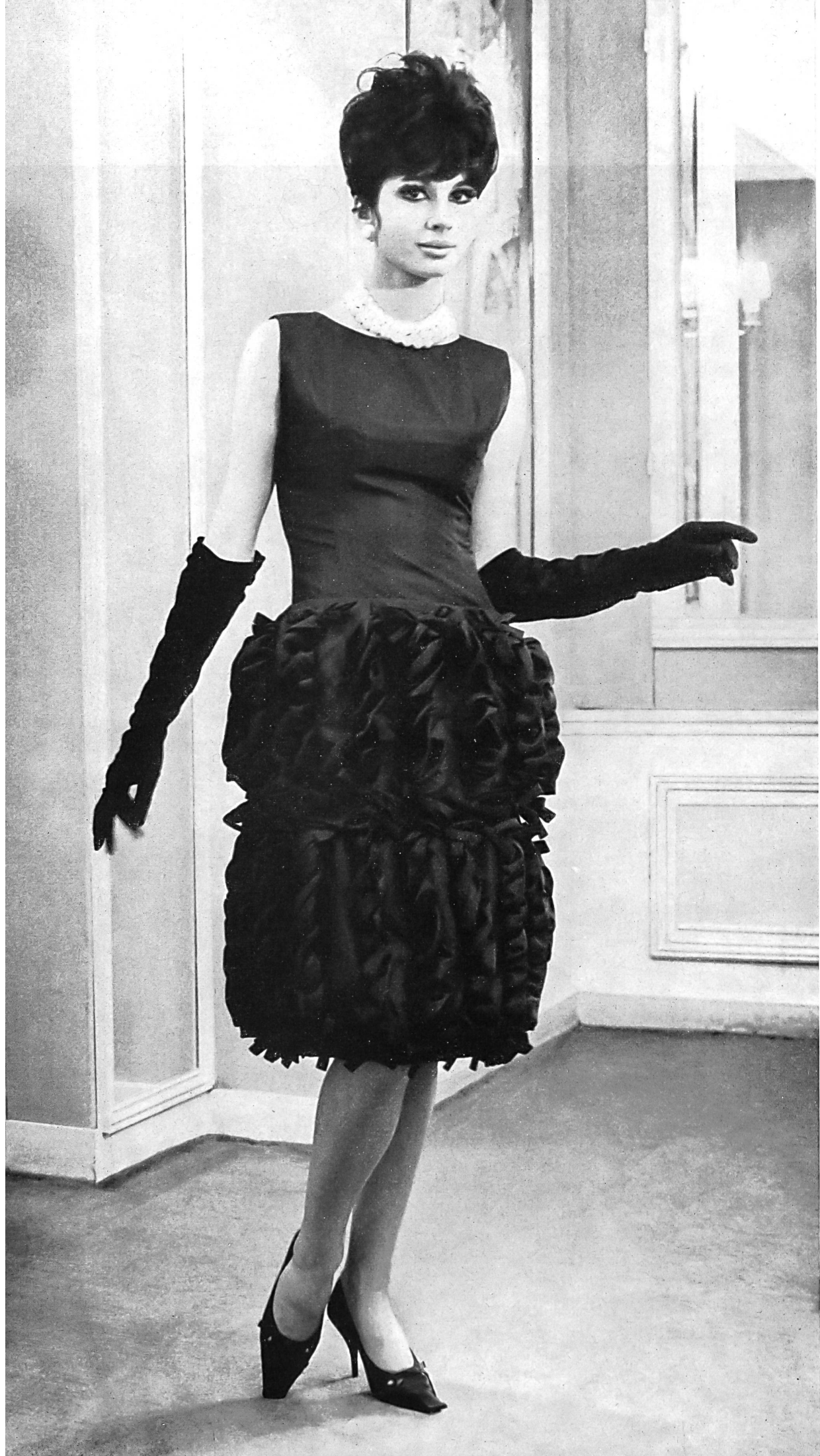
CHRISTIAN DIOR Taffetas de soie de la S. A. Stünzi Fils, Horgen