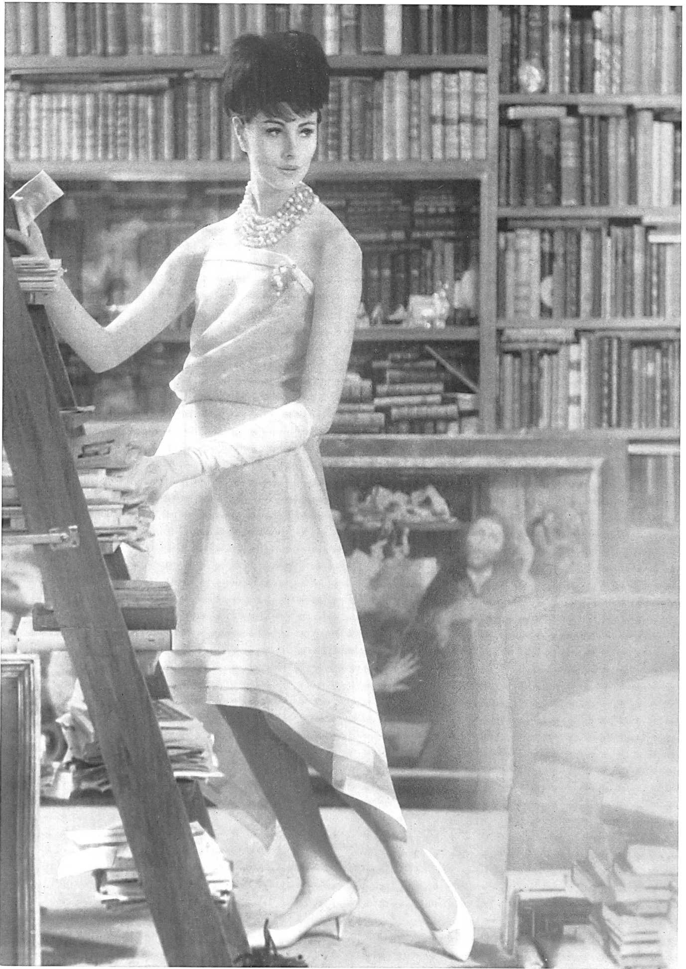
CHRISTIAN DIOR « Basra » de L. Abraham & Cie, Soieries S. A., Zurich