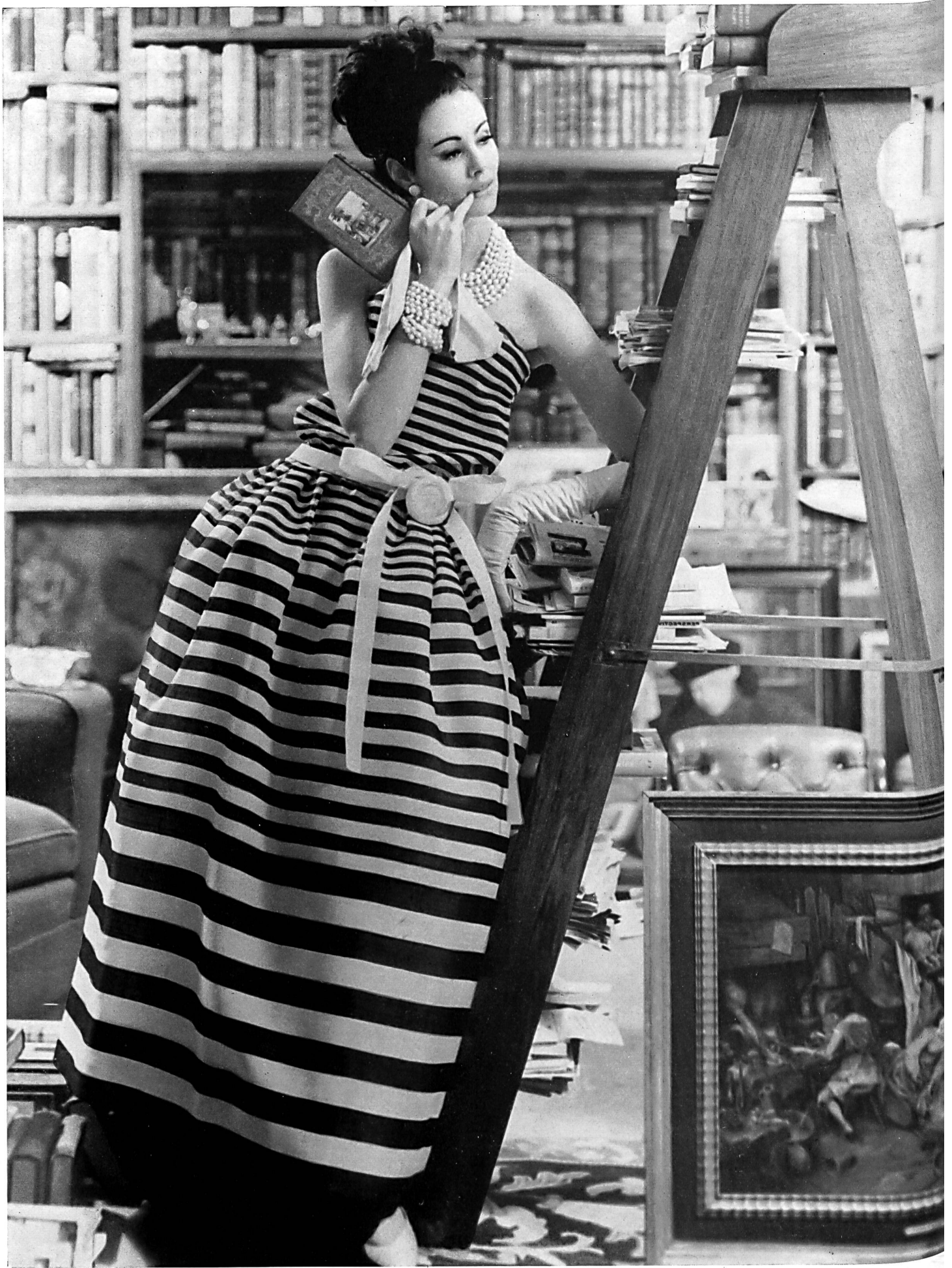
CHRISTIAN DIOR «Gazar» rayé de L. Abraham & Cie, Soieries S. A., Zurich