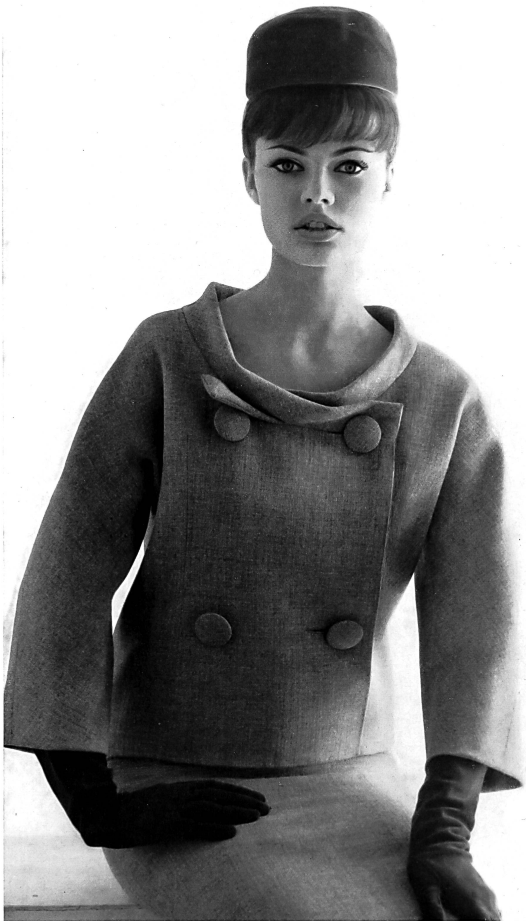
PIERRE CARDIN « Shetty fashion fil » des Tissages de soieries Naef Frères S. A., Zurich