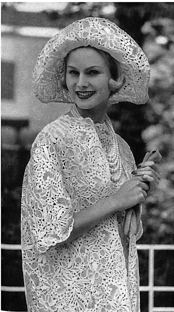
WALTER SCHRANK & CO., SAINT-GALL Guipure ficelle champagne Champagnefarbene Schürliquipure Modèle Toni Schiesser, Francfort s/M.