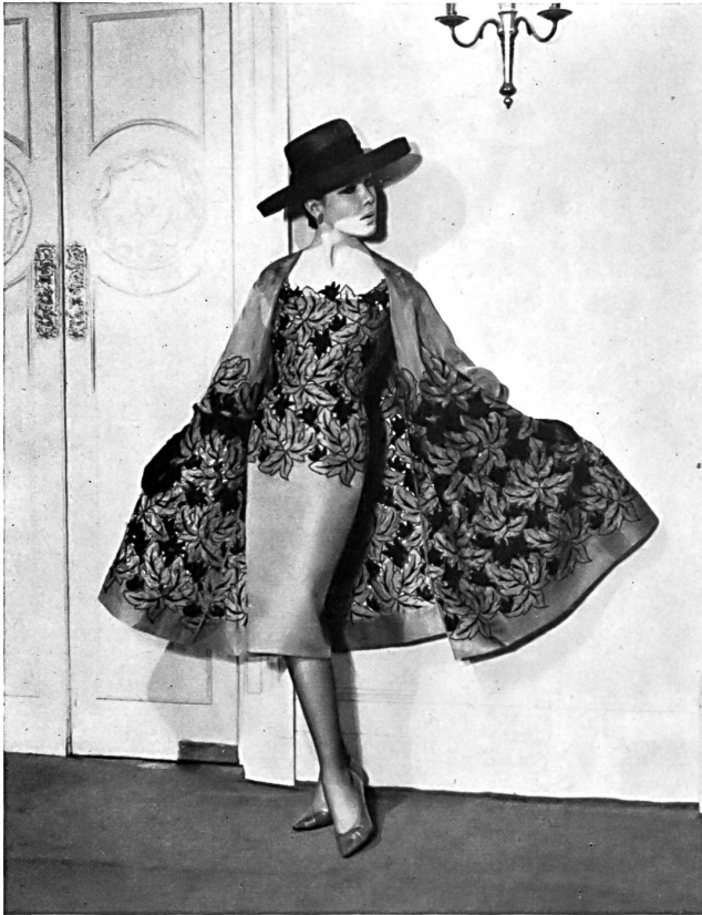
Organdi de soie café avec broderie de soie noire à jour Coffee silk organdie with openwork black silk embroidery Modèle Lachasse, Londres