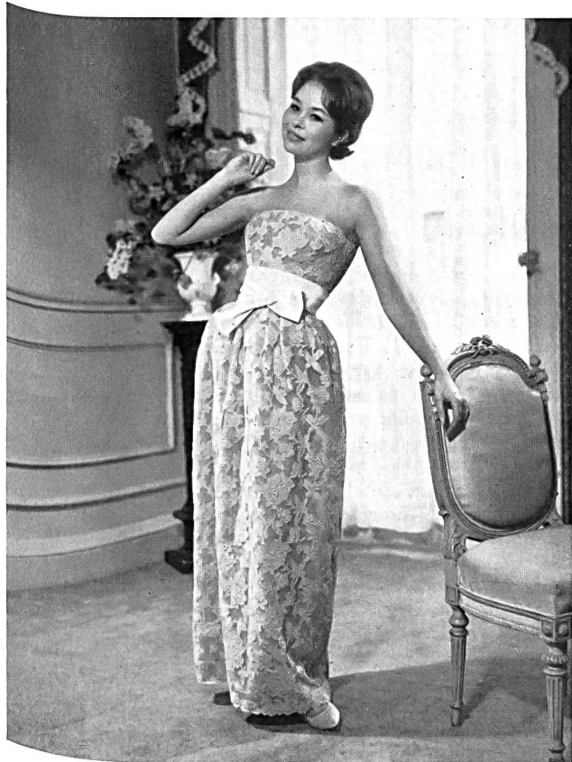
Broderie lin sur tulle Linen embroidered tulle Modèle Ronald Paterson, Londres