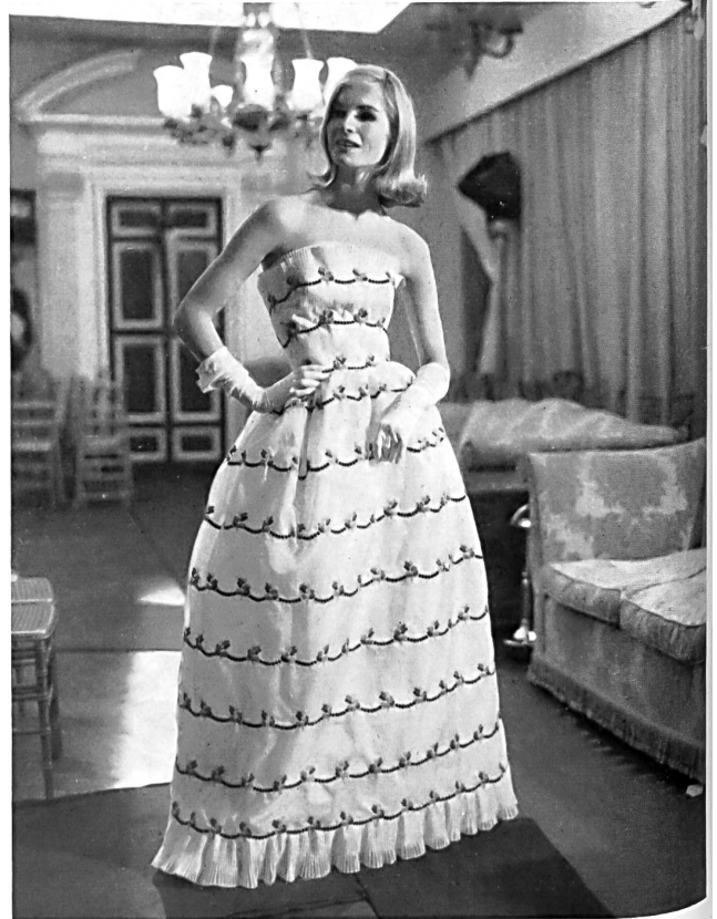
Organdi de soie blanc avec broderie multicolore Multicolor embroidered white silk organdie Modèle Belinda Belville, Londres