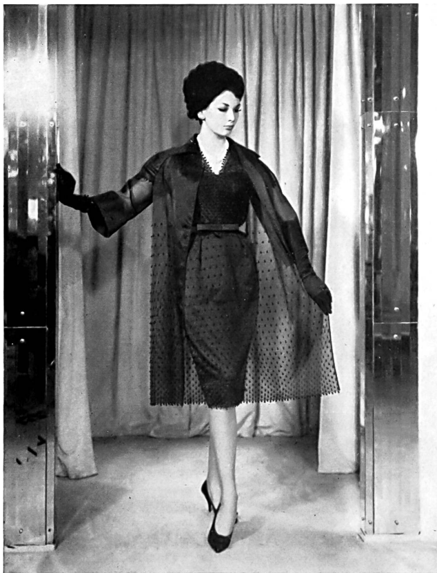
Organdi de soie bleu marine brodé de pois en relief Navy blue silk organdie with embroidered raised spots Modèle Norman Hartnell, Londres