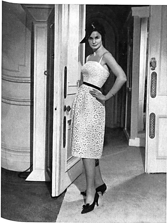
Coton brodé crème Cream embroidered cotton Modèle John Cavanagh, Londres