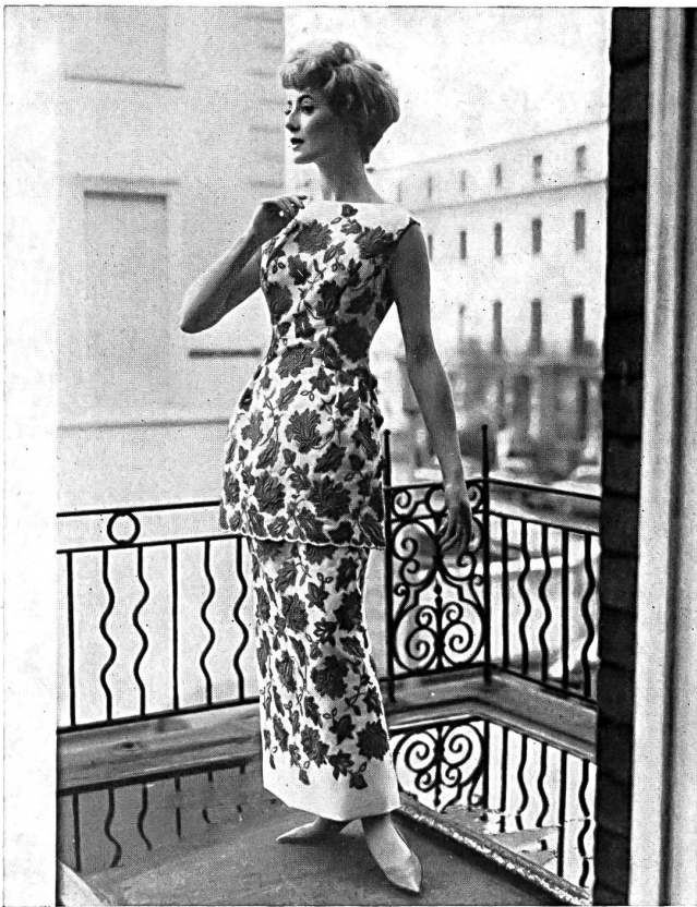
Organdi de soie brodé en blanc et rouge White and red embroidered silk organza Modèle Mattli, Londres