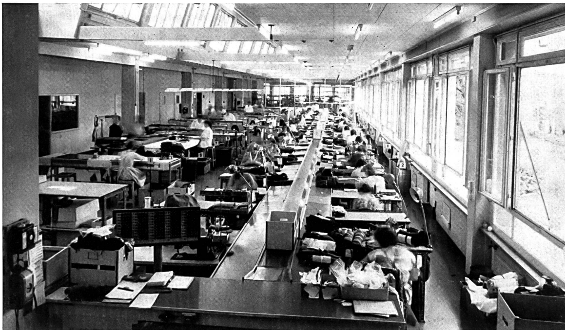
Ateliers de couture avec dispositif moderne pour une répartition rationnelle du travail (pas de travail à la chaîne)

artiste au goût raffiné, présente les possibilités artistiques et le succès commercial de la technique Jacquard appliquée à l'industrie de la maille et qu'il trouve un constructeur de machines compréhensif, pour que soit réalisé un accessoire important des machines à tricoter, qui est à la base de l'essor du Jacquard dans l'industrie du tricotage.