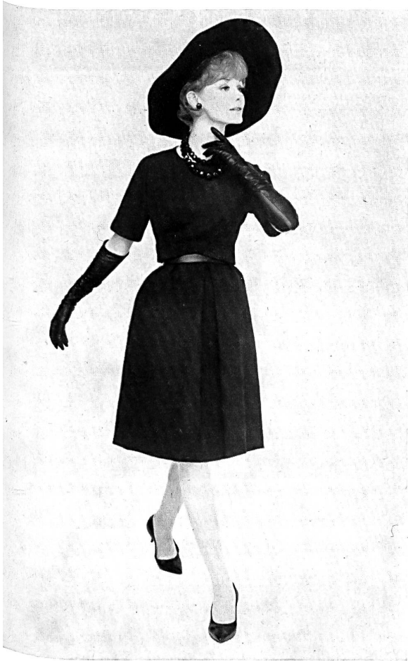
Tissu de coton noir de Saint-Gall Modèle Teal Traina, New York