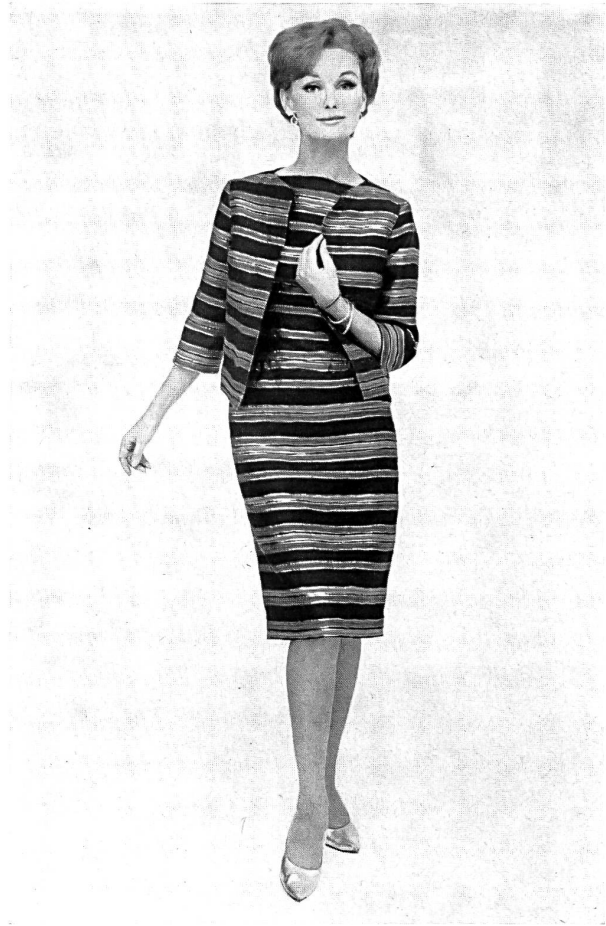
Bijoux: Cartier, New York

Les tissus suisses de coton ne sont plus réservés exclusivement aux saisons et aux climats chauds. Ils sont aussi très appréciés, aux Etats-Unis, pour des modes d'automne de jour et du soir, comme en font foi ces trois documents :