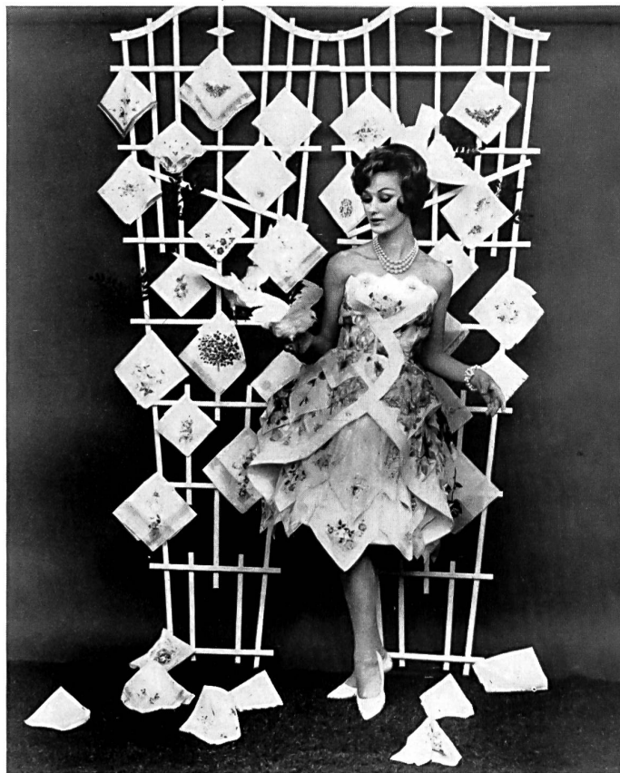
Création Anny Couture, Bâle réalisée au moyen de 100 mouchoirs

Robes réalisées en mouchoirs de Saint-Gall imprimés, brodés ou bordés de dentelle, qui sont présentées dans les grands magasins étatsuniens à l'occasion de campagnes en faveur de ces articles.