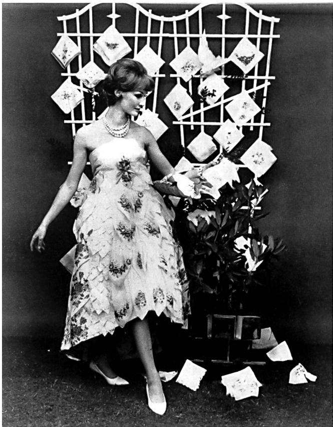
Création Marianne Couture, Saint-Gall réalisée au moyen de 120 mouchoirs