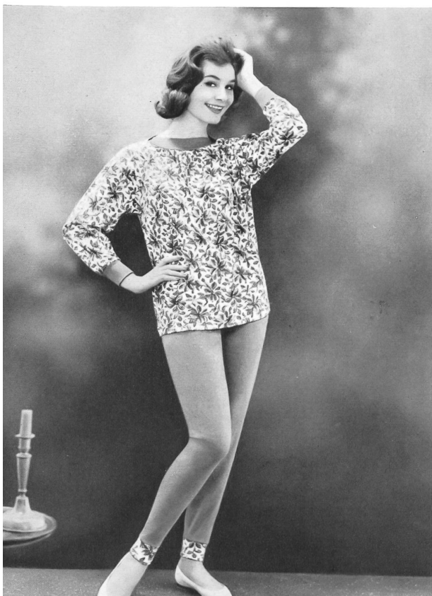
« SAWACO », S.A. W. ACHTNICH & CO., WINTERTHOUR

Les commerçants achetèrent surtout des produits mode et de haute qualité de l'industrie de la lingerie et du corset. Il y eut une forte demande pour les sous-vêtements mode, les « combi-slips », les vêtements de nuit, la lingerie en matières nouvelles et en coloris inédits. En corsets, les commandes allèrent principalement aux articles qui présentaient des caractéristiques nouvelles et dans la ligne de la mode en matière de coloris, de coupe et d'exécution. A part le blanc, couleur dominante, beaucoup de commandes vont aux corsets noirs ainsi qu'aux écossais peu appuyés. Au cours du défilé international de mode, qui eut lieu dix fois en tout au cours des trois jours que dura la foire, ce furent environ quatre-vingts modèles de lingerie et de corsets qui furent présentés.