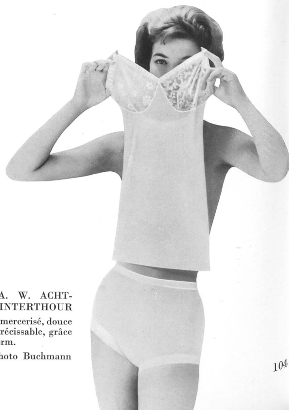
« SAWACO », S.A. W. ACHTNICH & CO., WINTERTHOUR Parure en fil retors mercerisé, douce au toucher et irrétrécissable, grâce au finissage Fixform.