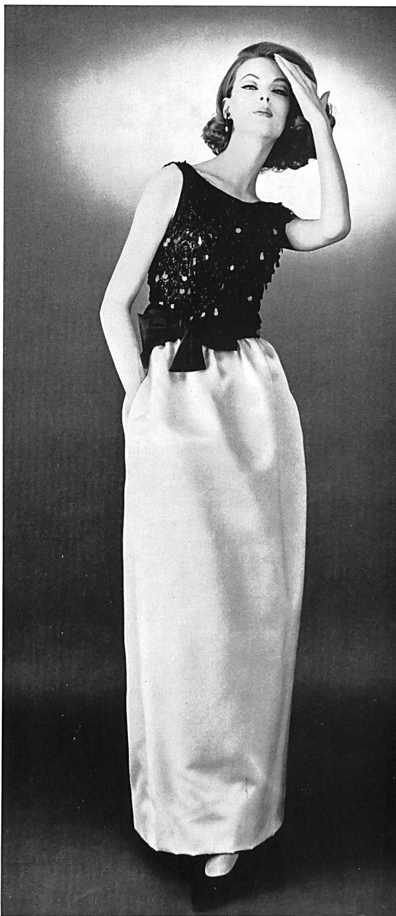
L. ABRAHAM & CO. SILKS LTD., ZURICH Satin orange (jupe / skirt) Modèle Elizabeth Arden

Et la ligne elle-même, qui paraît simple à un observateur superficiel, se rapproche de la simplicité décrite par un grand écrivain: « Le style simple est comme la lumière blanche; il est complexe, mais sa complexité n'est pas apparente. » Dans la couture de cette saison, les coupes