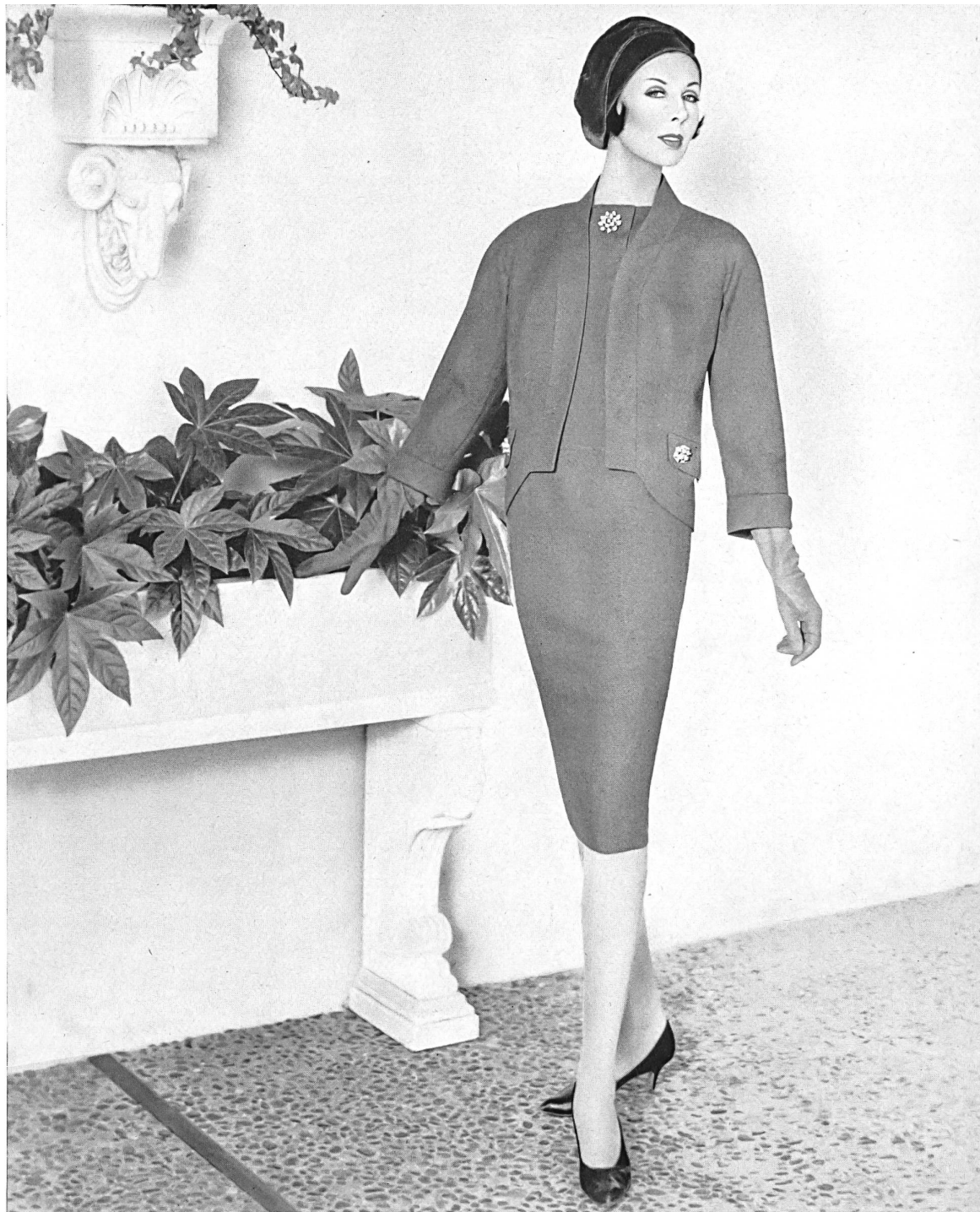
HEER & CO. S.A., THALWIL Schantung natté pure soie Natte schantung (100 % Silk) Modèle Helen Rose, Los Angeles

dans des tissus remarquables, offerts en gros entre 29,75 et plusieurs milliers de dollars, chacun d'eux pouvant être acheté en magasin sans que la cliente ait à se soumettre à l'ennui d'interminables essayages.