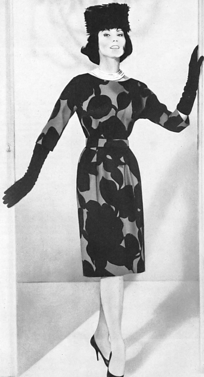
L. ABRAHAM & CO. SILKS LTD., ZURICH « Charlus » lainage imprimé « Charlus » printed wool fabric Modèle Helga, Los Angeles

considère comme inexact. Nous sommes entièrement d'accord avec lui lorsqu'il appelle ses collègues de Californie des « dessinateurs-fabricants de robes ». Chacun possède certains tours de main, comme on a pu le constater clairement lors des récentes présentations pour les modes de villégiature et de printemps. On a pu voir, à cette occasion, une abondance de modèles captivants réalisés