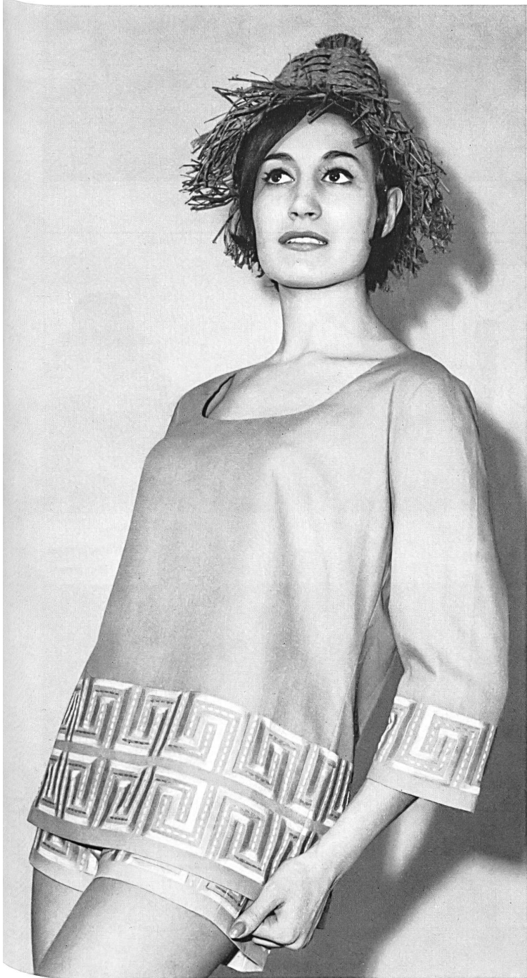
« RECO », REICHENBACH & CO. S. A., SAINT-GALL Batiste « Minicare » brodée / embroidered / bordada / bestickt Modèle Créations Alphée, Alassio