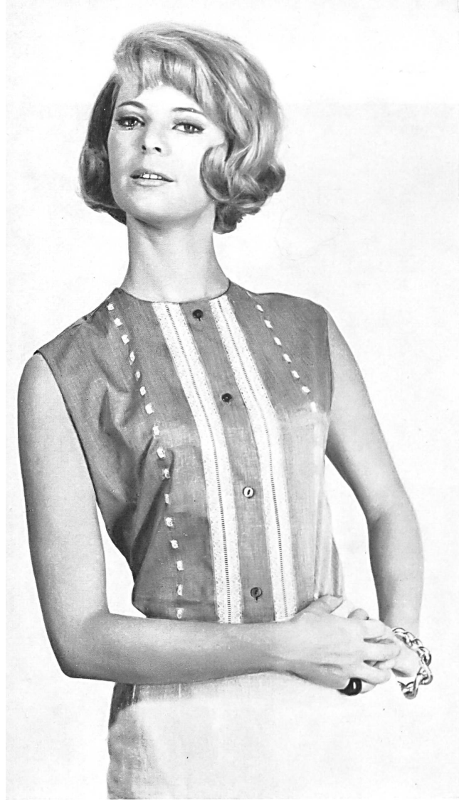
◀ «RECO», REICHENBACH & CO. S. A., SAINT-GALL Chambrai brodé / embroidered / bor- dado / bestickt Modèle Matisse Blouse Co., Londres