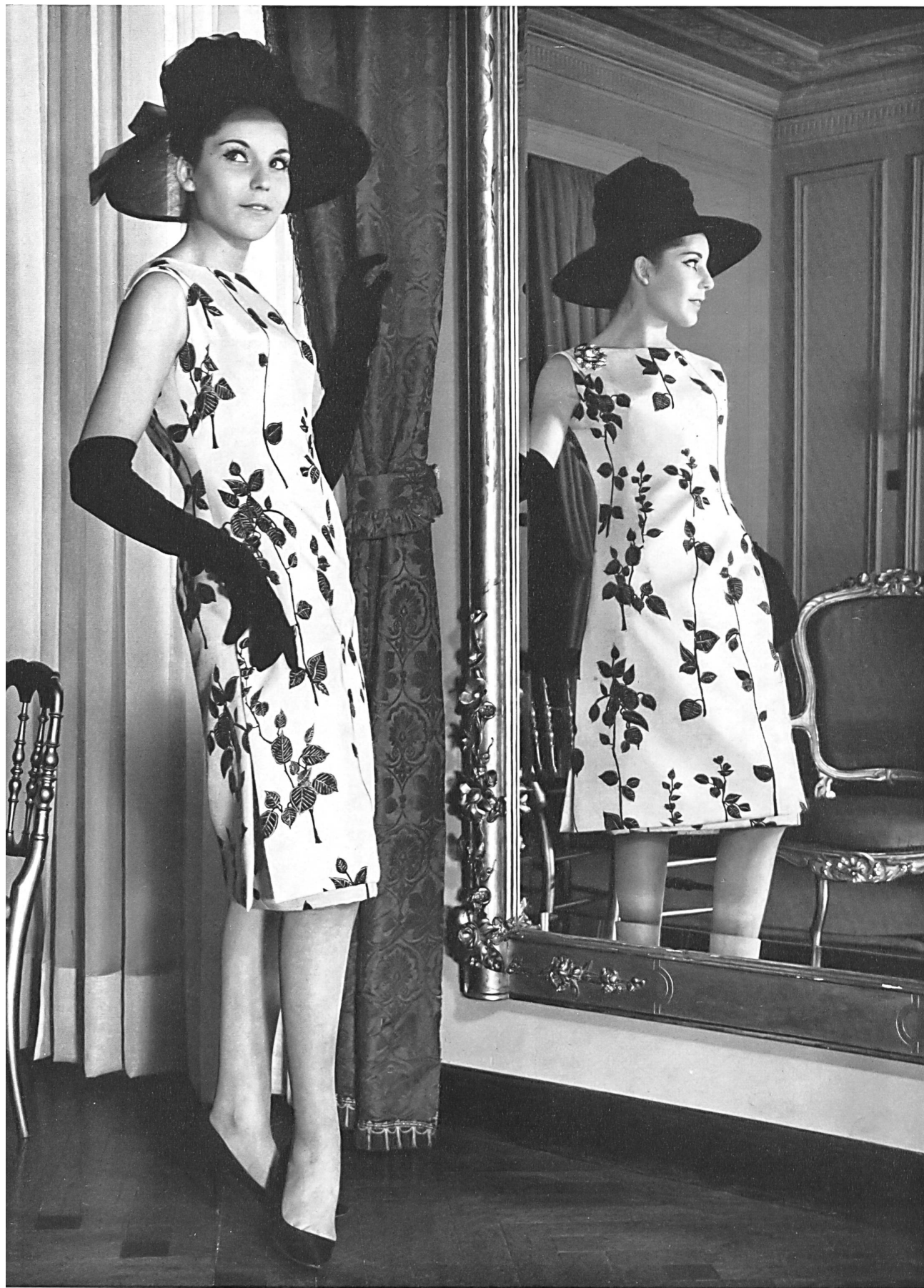
« rbc », RUDOLF BRAUCHBAR & CIE S. A., ZURICH « Amirante » — Tissu imprimé pure soie — Printed pure silk fabric — Tejido estampado de pura seda — Bedrucktes, reinseidenes Gewebe Modèle El Dique Flotante, Barcelone