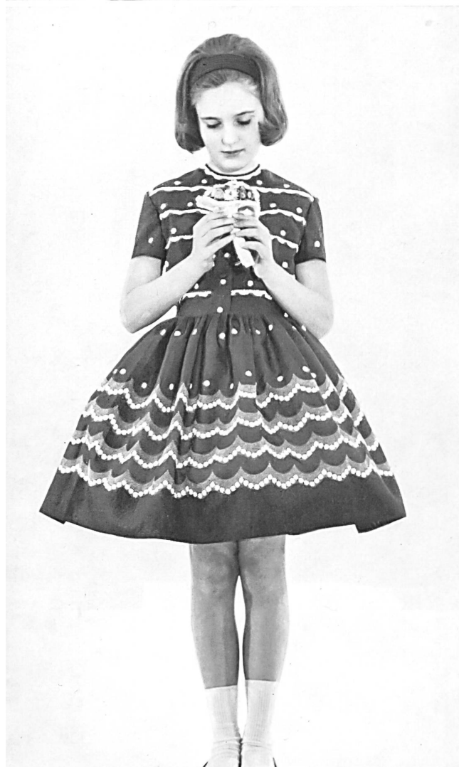
«RECO», REICHENBACH & CO. S. A., SAINT-GALL Batiste « Minicare » brodée / embroidered / bordada / bestickt Modèles Marie-Noelle, Milan