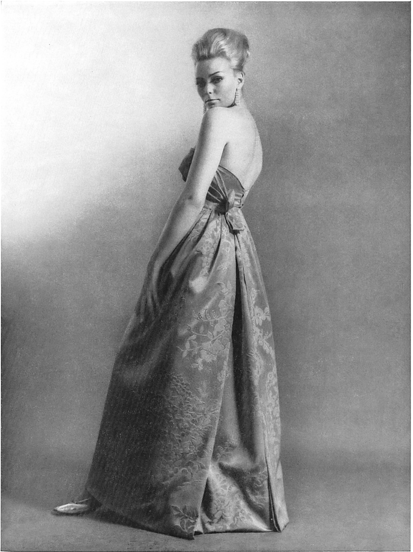
MAISON GACK, ZURICH