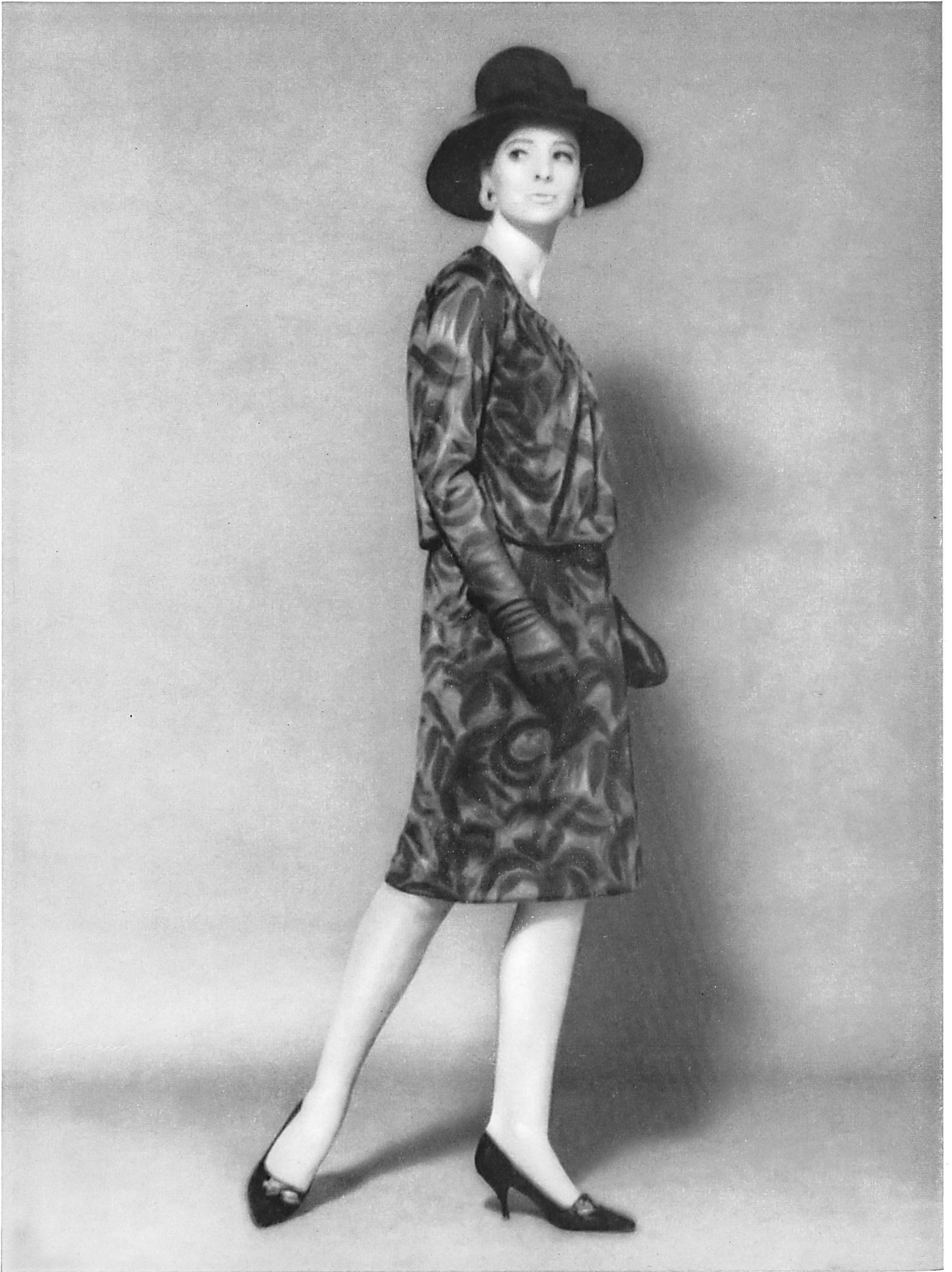
MAISON GACK, ZURICH