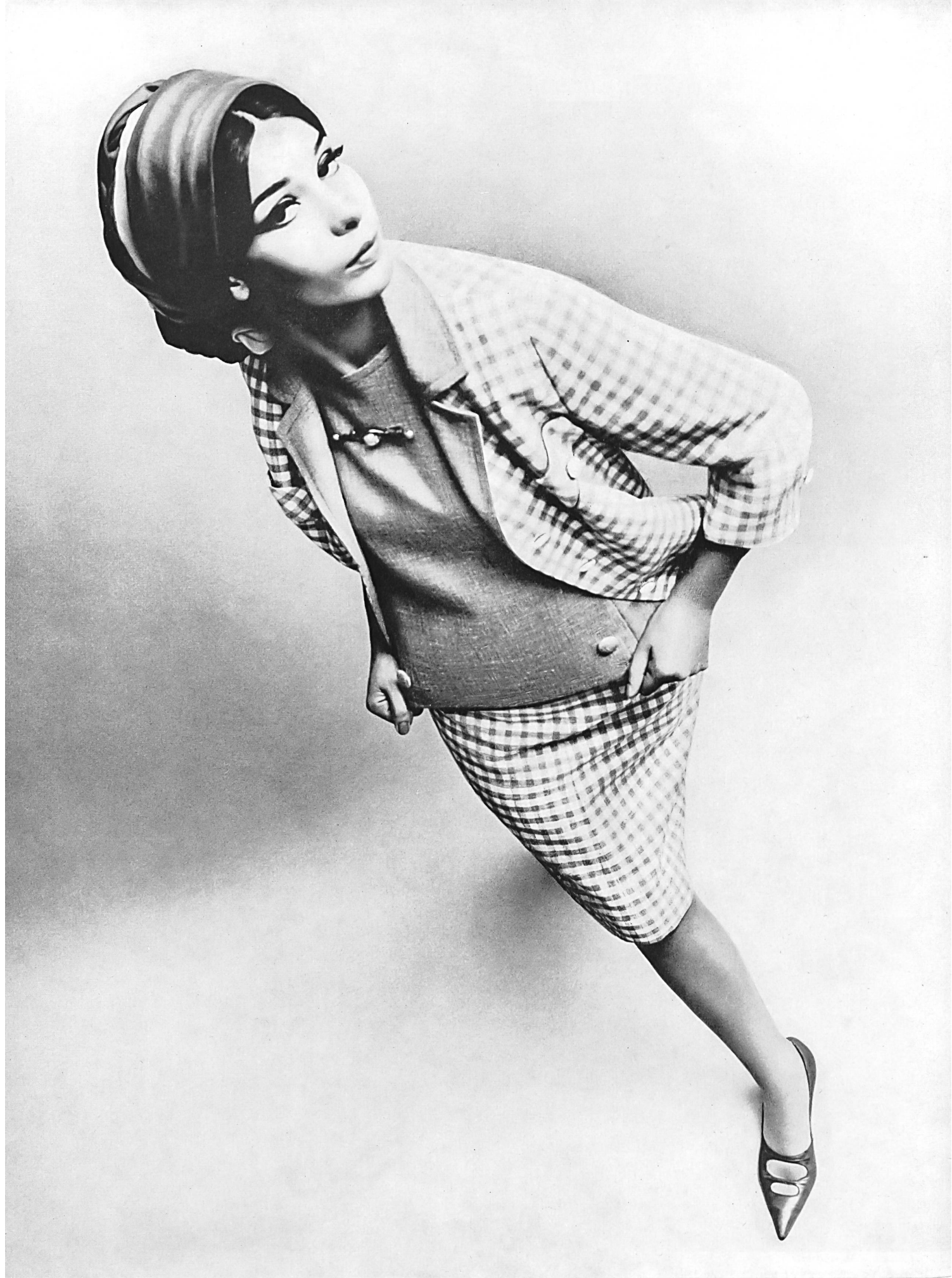
GERSTLE & CO. S.A., ZURICH