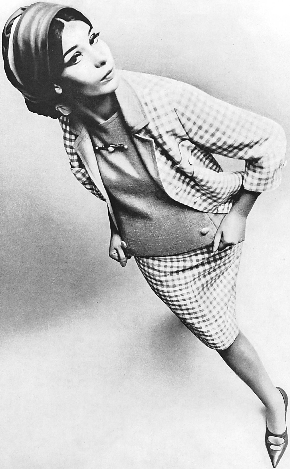
GERSTLE & CO. S.A., ZURICH