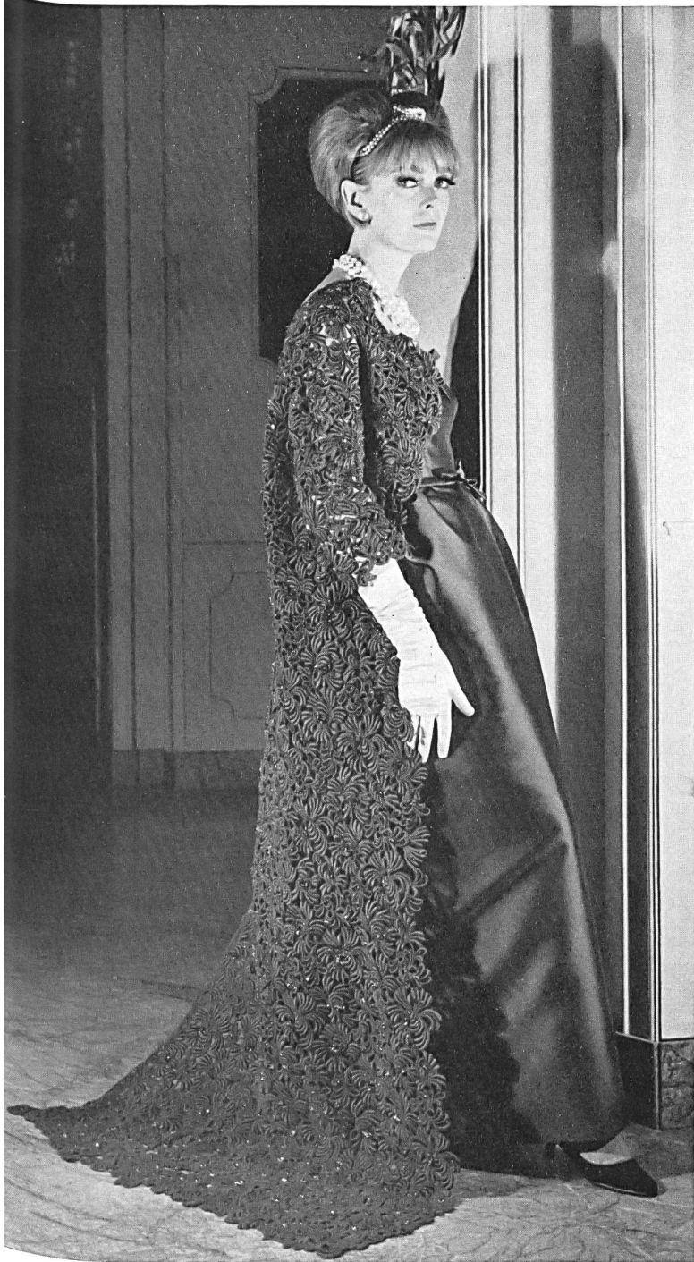
UNION S. A., SAINT-GALL Riche broderie guipure verte Rich green etched embroidery Rico encaje guipur verde Kostbare grüne Guipure-Stickerei Modèle Bicki, Milan