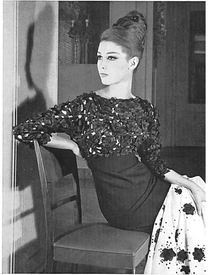
Corsage en broderie découpée verte de Saint-Gall avec appli- cations; les mêmes motifs découpés sont appliqués sur l'étole Bodice in green St. Gall cut-out embroidery with appliqué work; the same cut-out patterns are applied on the stole Corpino de encaje suizo recortado verde, con aplicaciones; los mismos dibujos recortados, aplicados sobre una estola Bolero aus St. Galler Spachtelspitze mit Applikationen; die gleichen ausgeschnittenen Muster sind auf der Stola appliziert Modèle Emilio Schuberth, Rome