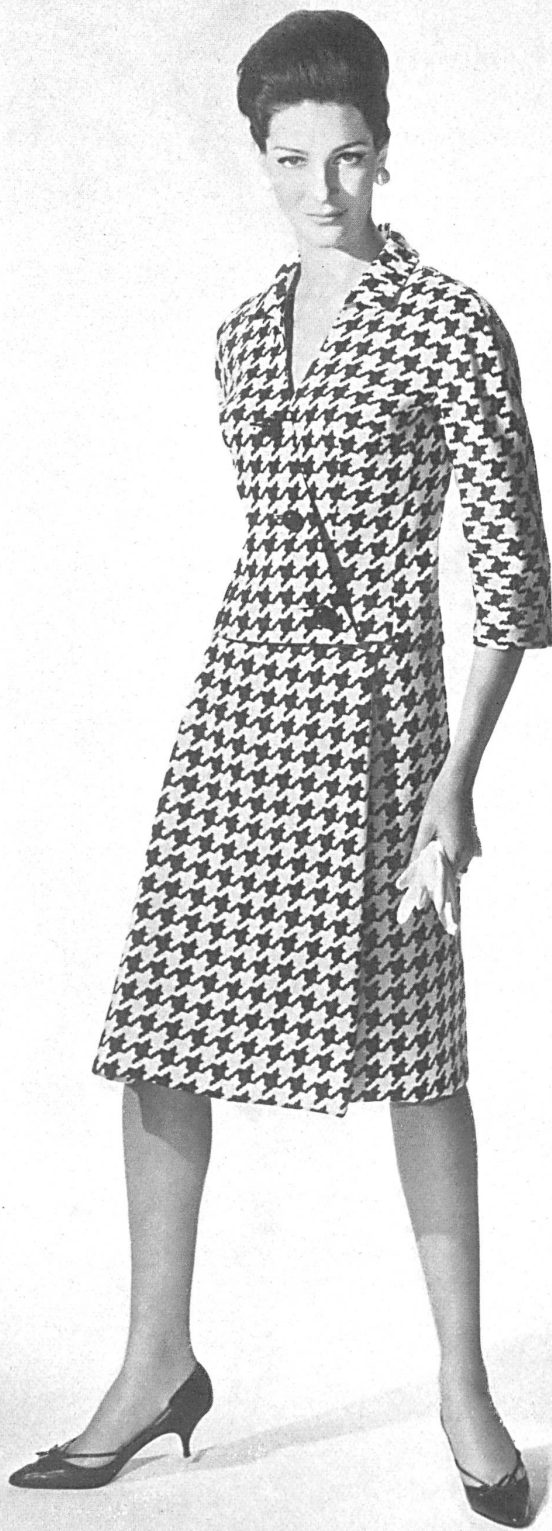
METTLER & CIE S.A., SAINT-GALL Tissu fibranne imitation lin imprimé Printed linen imitation staple fibre fabric Modèle Helga, Los Angeles

la façon « beatnik » de mettre en œuvre une élégante broderie chenille de Forster Willi.