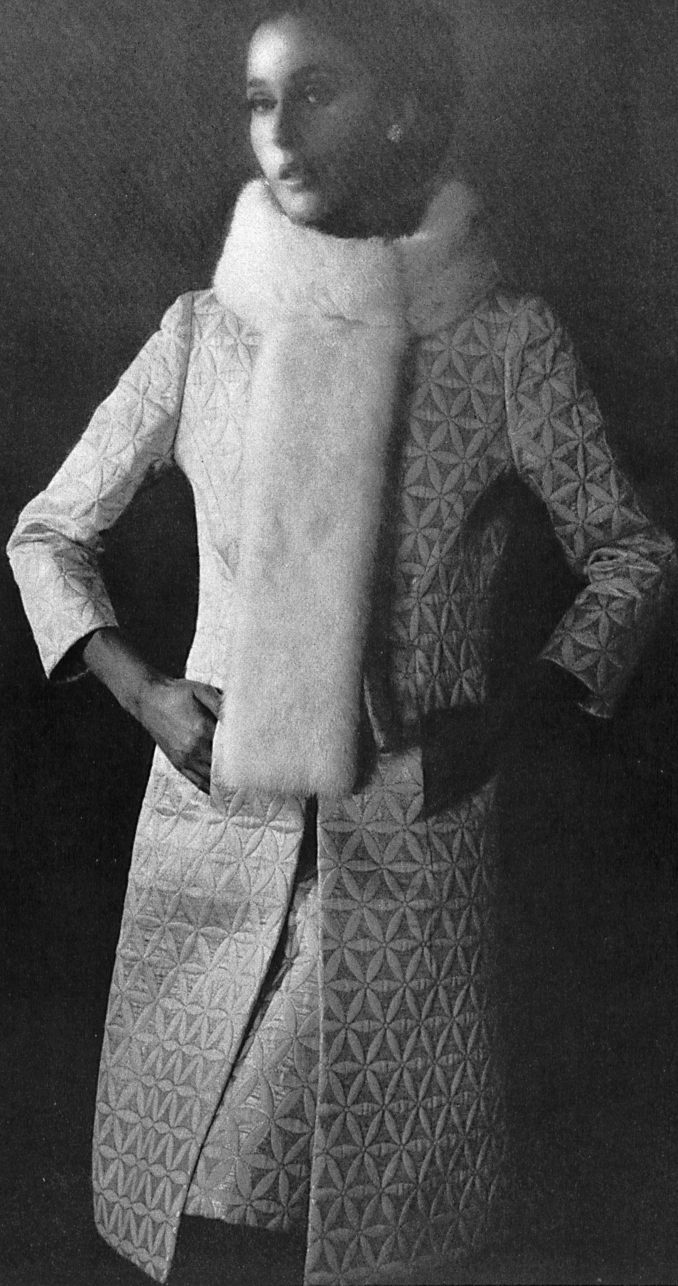
JEAN PATOU Matelassé blanc et argent «Zorro» de L. Abraham & Cie, Soieries S.A., Zurich