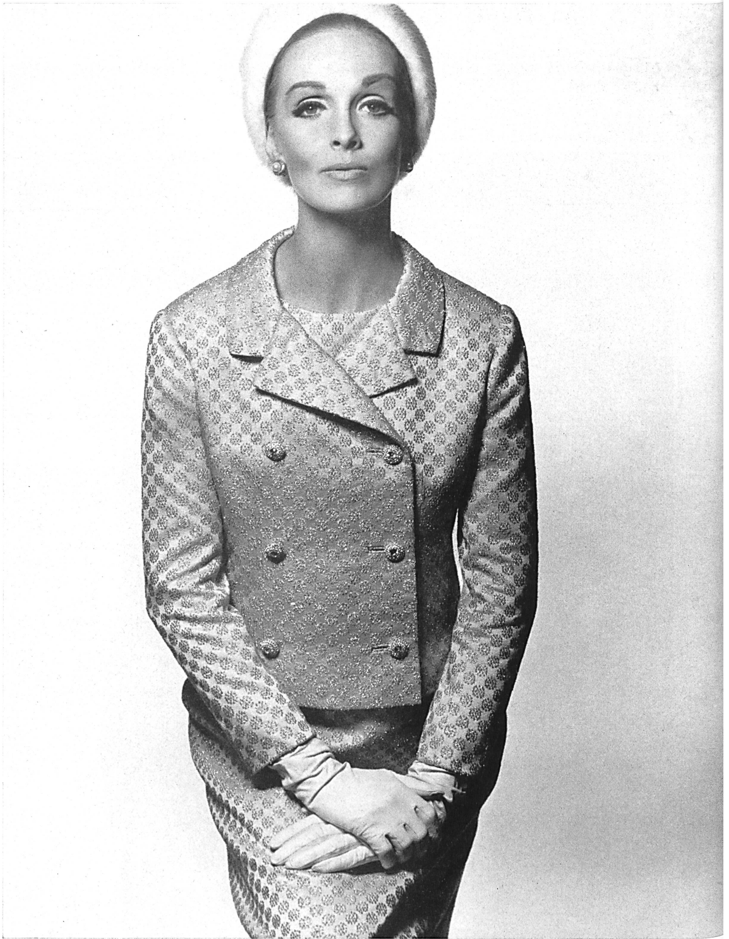
NINA RICCI Satin broché «Perle» de L. Abraham & Cie, Soieries S. A., Zurich