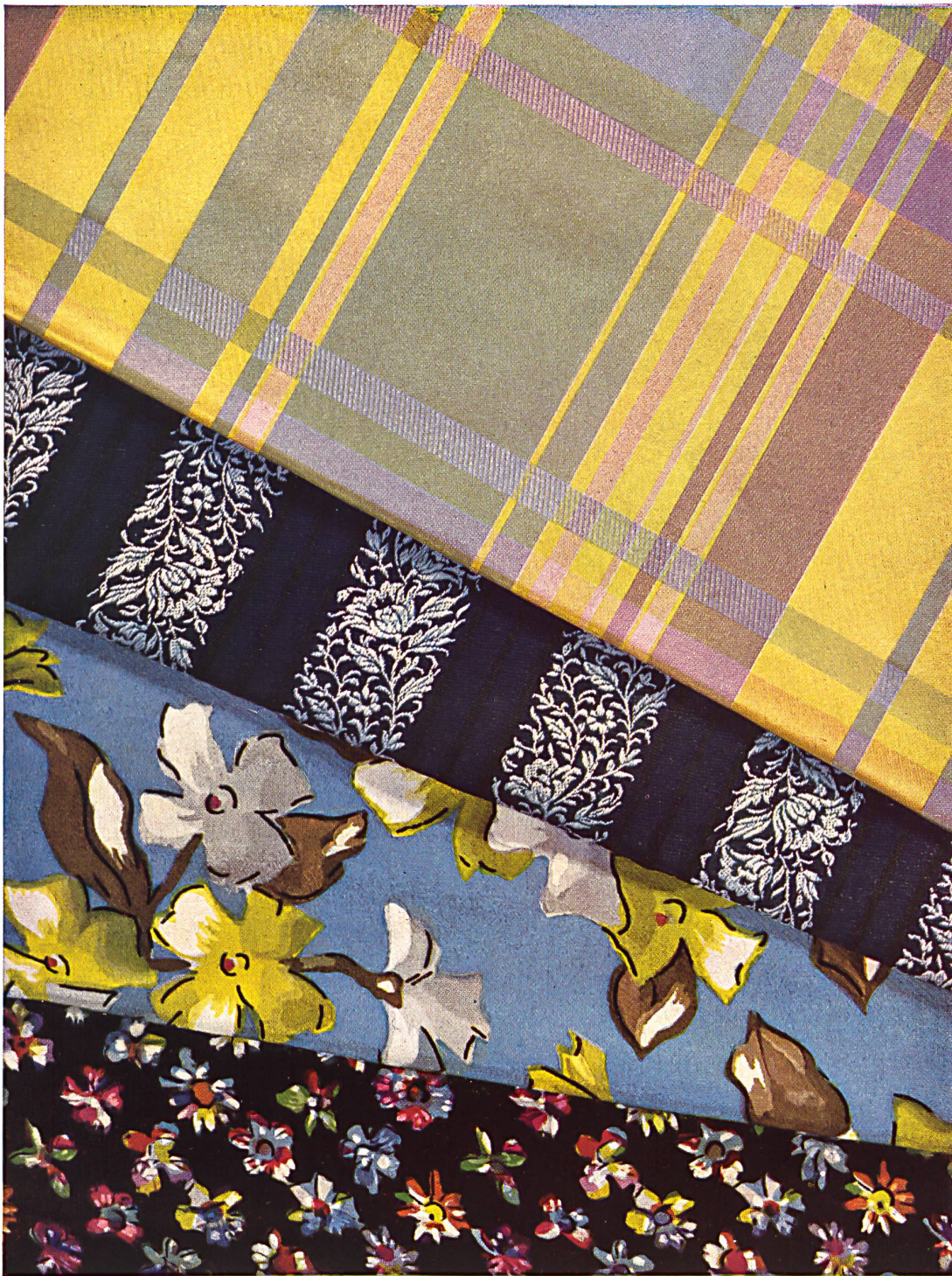
Taffetas checks, Façonné striped and Printed Crêpe de Chine. Created by Robt. Schwarzenbach & Co., Thalw

The novel materials for men's ties, now being used by the « Haute Couture » to make dressing-gowns and most elegant blouses, remain most distinctive for their outstanding qualities in the ranks of Swiss articles.