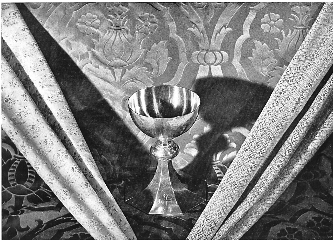
Ecclesiastical fabrics Presented by the Swiss Silk Manufacturers' Association, Zurich.

The silks of Zurich pride themselves on an international reputation of long-standing and continue to maintain their position admirably in spite of much competition from foreign markets. That position is indeed assured, thanks to the renown won by the importance and variety of the collections in that branch of Swiss industries. Thus a technique acquired by long research and an experience gained by long years of tireless endeavour allow Swiss industrials to produce, in addition to the classic and usual materials, special fabrics most difficult to obtain elsewhere.