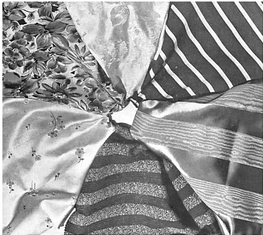
Dress Silks Presented by the Swiss Silk Manufacturers' Association, Zurich.

Emphasising the wide-spread popularity of Swiss silk goods, we may state that thousands of new models have been launched on the international markets to the general satisfaction of the clientèle in the great world centres of the « Haute Couture ». There is no kind of silk material, from the simplest lining to the richest brocade, that is not made in Switzerland. Silks and rayons, of the most