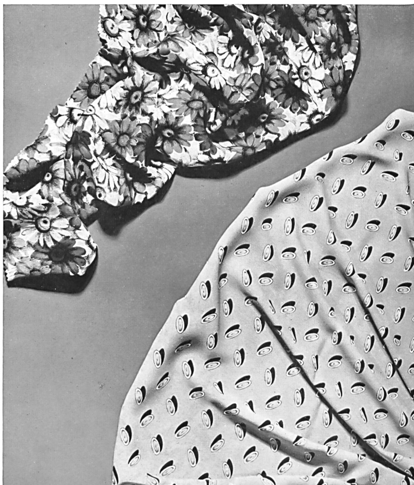
Dress Silks Created by Siber & Wehrli Ltd., Zurich Photo Bauty.

In a production so abundant in fabrics for dresses, let us cite the high qualities of dyed yarns, chinés, jacquards, beautiful impressions on woven fabrics, taffetas, ombrés and the new moirés in stripes or waves.