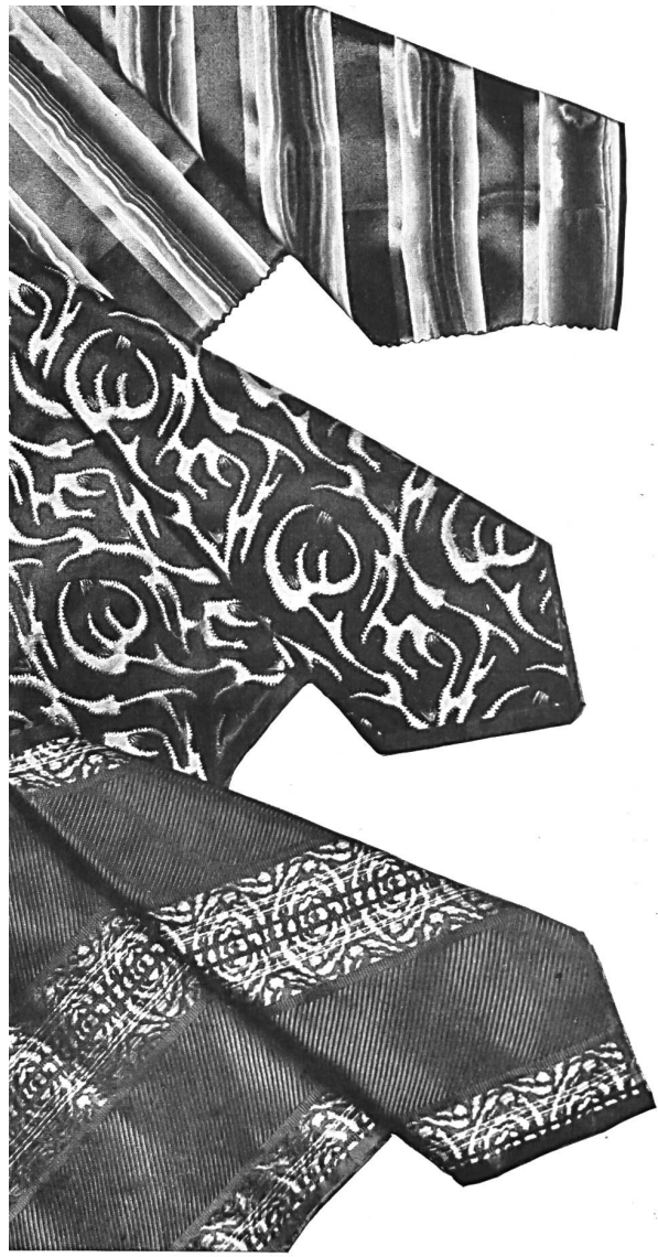
Tie Silks Created by Siber & Wehrli Ltd., Zurich.