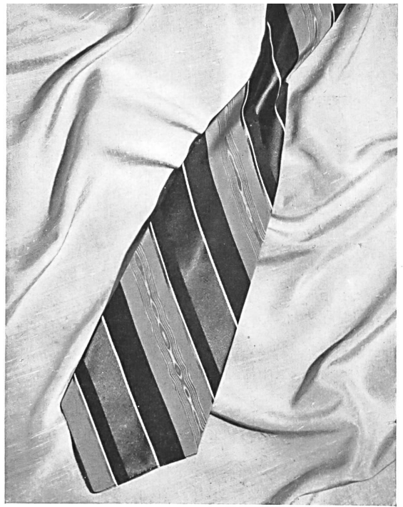
Necktie Created by W. Haus & Co., Zurich.

Swiss silk firms are continually augmenting their creations and have the qualities of being able to adapt themselves to the constant and requisite changes of Fashion. In spite of the formidable concurrence of large countries, Switzerland is forging ahead by the acknowledged superiority of her articles and their commercial value.