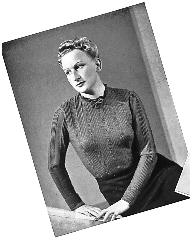
Pullover by J. F. Rohrer-Bolliger, Romanshorn