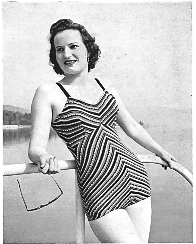
Swim suit, by Ltd. Company formerly W. Achtnich & Co., Winterthur.

Underclothing of all kinds whether in silk, wool, or in silk and wool and cotton, are both supple and hard-wearing and continue to receive high praise.