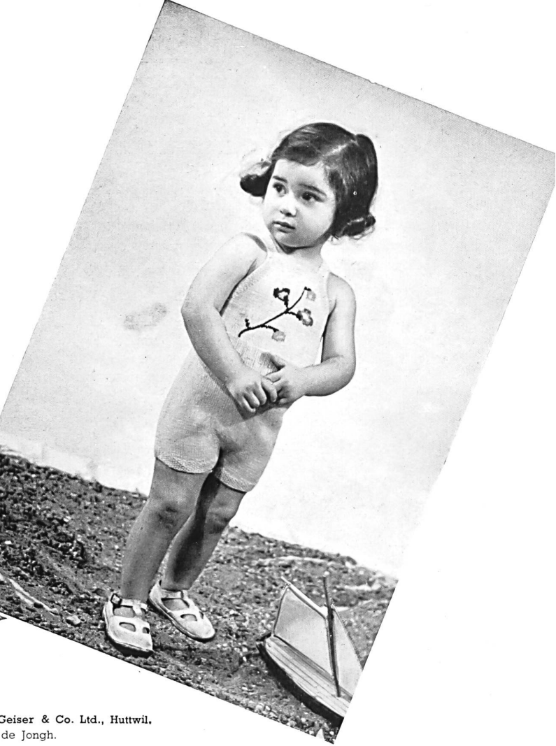
Child's Swim Suits by Geiser & Co. Ltd., Huttwil.