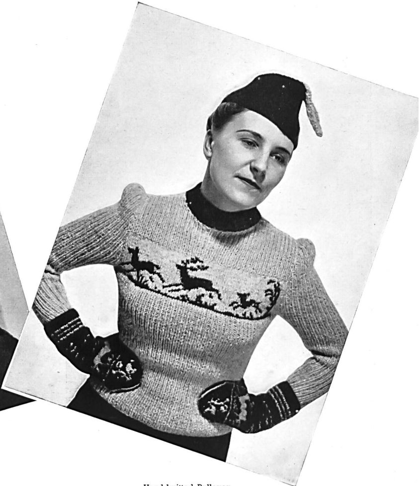
Hand-knitted Pullover by J. Holtz, Lucerne.