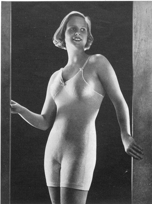
Buser & Keiser & Co. Ltd., Laufenburg.

Lingerie — Ropa interior — Sous-vêtement — Roupa interior