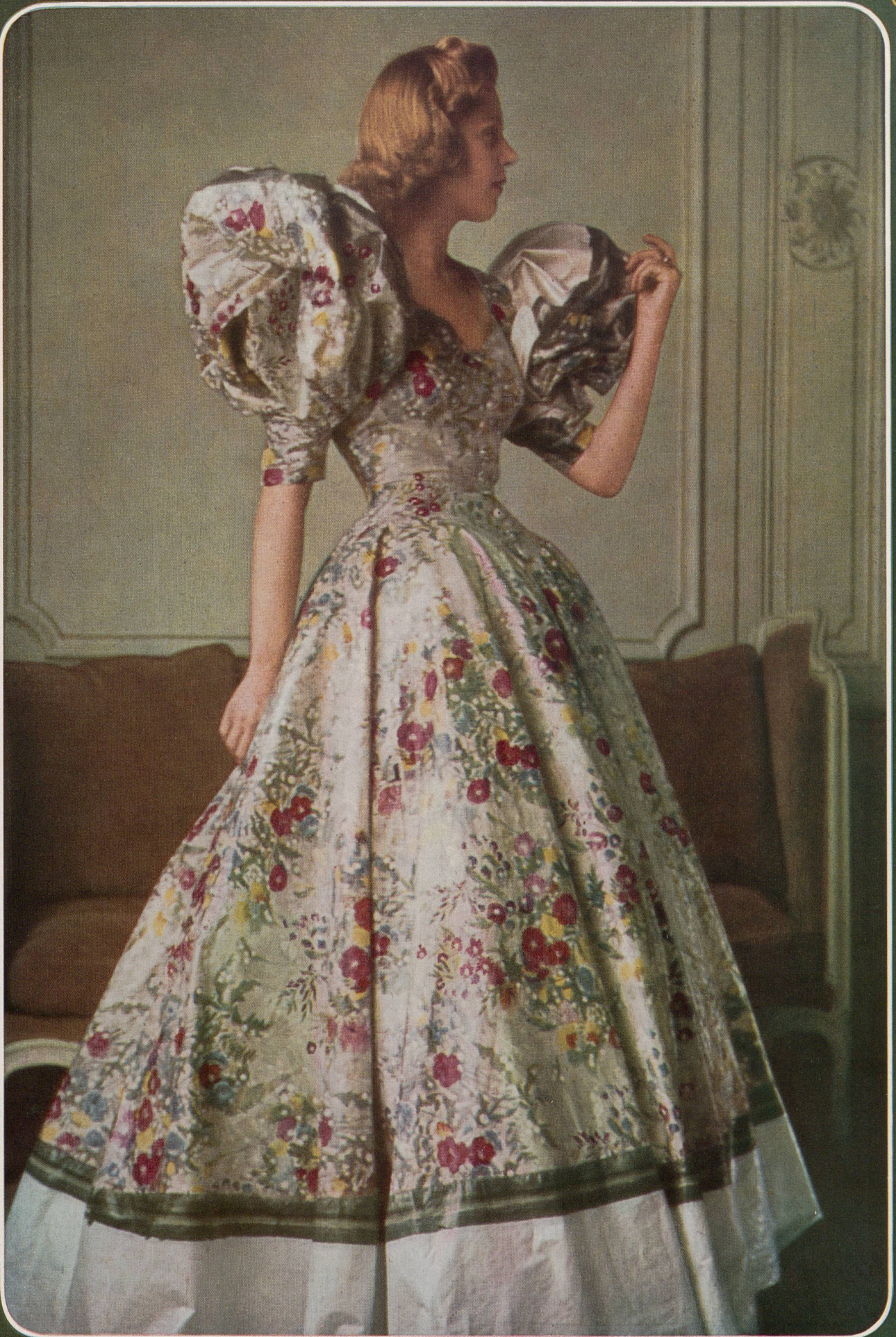
MAGGY ROUFF Stoffel & Cie, St-Gall