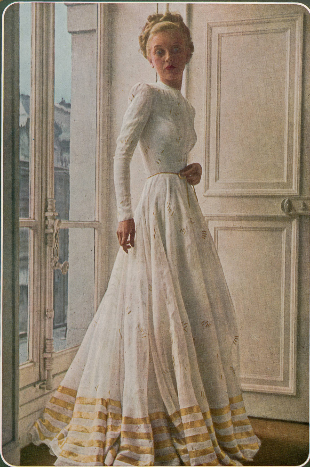
GRÈS Mettler et Cie S.A., St-Gall